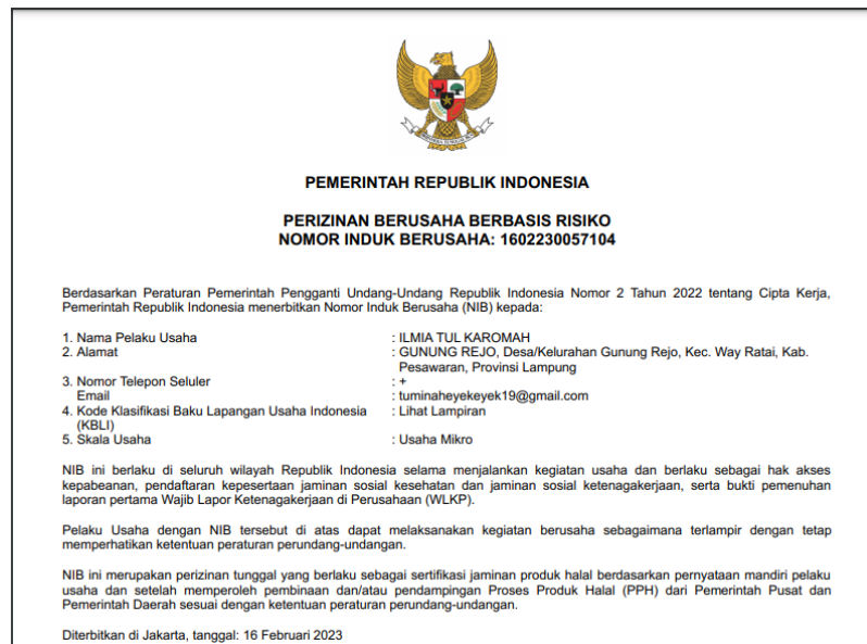
Gambar 5. Bukti Pembuatan NIB