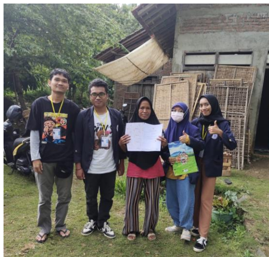
Gambar 7. Penyerahan kepada Pelaku Usaha