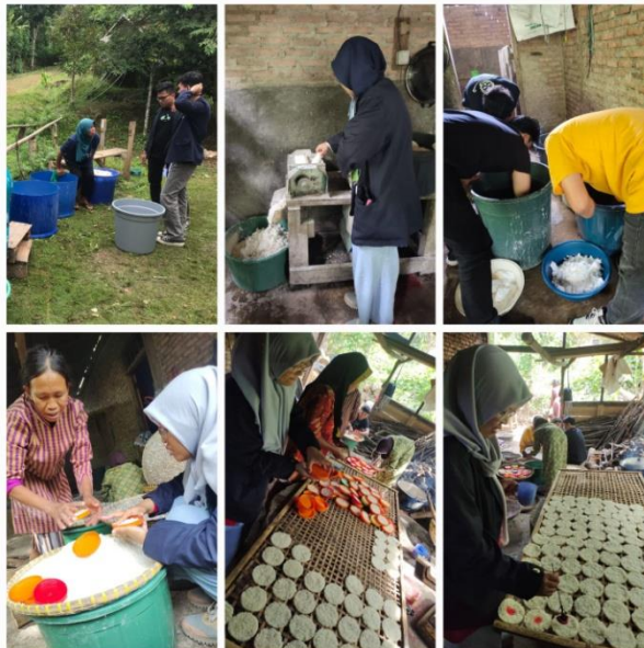
Gambar 3. Survey UMKM Trio Putri