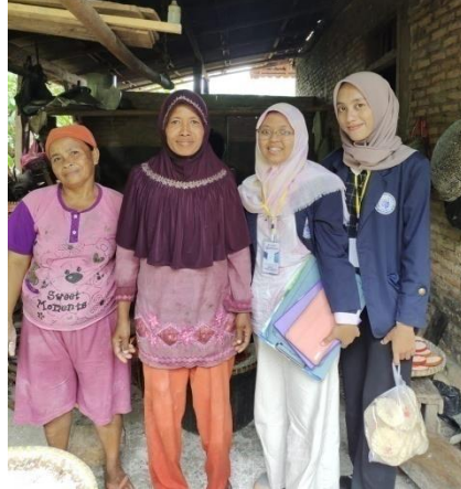
Gambar 4. Izin Pembuatan Logo, Label dan NIB