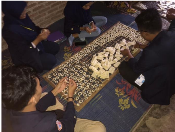
Gambar 2. Membantu Proses Pembuatan Kelanting