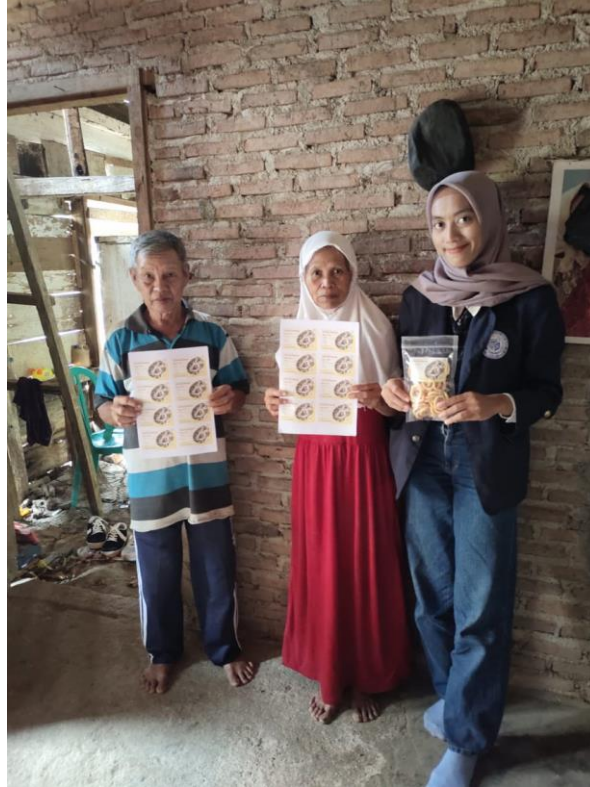
Gambar 7. Penyerahan Label Produk