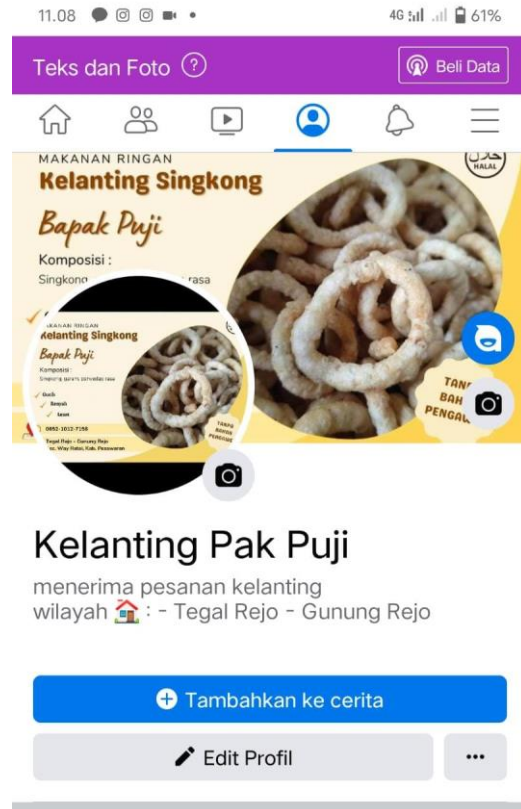
Gambar 6. Tampilan Produk dengan label baru