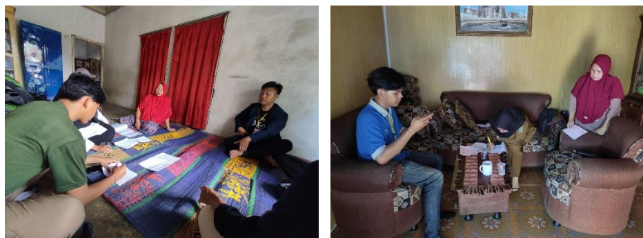
Gambar 2. 10 Sosialisai Pajak Bumi dan Bangunan (PBB)

Kunjungan ke UMKM Harum Tapis merupakan kegiatan yang bertujuan untuk mengumpulkan informasi serta silaturahmi kepada pemilik UMKM. Informasi yang dikumpulkan merupakan informasi yang akan diolah untuk dilakukannya sebuah terobosan inovasi yang akan dilakukan terhadap UMKM tersebut. Kegiatan kunjungan serta survei UMKM Harum Tapis dapat dilihat pada gambar 2.10.