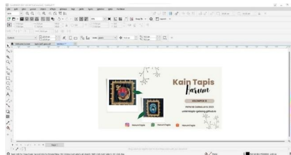
Gambar 2. 5 Pembuatan Desain Banner