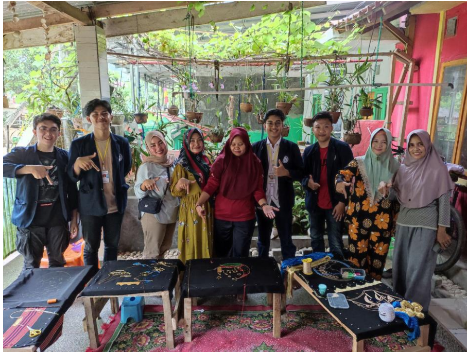
Gambar 2. 9 Survey Lokasi dan Kebutuhan UMKM Harum Tapis