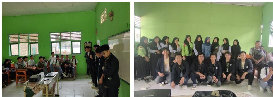
Gambar 2. 11 Sosialisasi “Konten Kreator” di MTS Mathlaul Anwar

Kegiatan sosialisasi ke MTS Mathlaul Anwar di Dusun Seribu Desa Gebang memiliki tujuan untuk mengedukasi pada siswa/i MTS Mathlalul Anwar agar dapat menggunakan smartphone yang dimilikinya untuk kegiatan yang produktif dan positif. Materi yang diangkat mengenai tentang “Konten Kreator”, materi ini dipilih karena para siswa/i mayoritas memiliki ketertarikan terhadap konten-konten digital pada berbagai aplikasi media sosial. Oleh sebab itu materi ini cocok diterapkan agar dapat membuka wawasan para siswa/I untuk dapat beralih profesi dari yang awalnya hanya menjadi penonton agar dapat mulai membuat konten dan menjadi seorang konten kreator yang kedepannya dapat memiliki value dan dapat menghasilkan. Kegiatan sosialisasi mengenai “Konten Kreator” di MTS Mathlaul Anwar dapat dilihat pada gambar 2.11.