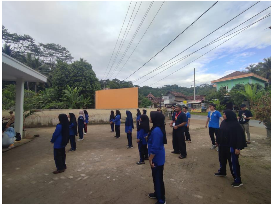
Gambar 2. 15 Senam Lansia Bersama Masyarakat Desa Gebang