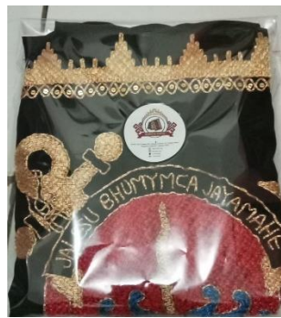
Gambar 2. 4 Kemasan Sesudah Memiliki Logo

Hasil kemasan sesudah memiliki logo pada UMKM Harum Tapis dapat dilihat pada gambar 2.4