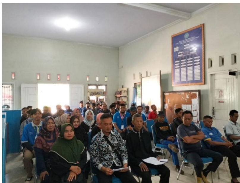
Gambar 2. 8 Musyawarah Pajak Bumi dan Bangunan (PBB)

Musyawarah bersama aparat desa gebang mengenai Pajak Bumi Bangunan (PBB) merupakan kegiatan yang dilakukan untuk memberi arahan kepada para aparat desa gebang yang dipimpin oleh Kepala Desa mengenai kegiatan yang akan dilakukan, yaitu para aparatur desa bersama mahasiswa akan terjun ke masyarakat untuk mensosialisasikan mengenai pentingnya membayar Pajak Bumi Bangunan (PBB). Kegiatan musyawarah mengenai Pajak Bumi Bangunan (PBB) bersama aparatur Desa Gebang dapat dilihat pada gambar 2.8.