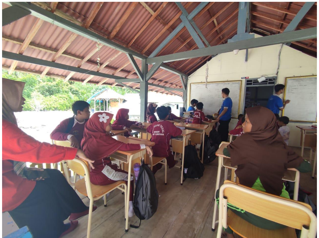
Gambar 2. 17 Mengajar di PKBM Pesona Pulau Tegal

Kegiatan mengajar di sekolah PKBM Pesona Pulau Tegal merupakan program kerja yang bertujuan untuk mengedukasi para siswa/i yang berada di sekolah PKBM Pulau Tegal. Pada siswa/i Sekolah Dasar diberikan materi-materi dasar seperti matematika dan bahasa inggris. Pada siswa/i Sekolah Menengah Pertama dan Sekolah Menengah Atas diberikan pelatihan cara membuat konten video yang baik dan menarik. Kegiatan mengajar di PKBM Pesona Pulau Tegal dapat dilihat pada gambar 2.17.