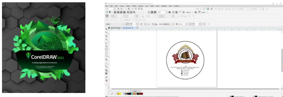
Gambar 2. 1 Pembuatan Logo

Logo merupakan suatu gambar, simbol atau sketsa yang menjadikan ciri khas yang membedakan suatu produk atau brand. Logo pada UMKM Harum Tapis menggunakan Corel Draw 2021 (64 bit). Logo pada UMKM Harum Tapis ini dibuat bertujuan agar menambah daya tarik masyarakat luar dan memudahkan dalam pemasaran atau penjualan. Rancangan pembuatan logo UMKM Harum Tapis dapat dilihat pada gambar 2.1.