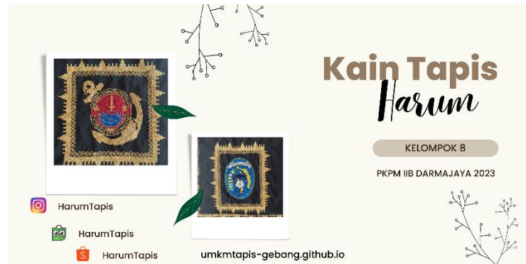
Gambar 2. 6 Hasil Pembuatan Banner

Hasil Pembuatan Banner untuk UMKM Harum Tapis dapat dilihat pada gambar 2.6.