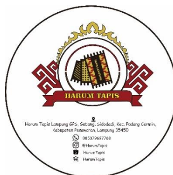
Gambar 2. 2 Hasil Tampilan Logo

Hasil dari pembuatan Logo UMKM Harum Tapis dapat dilihat pada gambar 2.2