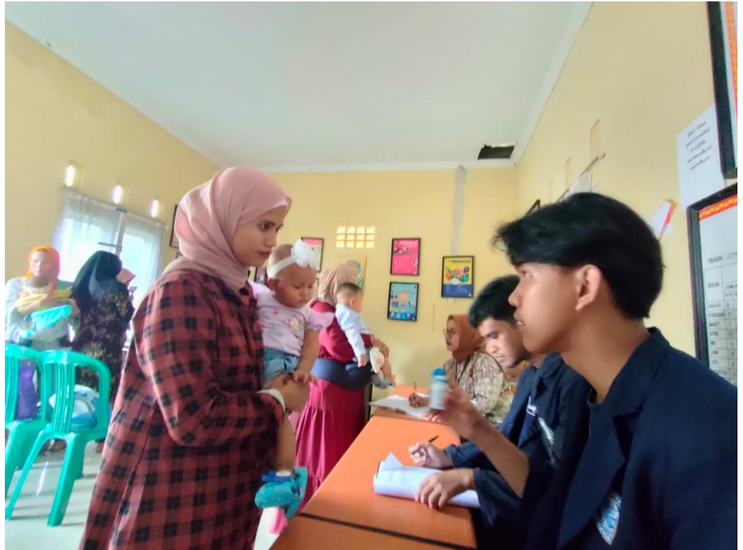
Gambar 2. 13 Posyandu Balita di Desa Gebang