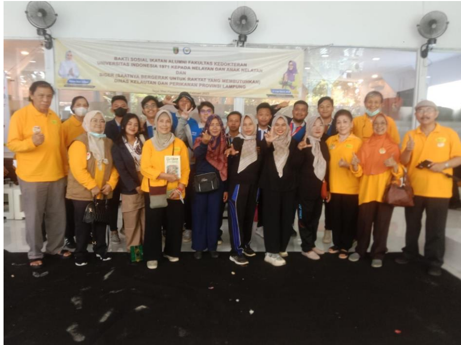
Gambar 2. 12 Kunjungan ke Pulau Tegal Mas Bersama Aparatur Desa Gebang