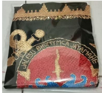
Gambar 2. 3 Kemasan Sebelum Memiliki Logo

Hasil kemasan sebelum memiliki logo pada UMKM Harum Tapis dapat dilihat pada gambar 2.3