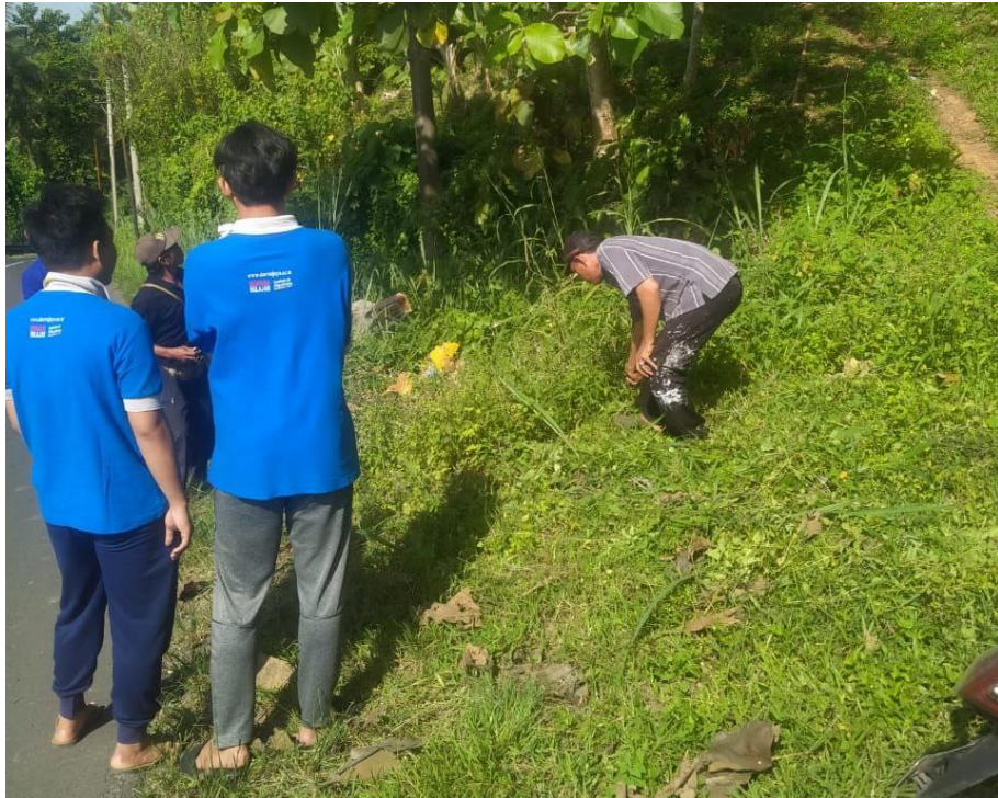
Gambar 2. 14 Gotong Royong Bersama Masyarakat Desa Gebang