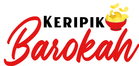
Gambar 2. 10 Logo UMKM Keripik Barokah

Manfaat logo dan label untuk pelaku UMKM yaitu untuk branding, meningkatkan kredibilitas usaha, menjangkau target pasar lebih luas kepada masyarakat luas, meningkatkan konsumen dan daya tarik masyarakat terhadap produk.