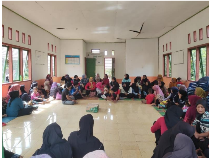
Gambar 2. 13 Kegiatan Ibu PKK