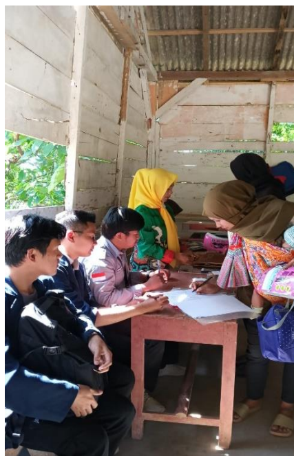
Gambar 2. 9 Posyandu Balita dan Ibu Hamil