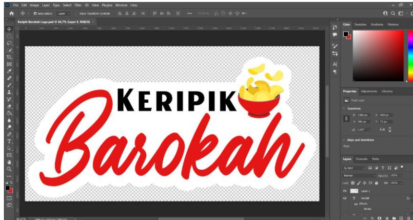
Gambar 2. 2 Proses Pembuatan Desain Logo Kemasan UMKM Di Photoshop