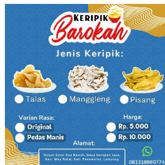
Gambar 2. 11 Label UMKM Keripik Barokah

Menurut (Wahyuni dkk., 2021) dalam bukunya yang berjudul VINEGAR NIRA AREN . Label adalah salah satu bagian dari produk berupa keterangan baik gambar maupun kata-kata yang berfungsi sebagai sumber informasi produk dan penjual.