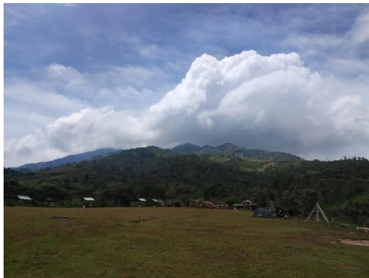
Gambar 2. 7 Pengambilan Video Profil Desa