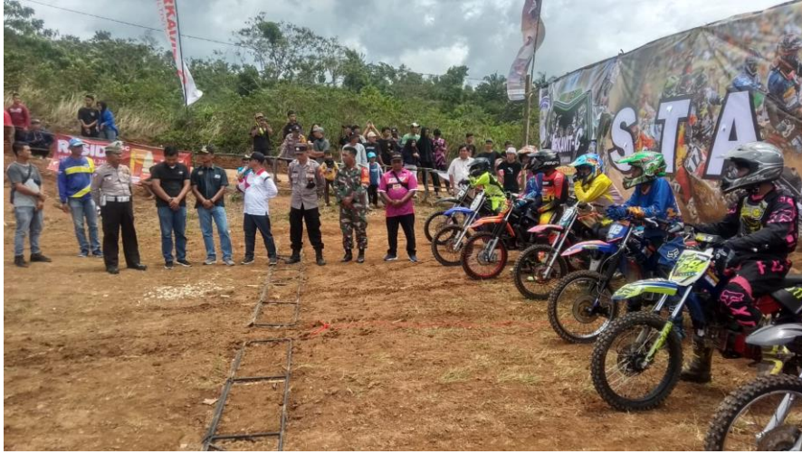
Gambar 2. 4 Panitia Administrasi Grass Track