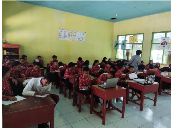
Gambar 2. 8 Sosialisasi Pelatihan Microsoft Word ke SDN 16