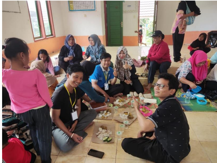
Gambar 2. 6 Sosialisasi Ibu-Ibu PKK