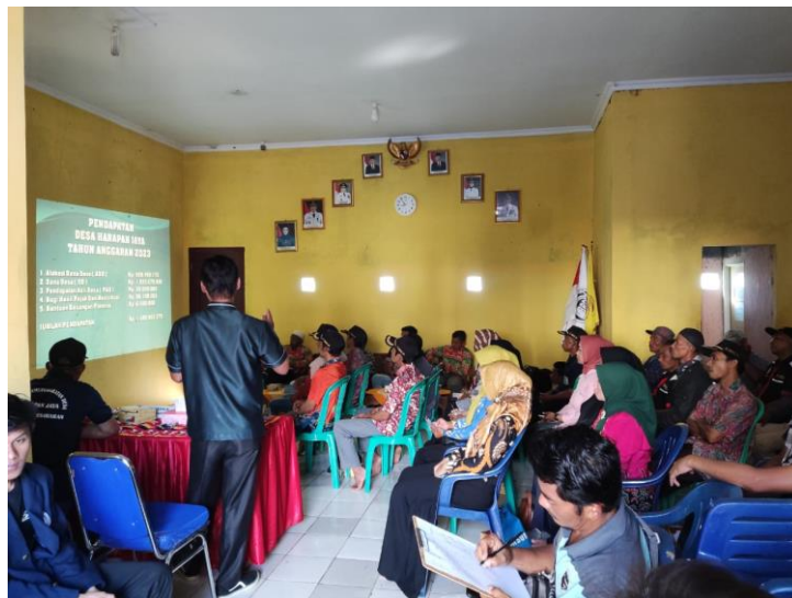
Gambar 2. 3 Musyawarah Pendapatan Desa Harapan Jaya