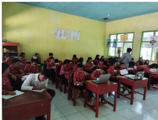
Gambar 2. 15 Kegiatan Pelatihan Ketik Microsoft Office Word

Pelatihan ketik Microsoft Office Word ini dilakukan agar para pelajar sd dapat belajar menggunakan aplikasi word dikarenakan sangat membantu proses pembelajaran serta mempermudah para pelajar dan pendidik ketika membuat materi pembelajaran. Dengan menggunakan aplikasi pengolah data tersebut dapat menciptakan sebuah proses pembelajaran yang sistematis dan menarik. Perkembangan teknologi khususnya untuk kalangan pelajar bertujuan untuk mengoptimalkan pemanfaatan penggunaan aplikasi yang mudah untuk kedepannya.