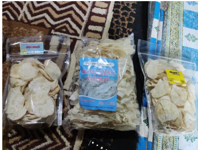
Gambar 2. 12 Pengambilan Foto Produk UMKM Keripik Barokah

barang yang akan dibeli. Oleh karena itu, tampilan produk berperan signifikan untuk meningkatkan potensi penjualan kepada para konsumen. Semakin menarik gambar, logo dan label pada kemasan produk yang ditayangkan, maka potensi penjualan bisnis juga dapat meningkat.