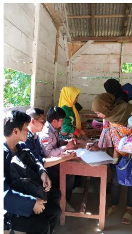
Gambar 2. 14 Kegiatan Posyandu

Kegiatan posyandu rutin dilakukan di Balai Pertemuan Desa Harapan Jaya yang dibina oleh Ibu. Adapun posyandu yang dilakukan di desa adalah posyandu ibu hamil, balita dan lansia. Untuk posyandu di desa ini dilaksanakan setiap 3 kali dalam 1 bulan.