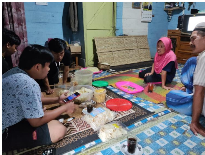
Gambar 2. 5 Kunjungan dan Survei UMKM Keripik Barokah