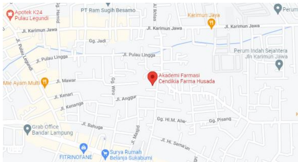
Gambar 2.4. Lokasi Akademi Farmasi Cendikia Farma Husada

Berikut adalah alamat Akademi Farmasi Cendikia Farma Husada yaitu tempat penulis dalam melakukan kegiatan kerja praktek (KP) menurut Google Maps yang ditampilkan pada Gambar 2.4 .