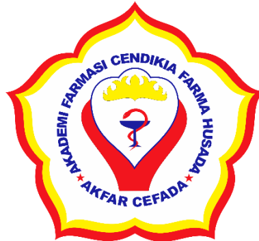
Gambar 2.2.3. Logo Akademi Farmasi Cendikia Farma Husada

Bentuk dasar mengambil dari unsur-unsur sebagai berikut: