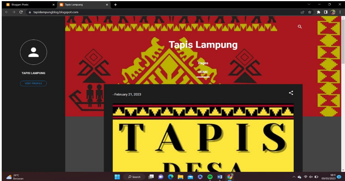
Gambar 2.4 Hasil akhir Blog Tapis Lampung Desa Gebang

Untuk desain pada kemasan menggunakan paper bag dan stiker logo Tapis Desa Gebang pada gambar 2.5 sebagai berikut :