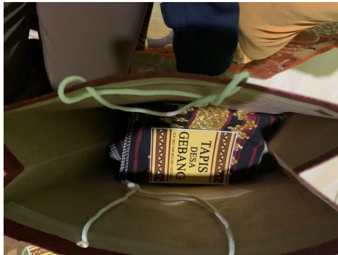
Gambar 2.5 Contoh kemasan terbaru Tapis Desa Gebang

Untuk desain pada kemasan menggunakan paper bag dan stiker logo Tapis Desa Gebang pada gambar 2.5 sebagai berikut :