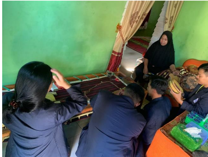
Gambar 2.6 Proses Pembuatan Tapis di UMKM Tapis Gebang

Kegiatan ini merupakan untuk proses pembuatan Kain Tapis UMKM ibu Lestari yang bisa dilihat pada gambar 2.6 sebagai berikut :