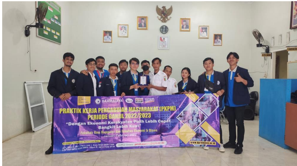
Gambar 2.8 Pemberian Cindramata Kepada Aparat Desa

Pada gambar 2.8 berikut merupakan pemberian cindramata kepada aparat desa dan balai desa. Serta berpamitan kepada aparat desa dan pemilik UMKM.