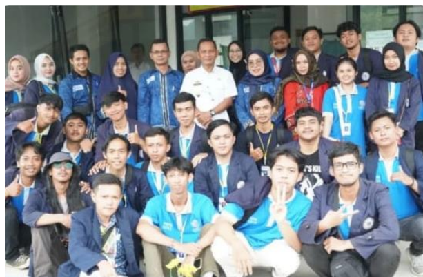
Gambar 2.10 Penutupan PKPM 2023

Kegiatan ini merupakan kegiatan penutupan dari PKPM 2023 yang dilaksanakan di kantor Kecamatan Teluk Pandan. Gambar 2.10 berikut merupakan dokumentasi penutupan kegiatan PKPM 2023.