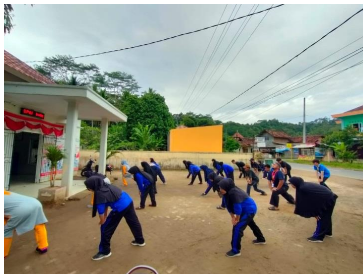
Gambar 2.7 Senam Lansia

Kegiatan ini bertujuan untuk memberi semangat kepada warga dan aparat desa lansia agar dapat menjaga kesehatan jantung, otot dan tulang. Kegiatan ini dapat dilihat pada gambar 2.7 dibawah ini :