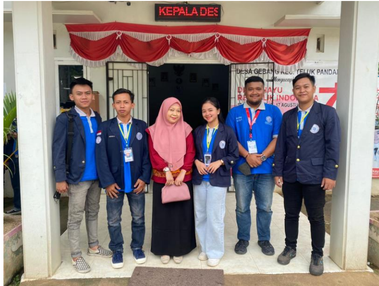
Gambar 2.1 Pengantaran Peserta PKPM di kantor Desa Gebang

Kegiatan ini merupakan pembukaan dan pelepasan peserta PKPM 2023 di kantor Balai Desa Gebang. Dapat dilihat pada gambar 2.1 berikut :