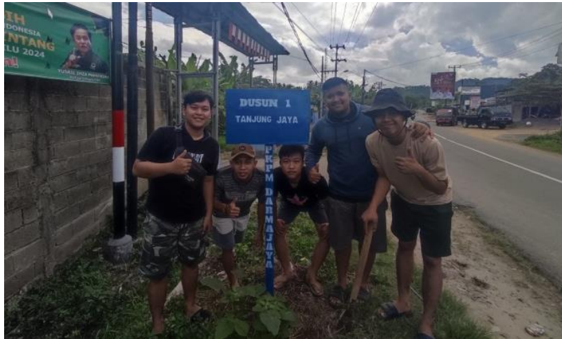
Gambar 2.9 Pemasangan Plang Dusun

Kegiatan ini merupakan pemberian cindramata berupa plang dusun yang terdiri dari 6 dusun yaitu : Dusun Tanjung Jaya, Dusun Gebang Hilir, Dusun Gebang Induk, Dusun Sinar Harapan, Dusun Suka Agung dan Dusun Seribu di gambar 2.9 dibawah ini :