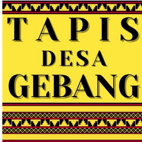
Gambar 2.2 Pembuatan desain logo dan packaging Tapis Gebang

Untuk pembuatan blog Tapis Desa Gebang berisi tentang artikel informasi sejarah, cara pembuatan, model desain dan corak tapis serta profil UMKM Tapis tersebut. Pada gambar 2.3 berikut merupakan tampilan proses pembuatan blog :