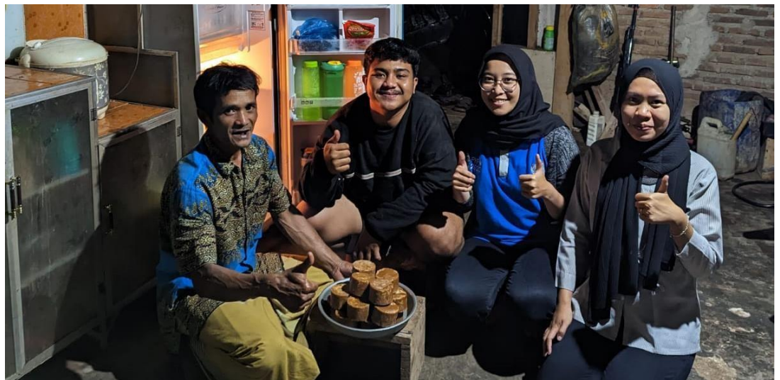
Kunjungan UMKM Gula Aren