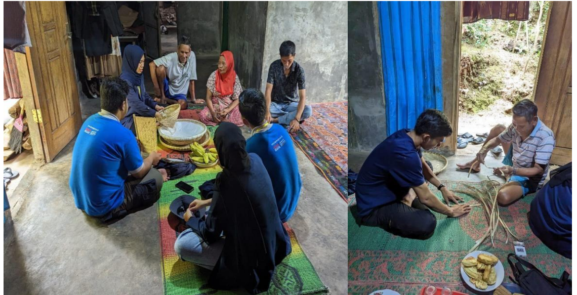
Kunjungan UMKM Kerajinan Tangan