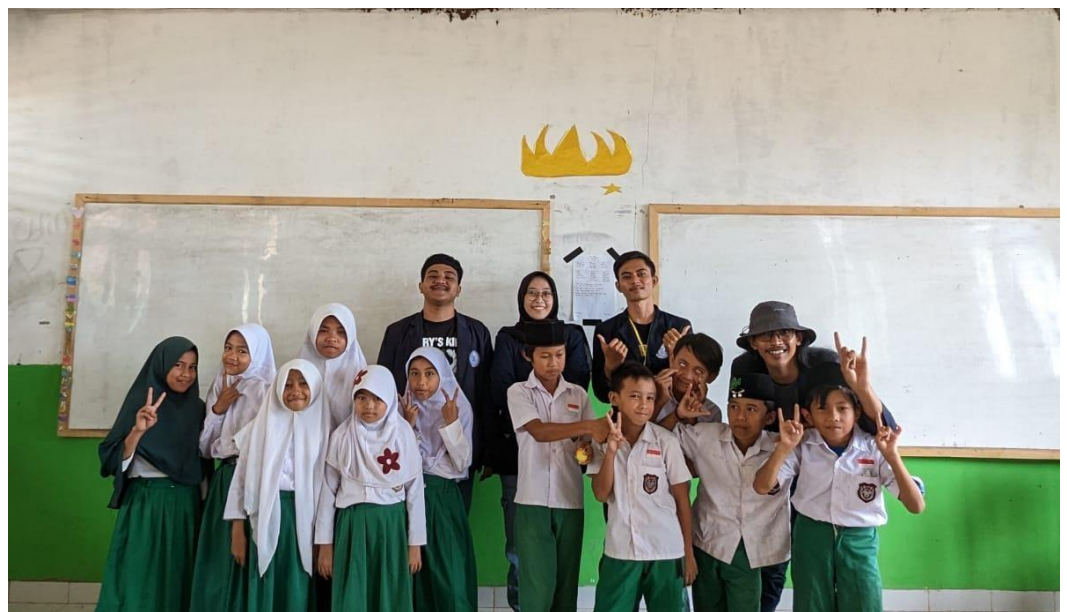
Sosialisasi Bahaya Penggunaan Gadget di MI-Al Falah