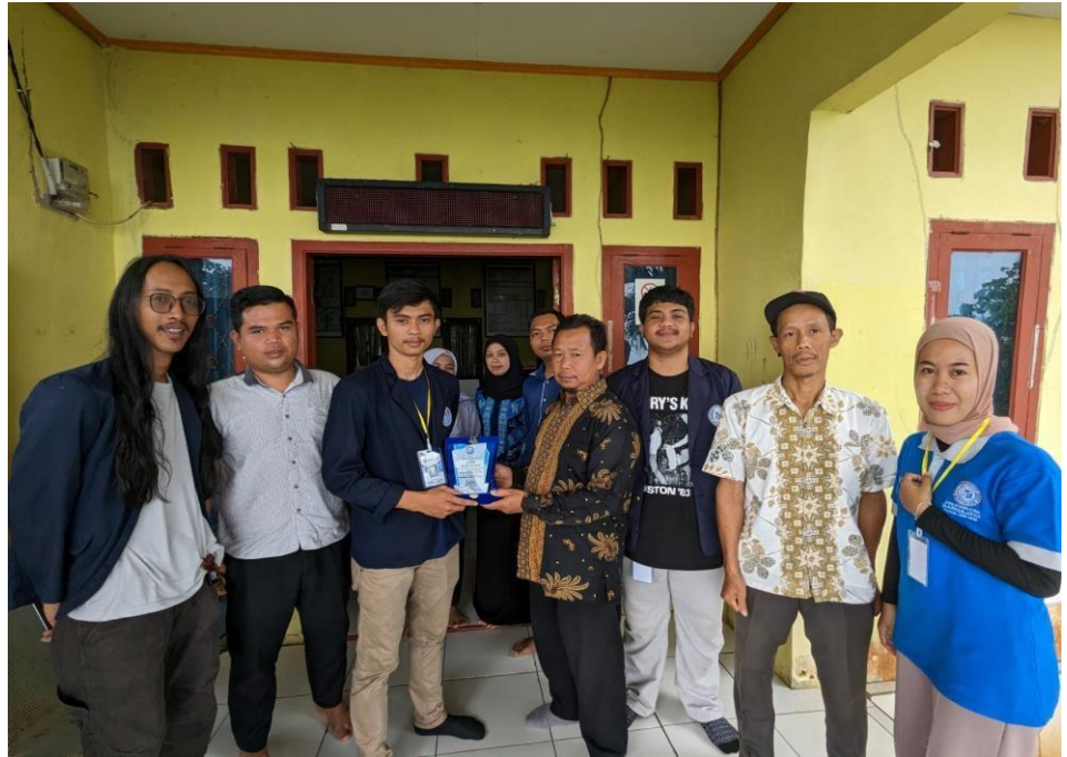
Perpisahan dan Penyerahan Plakat Kepada Aparatur Desa Munca