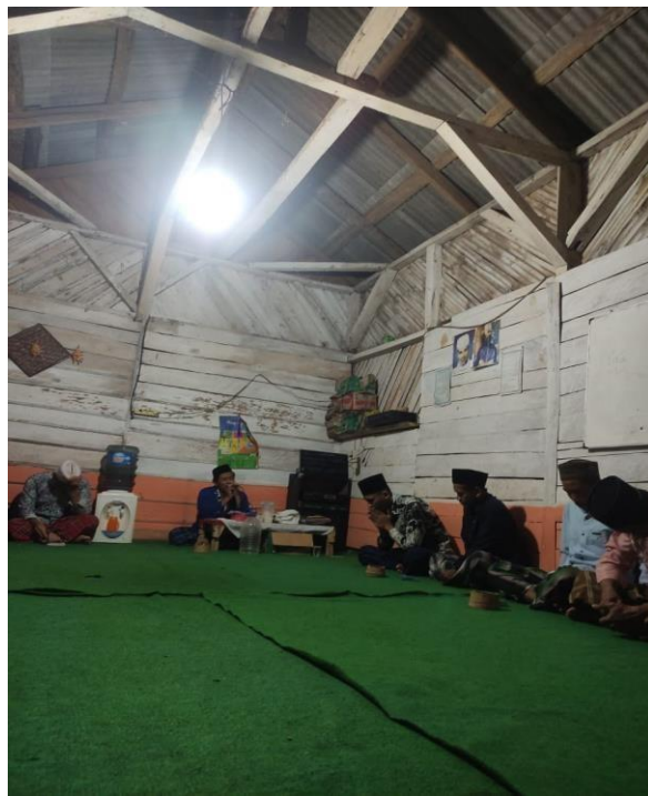
Pengajian Rutin Bapak-bapak di Desa Munca