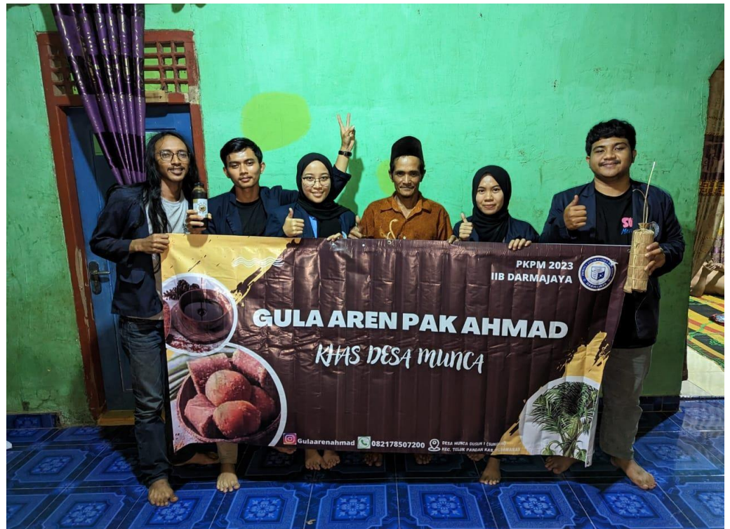
Penyerahan Banner UMKM Gula Aren