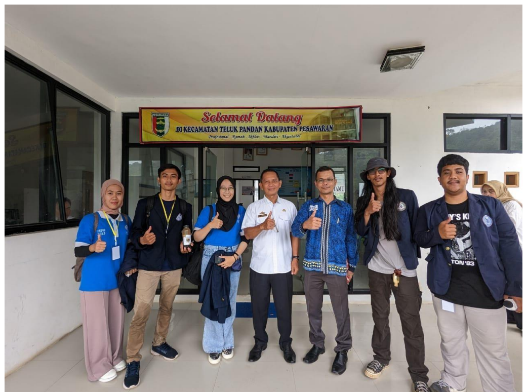
Penjemputan Mahasiswa PKPM di Kecamatan Teluk Pandan