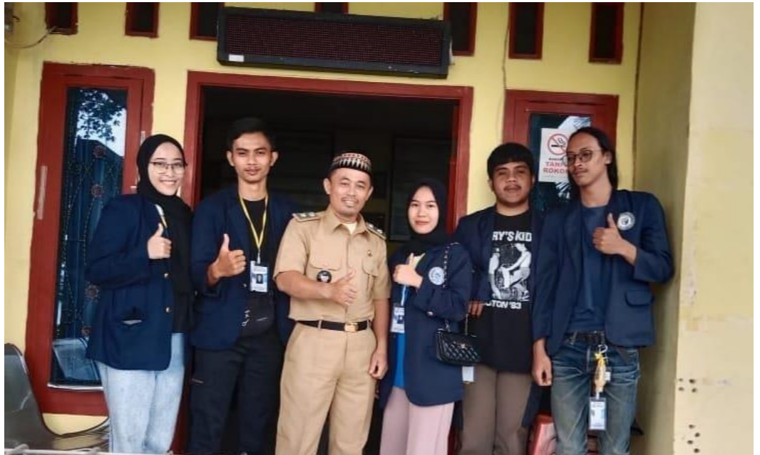
Meminta izin PKPM kepada Kepala Desa Munca