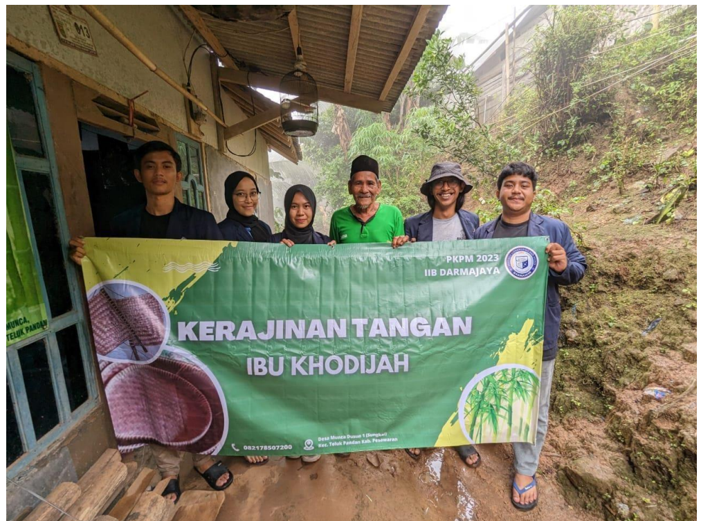
Penyerahan Banner UMKM Kerajinan Tangan