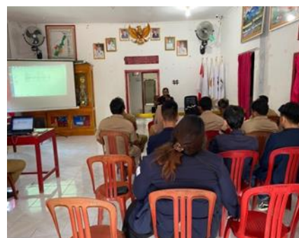
Rapat APBDes di Balai Desa Mulyo Sari