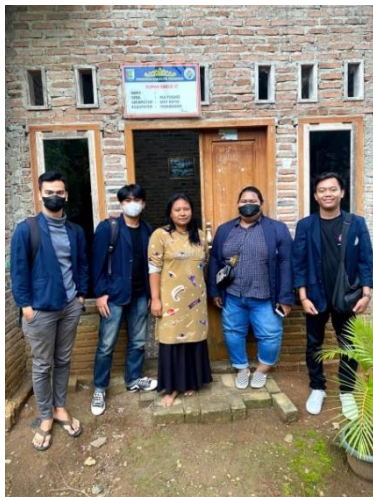
Survey lokasi rumah penempatan mahasiswa PKPM