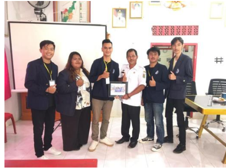
Presentasi Hasil Program Kerja Mahasiswa PKPM dan Serah Terima Kepala Desa Mulyo Sari