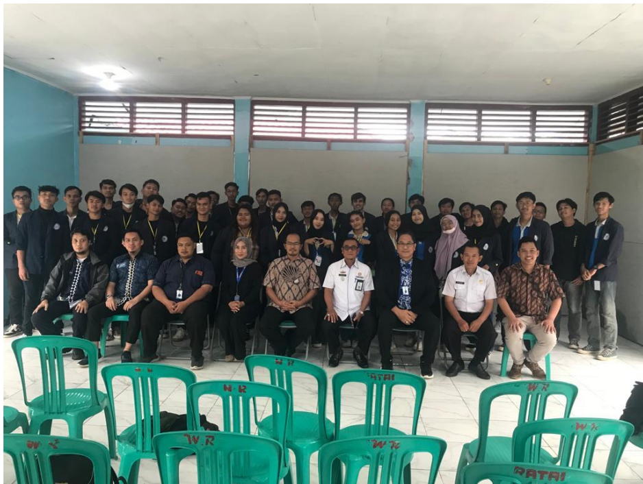
Pelepasan mahasiswa PKPM di Kecamatan Way Ratai