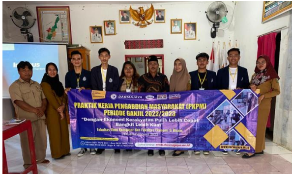
Foto bersama aparatur desa