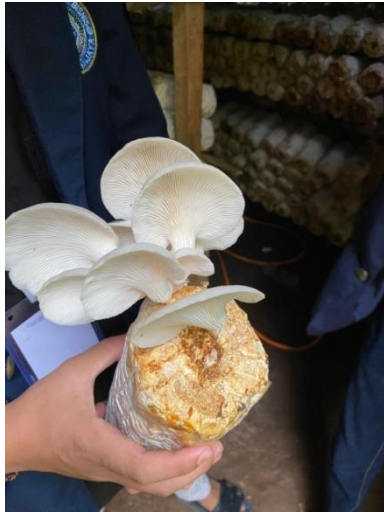
Survey ke UMKM Jamur Tiram (Omah Jamur Pelangi)