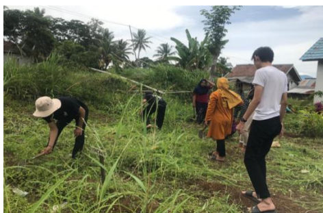
Gotong Royong di Dusun Mulyo Sari