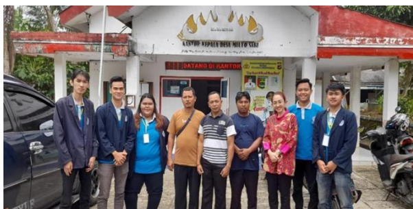
Kunjungan DPL di balai desa