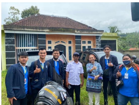
Foto bersama DPL dan Aparatur Desa Mulyo Sari pada saat penyerahan mahasiswa PKPM di Kecamatan Way Ratai