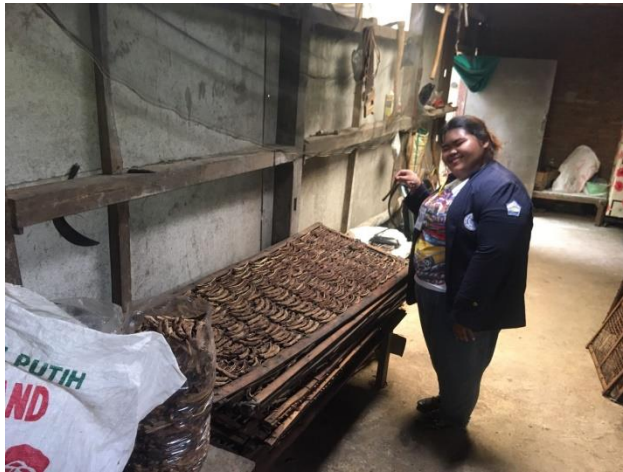
Survey ke UMKM Sale Pisang Cahaya Mahkota