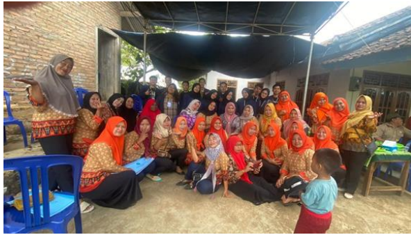
Foto Bersama Ibu – ibu PKK Dalam Kegiatan RAKOR (Rapat Koordinasi)