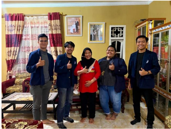
Mengunjungi rumah Kepala Desa