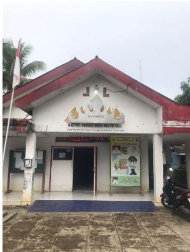
Survey ke balai desa