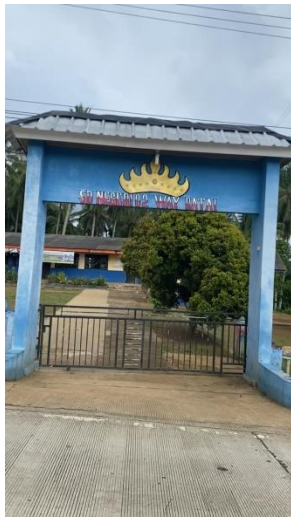
Survey ke SDN 02 Way Ratai