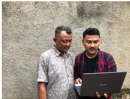
Gambar 2.3 Kegiatan Pelatihan Web

Web adalah kumpulan halaman yang berisi informasi tertentu dan dapat diakses dengan mudah oleh siapapun, kapanpun, dan di manapun melalui internet. Web digunakan sebagai media informasi, di mana setiap orang dapat menyampaikan dan menerima informasi. Cukup dengan membuka alamat website, maka seseorang dapat mengetahui berbagai macam informasi yang tersedia di dalam halaman web tersebut. Web berfungsi sebagai media informasi terbaru dan menarik untuk dibaca oleh pengguna internet. Selain web juga dijadikan sebagai sarana edukasi seperti tutorial, tips dan trik dan lain-lain. (Trimarsiah & Arafat, 2017)