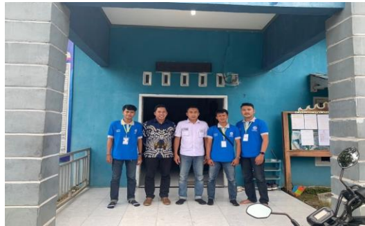
Gambar 2.1 Kegiatan Survei

Agar PKPM berlangsung dengan baik hal yang dapat dilakukan adalah dengan mengunjungi Balai desa Ceringin Asri yang terletak di Desa Ceringin Asri, Kec. Way Ratai, Kabupaten Pesawaran, Lampung dan menyerahkan surat izin pelaksanaan PKPM dan meminta arahan dan dukungan.