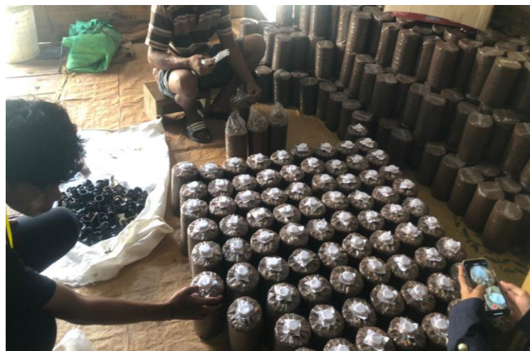
Gambar 2.2 Kegiatan Tahap Awal Pembuatan Jamur

Para pelaku usaha UMKM berhadapan dengan permasalahan pemasaran bagi produk mereka. UMKM kalah bersaing dengan produk-produk industri besar yang mapan dalam bidang pembiayaan dan mapan dalam strategi pemasaran. Strategi pemasaran memegang kendali, namun masih banyak UMKM yang masih menganggap sepele hal tersebut. Pengenalan web berjalan dengan lancar, pelatihan di mulai dengan menjelaskan apa itu web, apa itu blogger dan bagaimana cara menggunakannya.