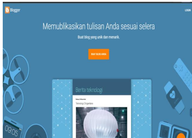
Gambar 2.5 Pembuatan Akun Blogger

Setelah pembuatan email, saya memandu pak purwadi untuk membuat web menggunakan blogger, sekaligus menjelaskan apa itu blogger, blogger merupakan salah satu platform pembuatan website. Setelah menjelaskan blogger saya langsung mengarahkan pak purwadi untuk membuat akun pada laman blogger