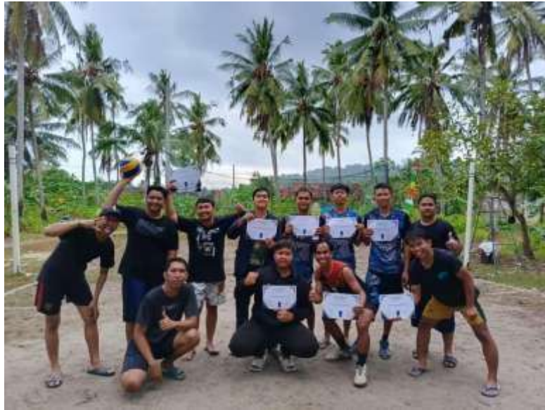
Gambar 2.11 Penyerahan Sertifikat Lomba

Kegiatan ini bertujuan Memberi apresiasi kepada pemenang perlombaan voly yang diselenggarakan oleh mahasiswa PKPM dalam rangka menjalin silaturahmi kepada masyarakat Desa pulau Pahawang