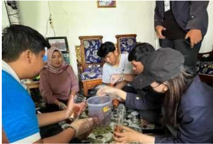
Gambar 2.6 Membantu Pengemasan Produk UMKM

2.3.5 Mengunjungi Dan Ikut Serta Dalam Praktik Packing Emping Jengkol Melakukan kunjungan terhadap UMKM Desa Pulau Pahawang yaitu Roti Gabin Tape dan Emping Jengkol yang bertujuan untuk memberikan inovasi pengemasan secara vacum agar produk lebih tahan lama dan juga memberikan saran logo baru untuk produk UMKM tersebut.