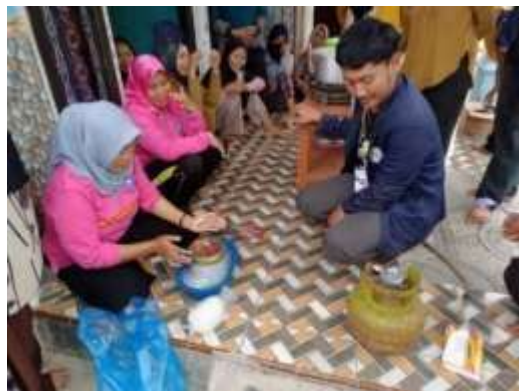
Gambar 2.10 Dokumentasi Pembuatan Coconut Jelly dan Eskrim Santan