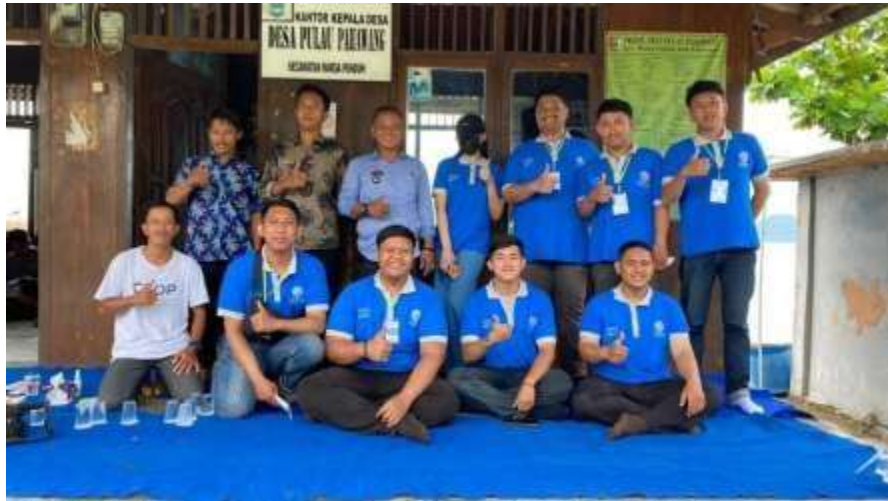
Gambar 2.2 Foto Bersama Aparatur Desa Dibalai Desa Pulau Pahawang