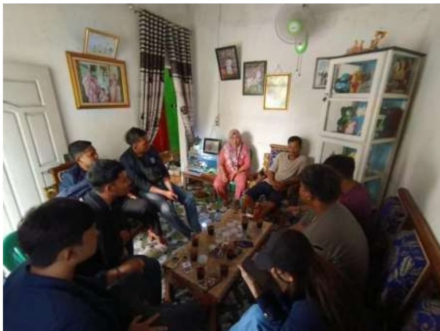
Gambar 2.3 Foto Pemilik UMKM

Mengunjungi lokasi pembuatan Emping Jengkol dan Roti Gabin Tape untuk kebutuhan informasi terkait UMKM mulai dari harga jual, kemasan yang digunakan serta pemasaran.