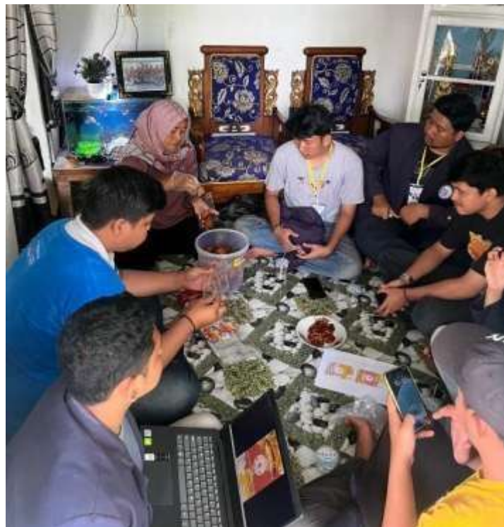
Gambar 2.7 Membantu Pengemasan Produk UMKM