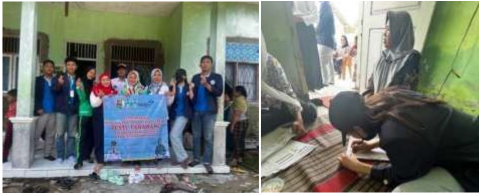
Gambar 2.9 Dokumentasi penyuluhan Program KB