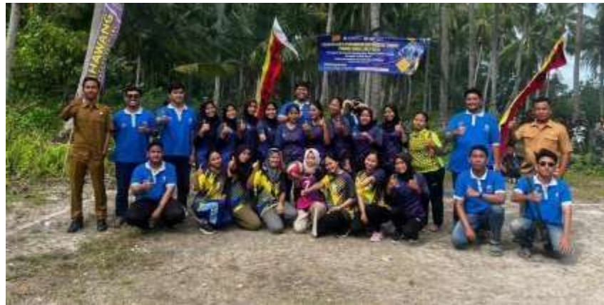
Gambar 2.8 Foto bersama peserta lomba & Aparatur Desa

Mengadakan kegiatan perlombaan Bola Volly antar dusun di Desa Pulau Pahawang, yang bertujuan agar masyarakat aktif dalam bidang olahraga, menjalin silaturahmi, dan juga dengan adanya perlombaan ini kegiatan PKPM yang kami lakukan tidak hanya dirasakan oleh 1 atau 2 dusun saja namun bisa berdampak secara merata bagi seluruh dusun di Desa Pahawang.