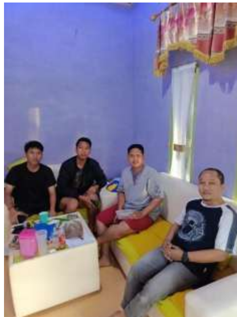
Gambar 2.5 Foto Kunjungan DPL

Dosen pembimbing lapangan melakukan kunjungan pada tanggal 19 februari 2023 guna memantau perkembangan kelompok kami.