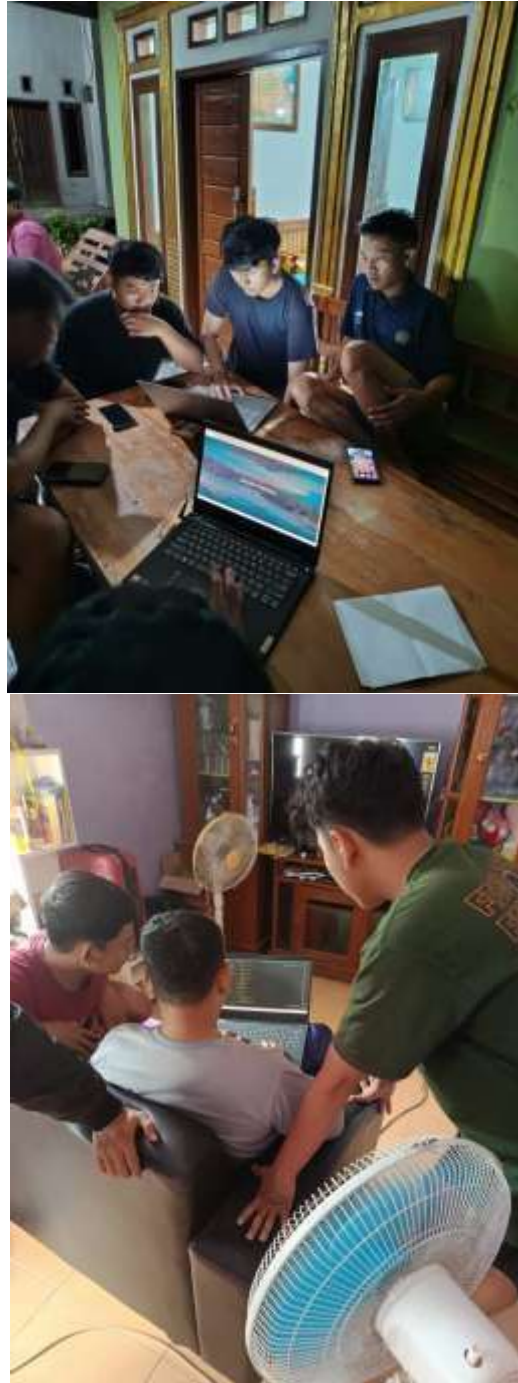
Gambar 2.12 Pembuatan program digitalisasi landing page

2.3.11 Hasil kerja program landing page berupa halaman di website bisa dapat di lihat dengan meng klik link dibawah ini