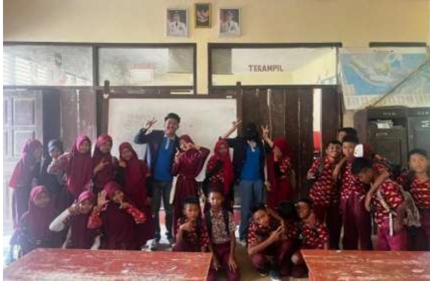
Gambar 2.4 Dokumentasi bersama Siswa/I

Kegiatan program pembelajaran digital yang dilaksanakan pada tanggal 15 sampai tanggal 16 Februari di SDN 8 Marga Punduh.