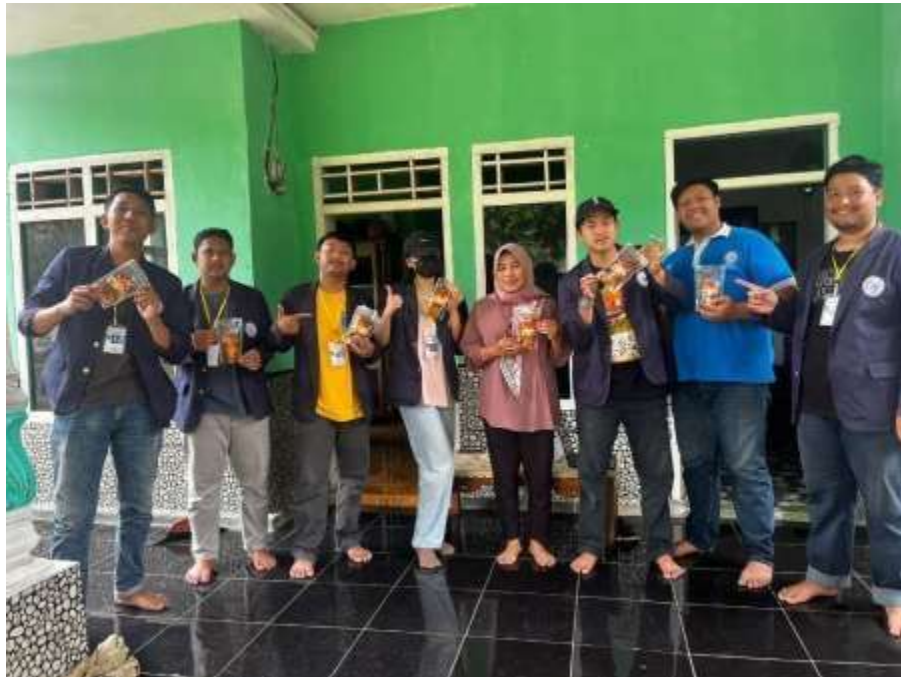
Dokumentasi Foto Bersama Pemilik UMKM