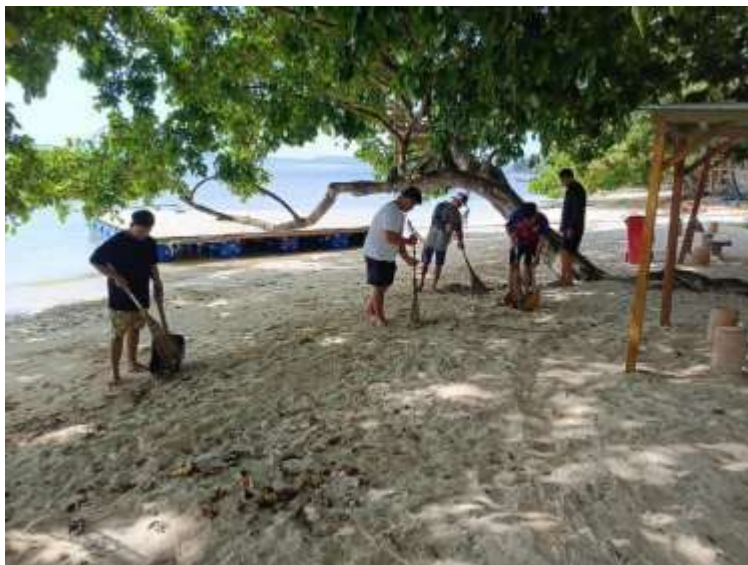
Dokumentasi Kerja bakti membersihkan pantai