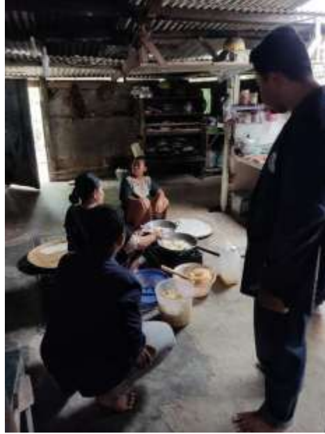
Dokumentasi membantu ibu-ibu membuat kerupuk