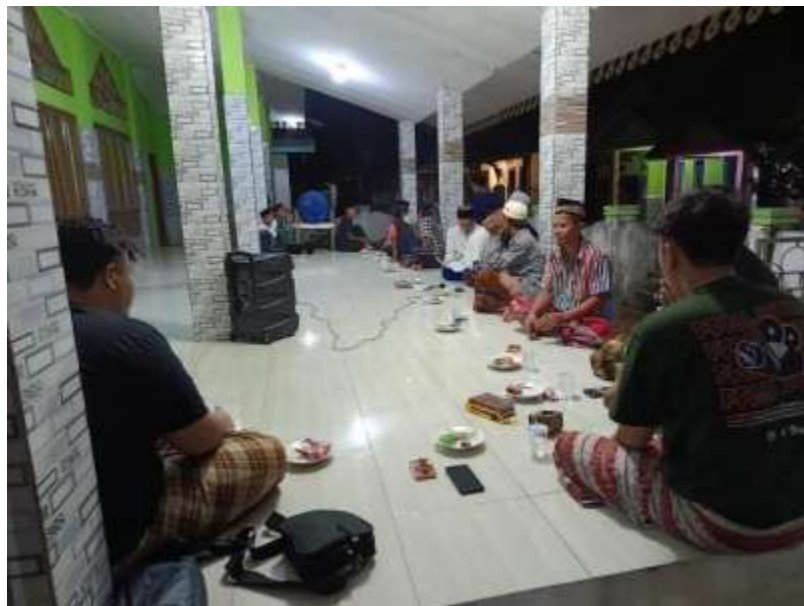
Dokumentasi pengajian bersama bapak-bapak