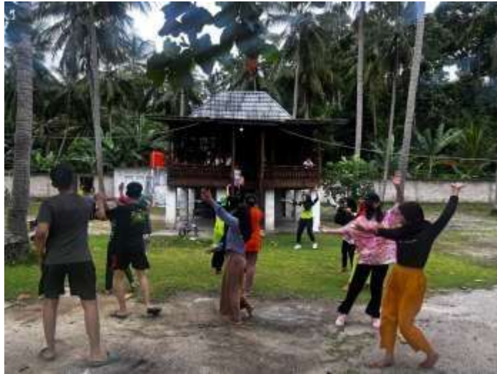
Dokumentasi Kegiatan Senam