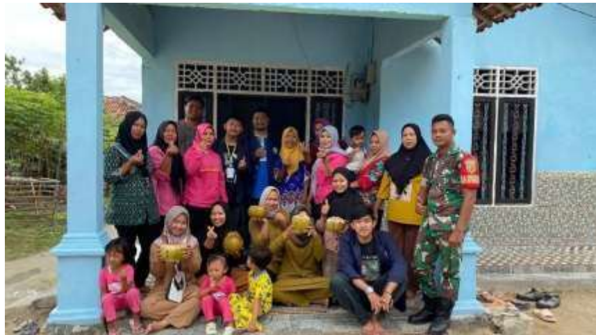
Dokumentasi Foto Bersama ibu-ibu PKK Dan Babinsa