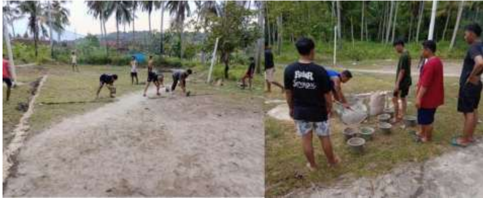
Dokumentasi pembersihan dan membangun kembali lapangan Volly