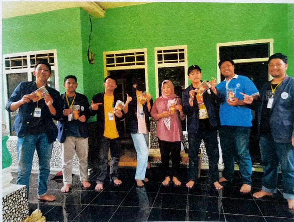
Dokumentasi Foto Bersama Pemilik UMKM