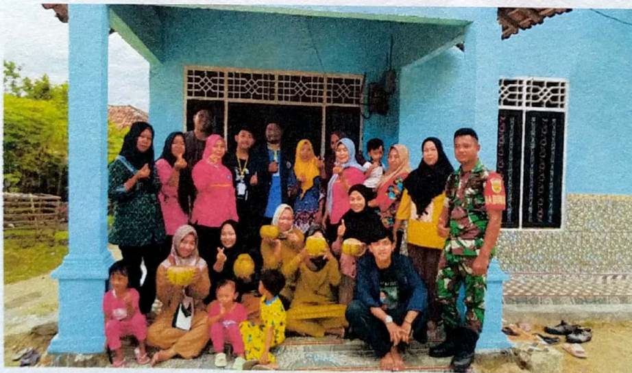
Dokumentasi Foto Bersama ibu-ibu PKK Dan Babinsa