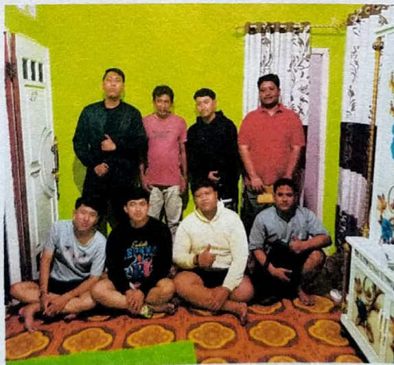
Dokumentasi Foto bersama bapak RT Dusun III Jeralangan