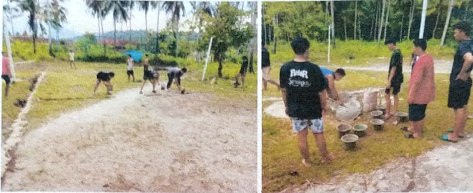
Dokumentasi pembersihan dan membangun kembali lapangan Voli