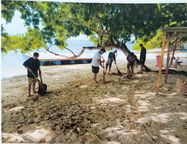
Dokumentasi Kerja bakti membersihkan pantai