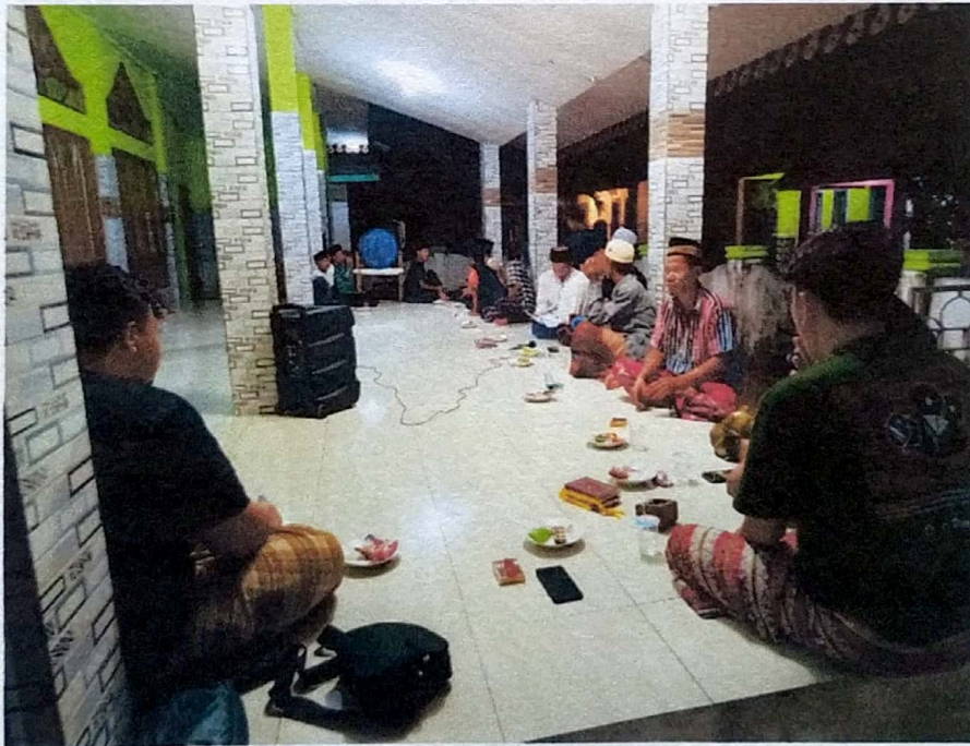
Dokumentasi pengajian bersama bapak-bapak