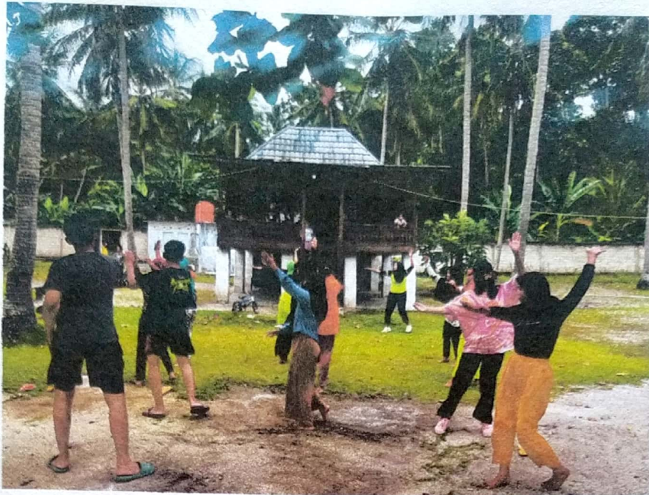
Dokumentasi Kegiatan Senam