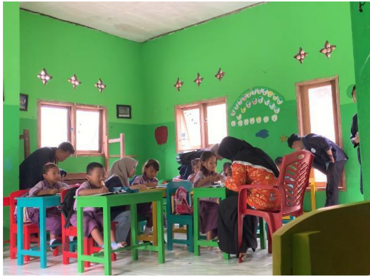
Kegiatan mengajar di PAUD Tunas Mulia