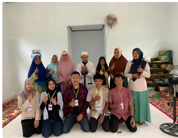
Foto Bersama Ibu-Ibu Pengajian Banyumas I