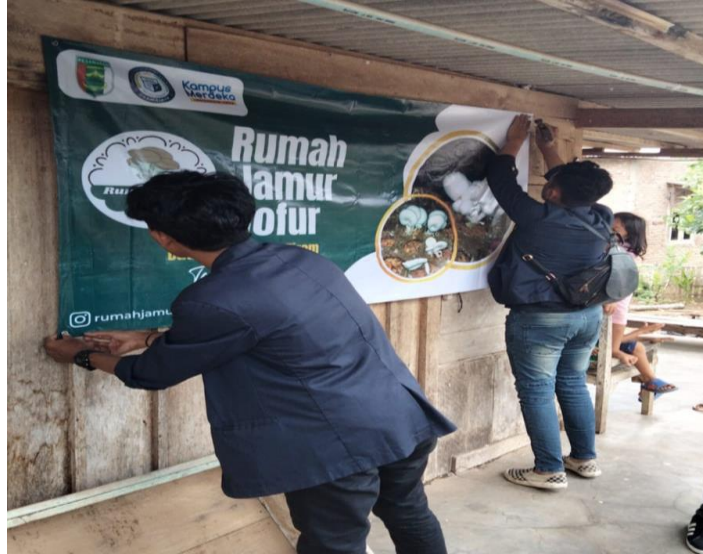
Pemasangan banner dirumah pemilik UMKM