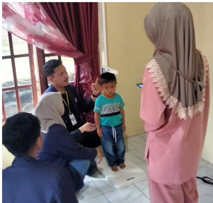
Kegiatan mencegah stunting balita di posyandu