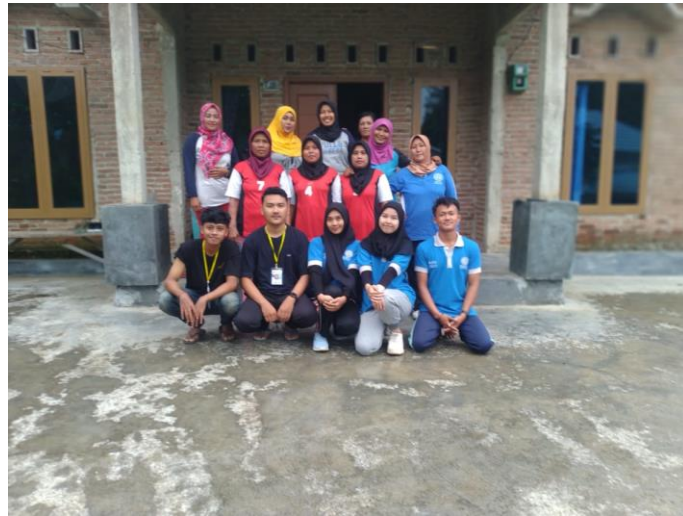
Foto Bersama Ibu-Ibu Senam Banyumas I