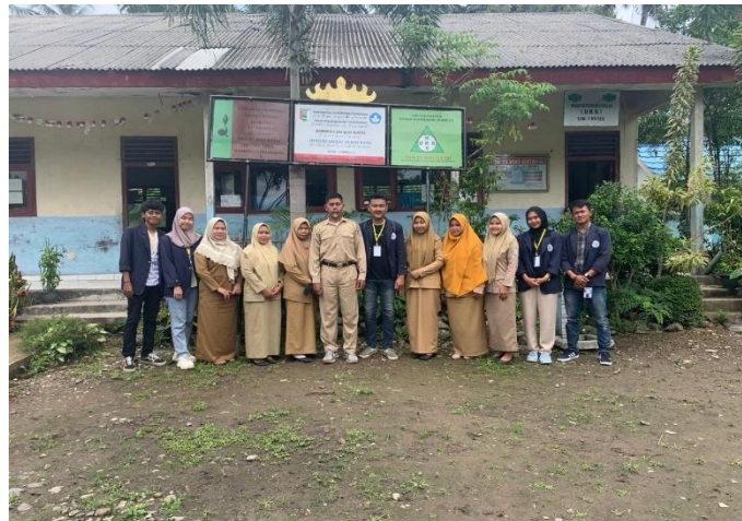
Foto Bersama Guru-Guru SDN 15 Way Ratai