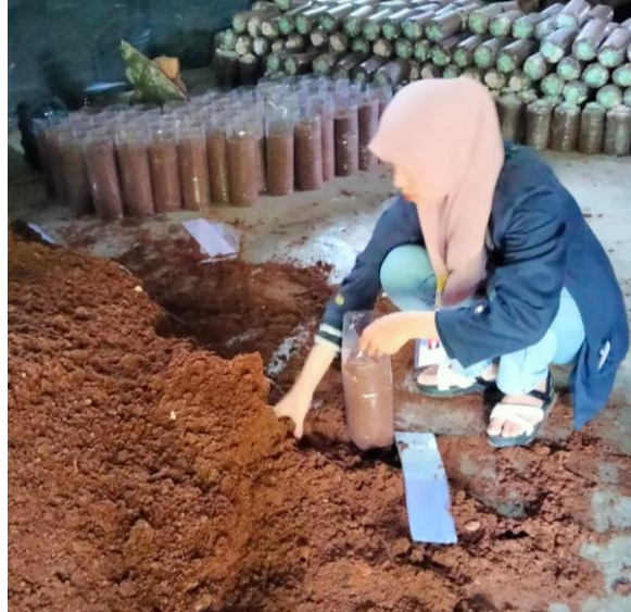
Kegiatan dalam membuat media tanam jamur tiram