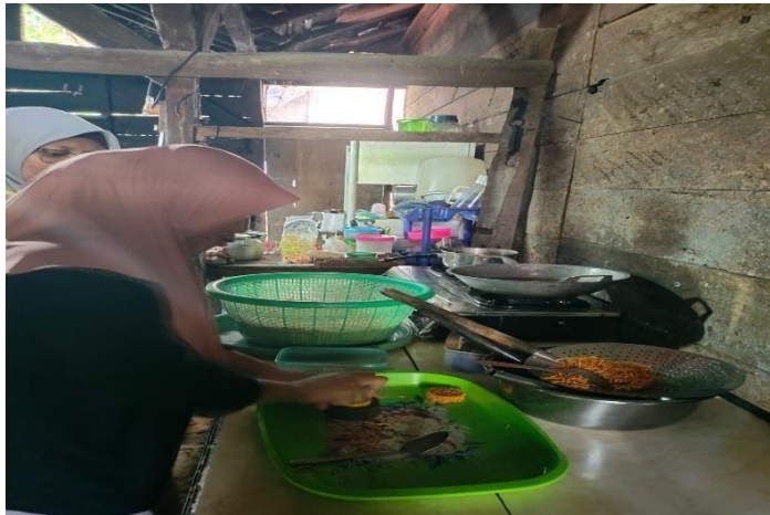
Gambar 4. Membantu Proses Pembuatan Grubi