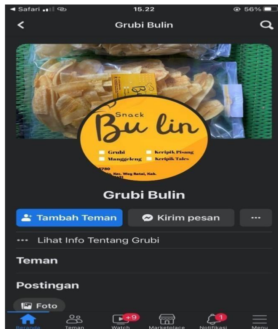
Gambar 7. Tampilan Akun Media Sosial Facebook