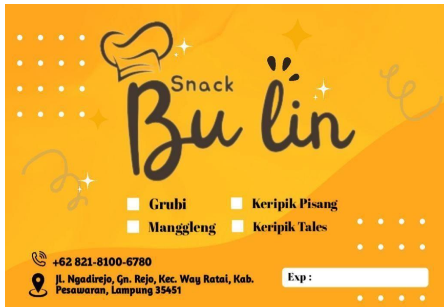
Gambar 6. Tampilan Produk Dan Label Yang Sudah Jadi