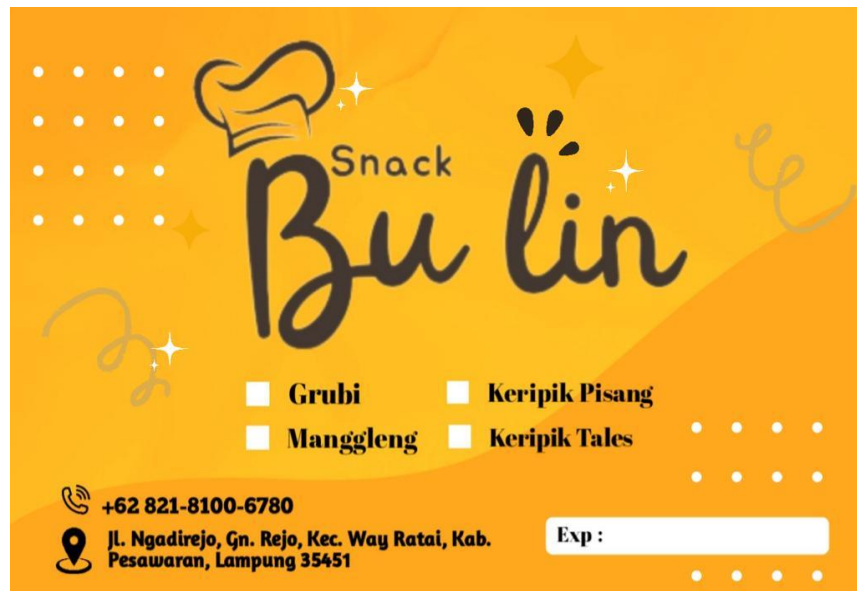
Gambar 4. Tampilan Label Yang Telah Di Buat

Label adalah salah satu bagian dari produk berupa keterangan baik gambar maupun kata-kata yang berfungsi sebagai sumber informasi produk dan penjualan.