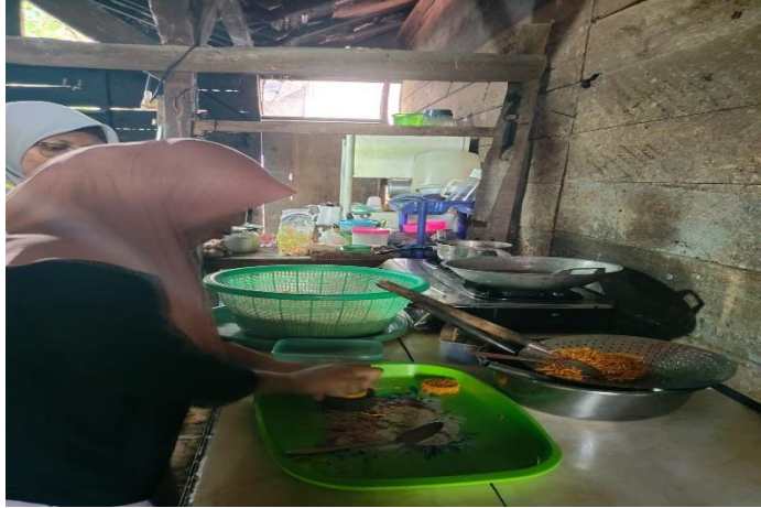
Gambar 3. Membantu Proses Pembuatan Grubi