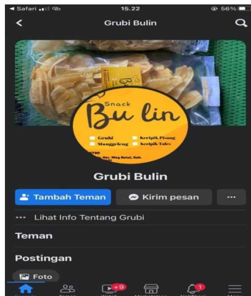
Gambar 6. Tampilan Akun Media Sosial Faceook