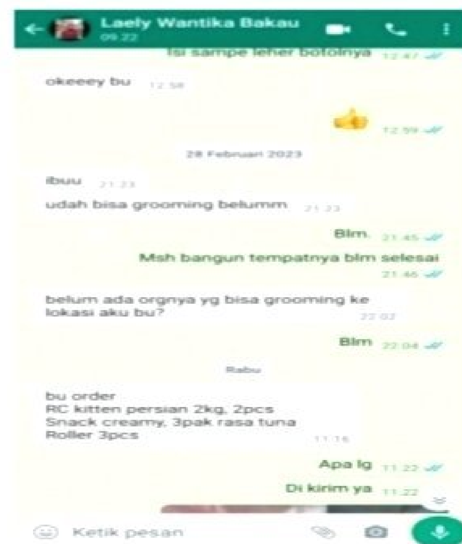
Gambar 2.1 Penedukasian Konsumen melalui Media Sosial