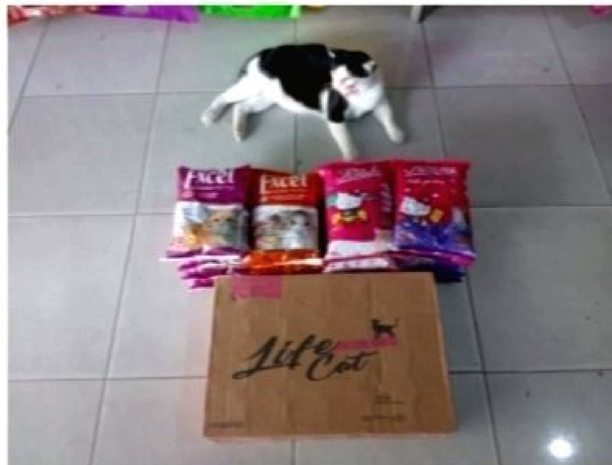
Gambar 4.3 Proses Distribusi Produk dari BB Petshop