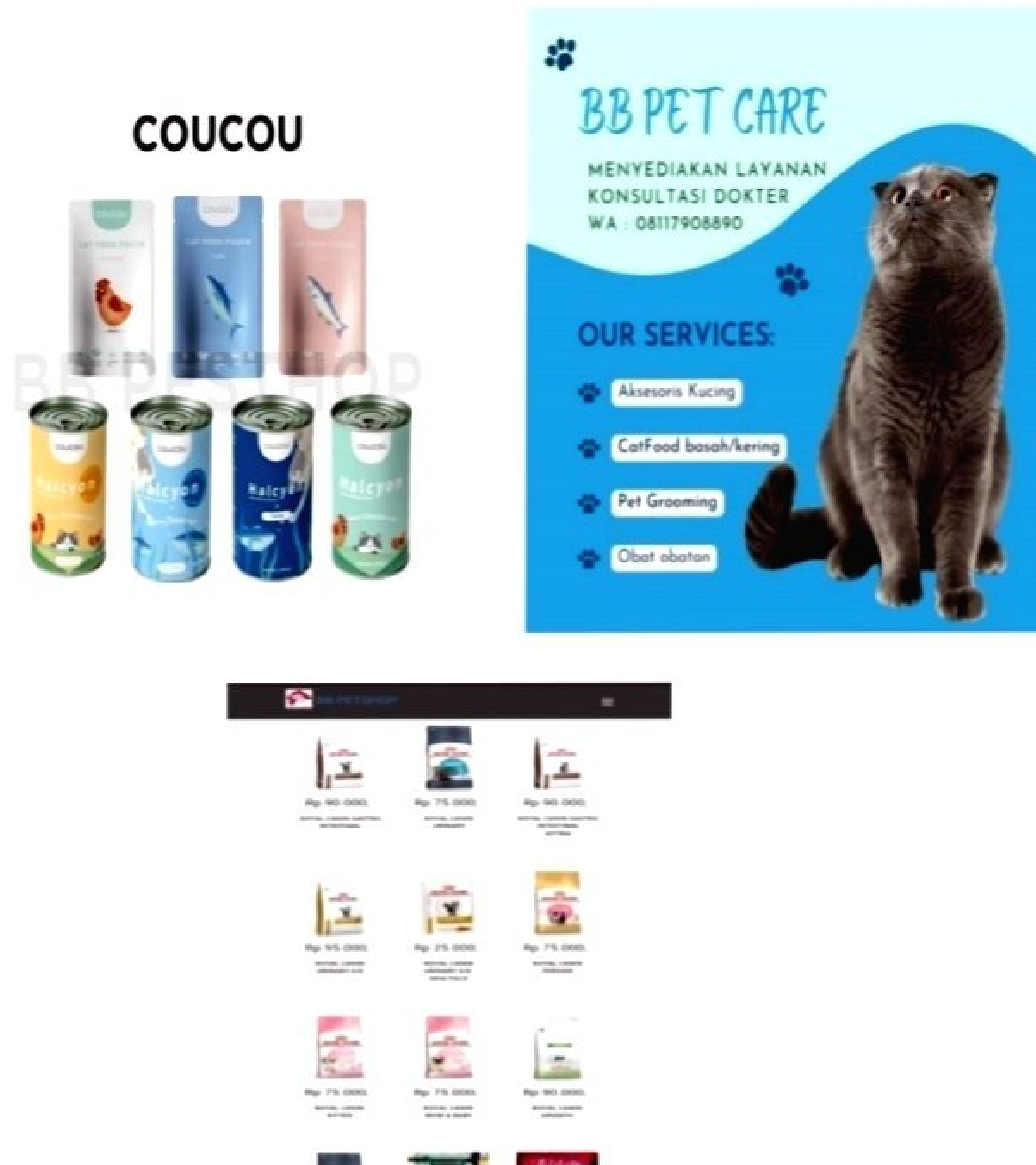
Gambar 4.2 Pembuatan Media Promosi Menarik

Dengan hastag yang konsisten dan tentunya responsif dalam menanggapi respon dari calon konsumen. Dalam pemanfaatan media promosi ini BB Petshop memanfaatkan platform media sosial seperti instagram dan whatapps dan platform e-commerce dalam memperjual belikan produk dan jasa layanannya.