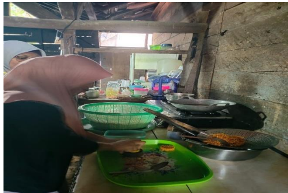
Gambar 4. Membantu Proses Pembuatan Grubi