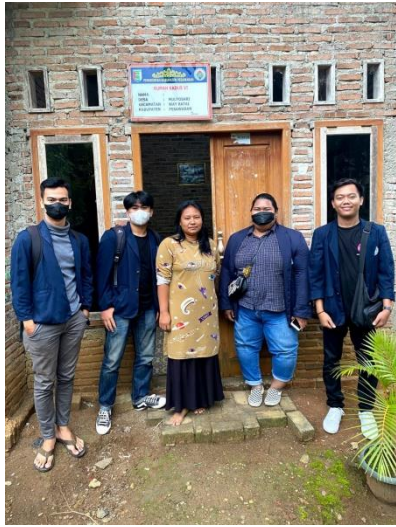
Survey lokasi rumah penempatan mahasiswa PKPM