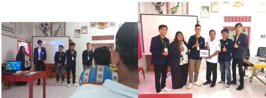
Presentasi Hasil Program Kerja Mahasiswa PKPM dan Serah Terima Kepala Desa Mulyo Sari