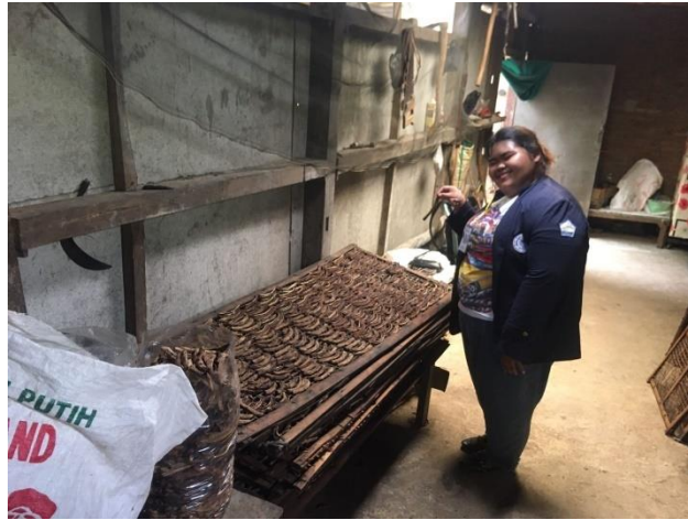
Survey ke UMKM Sale Pisang Cahaya Mahkota