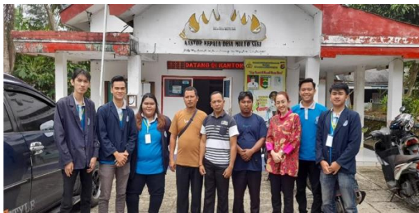
Kunjungan DPL di balai desa