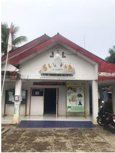
Survey ke Balai Desa