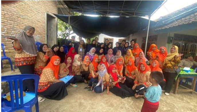
Foto Bersama Ibu – ibu PKK Dalam Kegiatan RAKOR (Rapat Koordinasi)