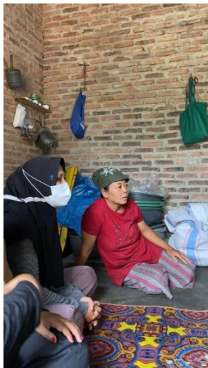
Survey ke UMKM Kerupuk Klenganan Barokah