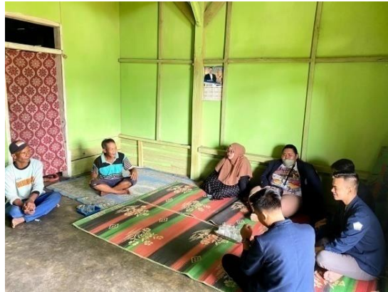
Diskusi tentang proses pembuatan desain Grafis.