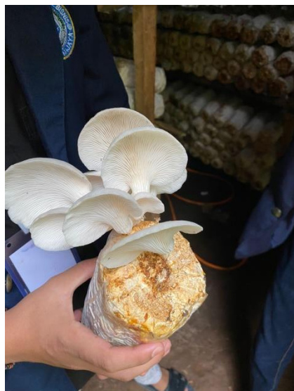
Survey ke UMKM Jamur Tiram (Omah Jamur Pelangi)