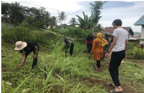
Gotong Royong di Dusun Mulyo Sari