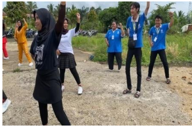
Kegiatan Senam Ibu – ibu PKK