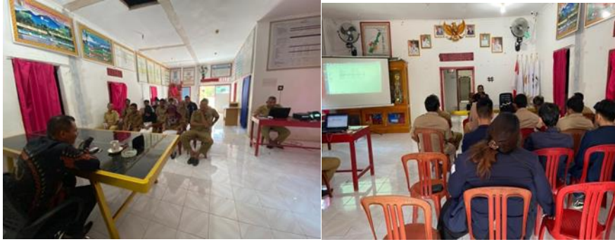
Rapat APBDes di Balai Desa Mulyo Sari