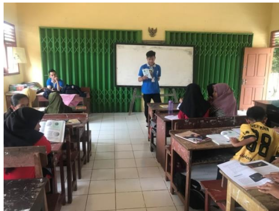
Pelaksanaan Bimbingan belajar Bersama siswa/i SDN 02 Way ratai.