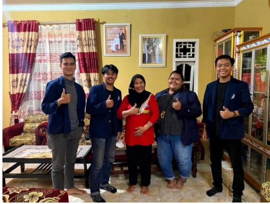
Mengunjungi rumah Kepala Desa