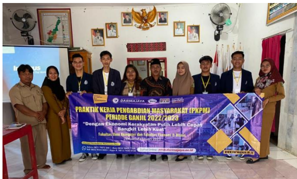
Foto bersama aparatuer desa