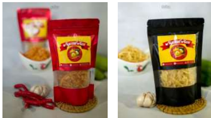
Gambar 1.3 Produk Sesudah Dikemas

Permasalahan yang dimiliki oleh UMKM Ngemil Ken adalah dalam hal pemasaran. Pemasaran masih dititipkan ke warung-warung dan juga via Whatsapp. UMKM Ngemil Ken belum memiliki media promosi cetak seperti banner agar UMKM ini dapat dikenali oleh masyarakat luas dan belum memiliki titik lokasi Google Maps untuk memudahkan mencari lokasi. UMKM Ngemil Ken sudah memiliki e-commerce yaitu shopee dan social media Instagram namun belum ada akun Facebook.