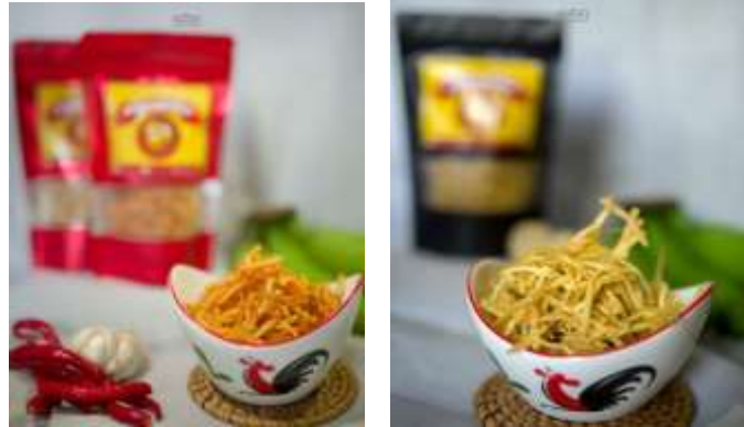
Gambar 1.2 Produk Sebelum Dikemas

varian rasa yaitu original dan pedas. Dipasarkan dengan harga Rp.5.000,- per kemasan/100g.