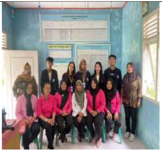
Membantu Kegiatan Posyandu