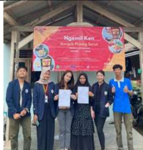
Pemasangan Banner UMKM