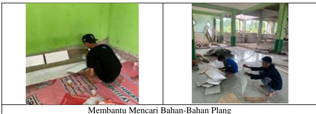
Membantu Mencari Bahan-Bahan Plang