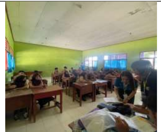
Sosialisasi Di SMPN 2 PESAWARAN