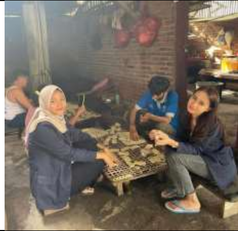
Kunjungan UMKM Kelanting