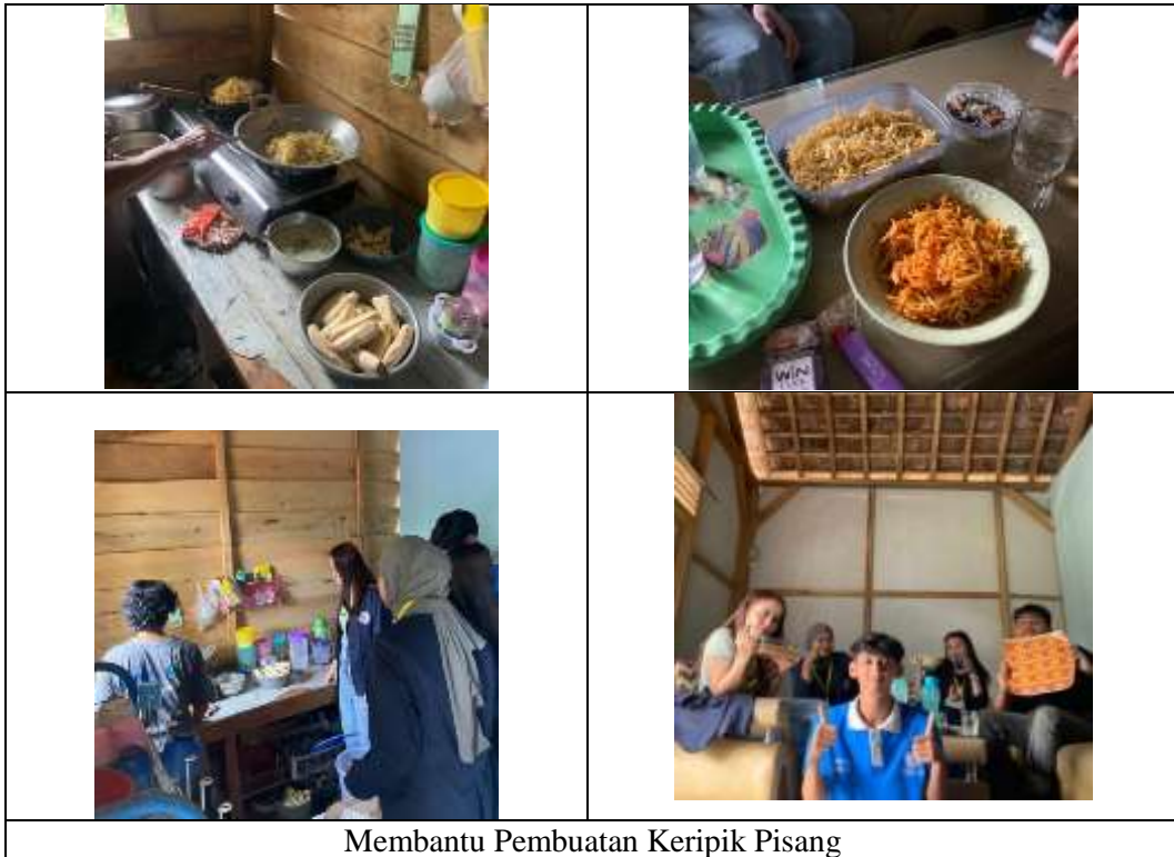
Membantu Pembuatan Keripik Pisang