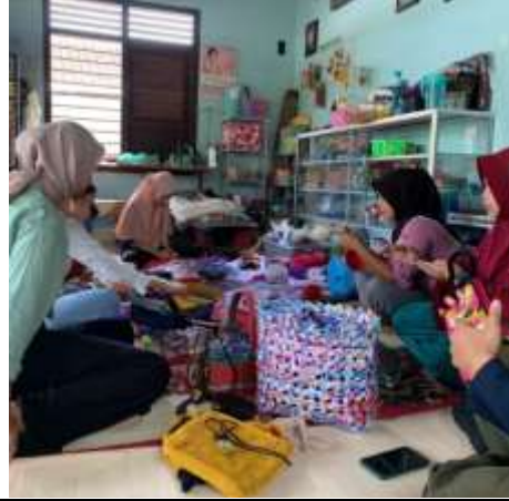
Mengunjungi UMKM Rajut