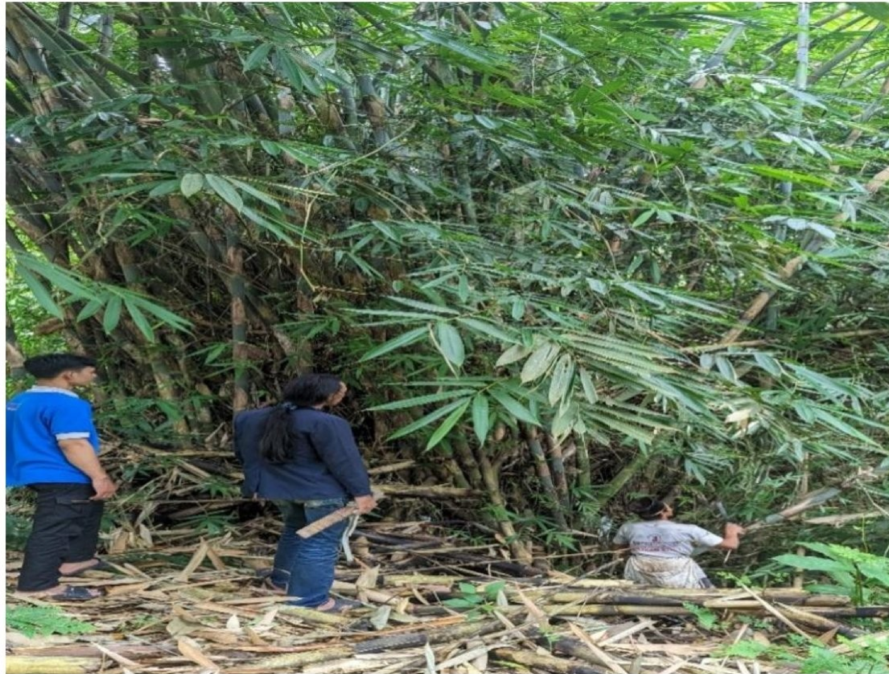
Gambar 2.5 pengambilan bambu untuk membuat kerajinan tangan