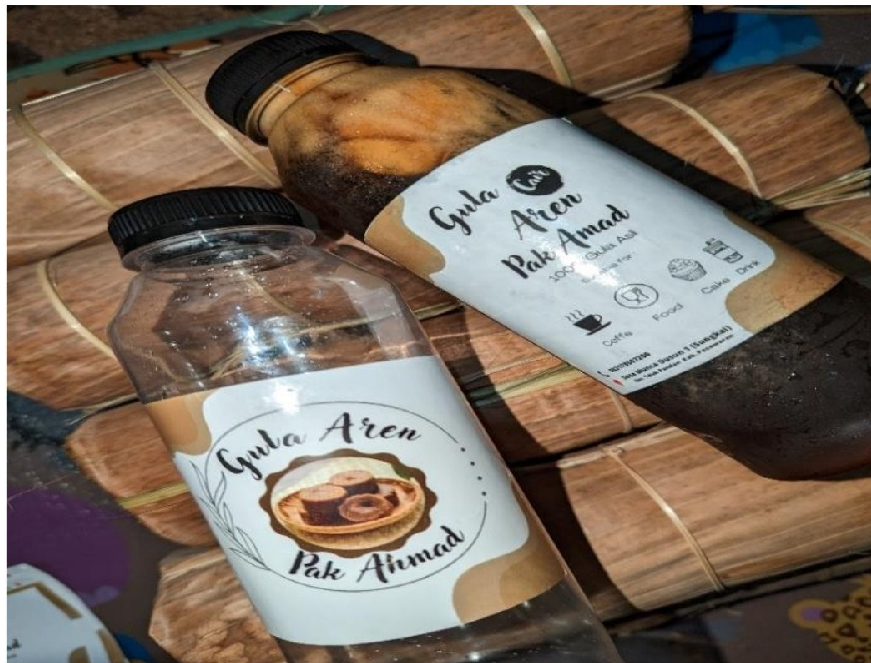
Gambar 2. 8 Proses Pengambilan foto semenarik mungkin