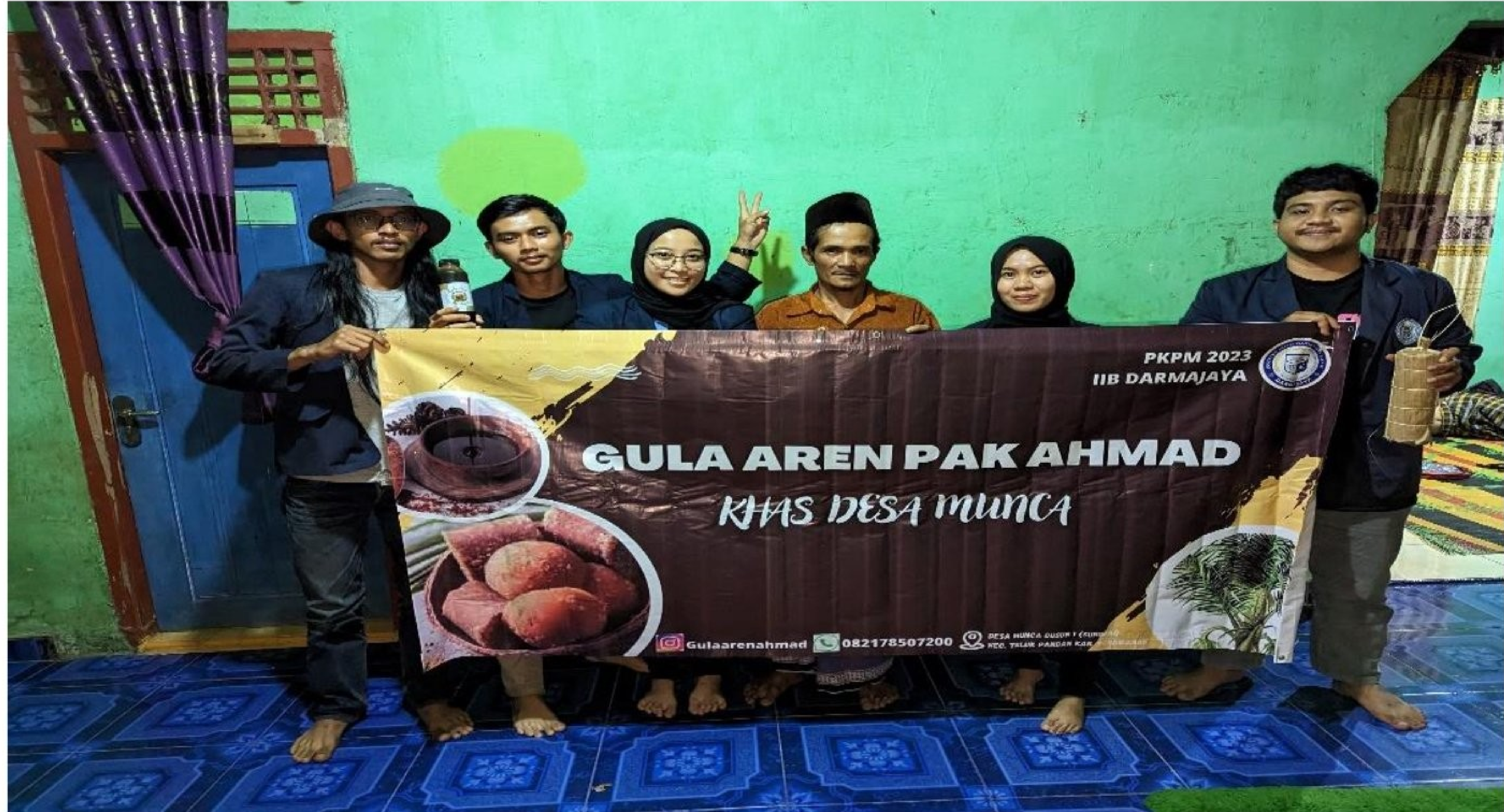
Gambar 2. 3 Observasi Secara Langsung Dengan Pemilik Gula Aren

Kegiatan ini adalah salah satu aktivitas pengamatan produk gula aren secara langsung di lokasi pembuatan gula aren.