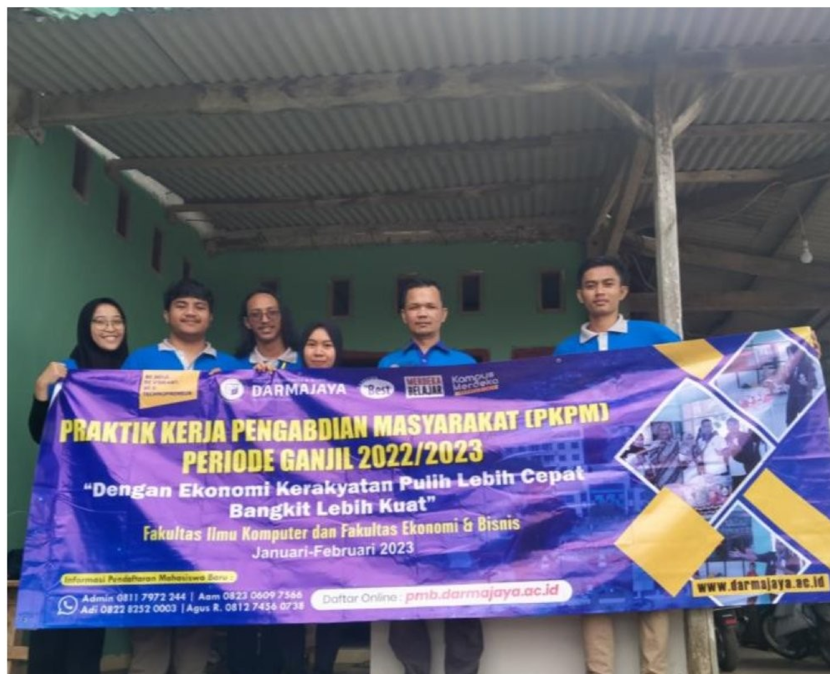
Gambar 2. 2 Pengantaran Peserta PKPM di posko desa Munca 2023