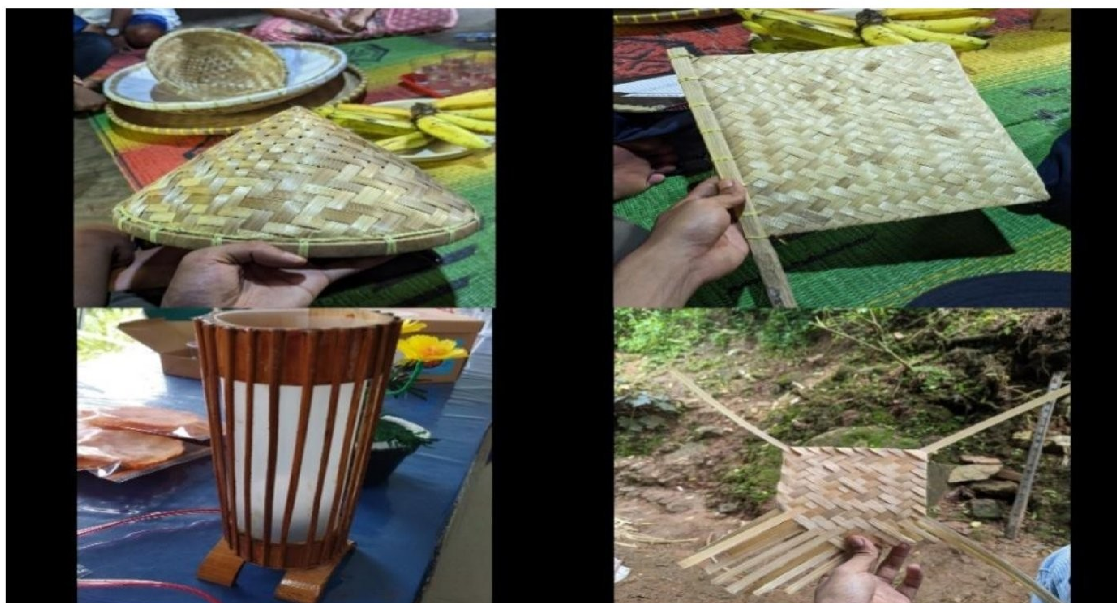
Gambar 2.6 hasil kerajinan tangan