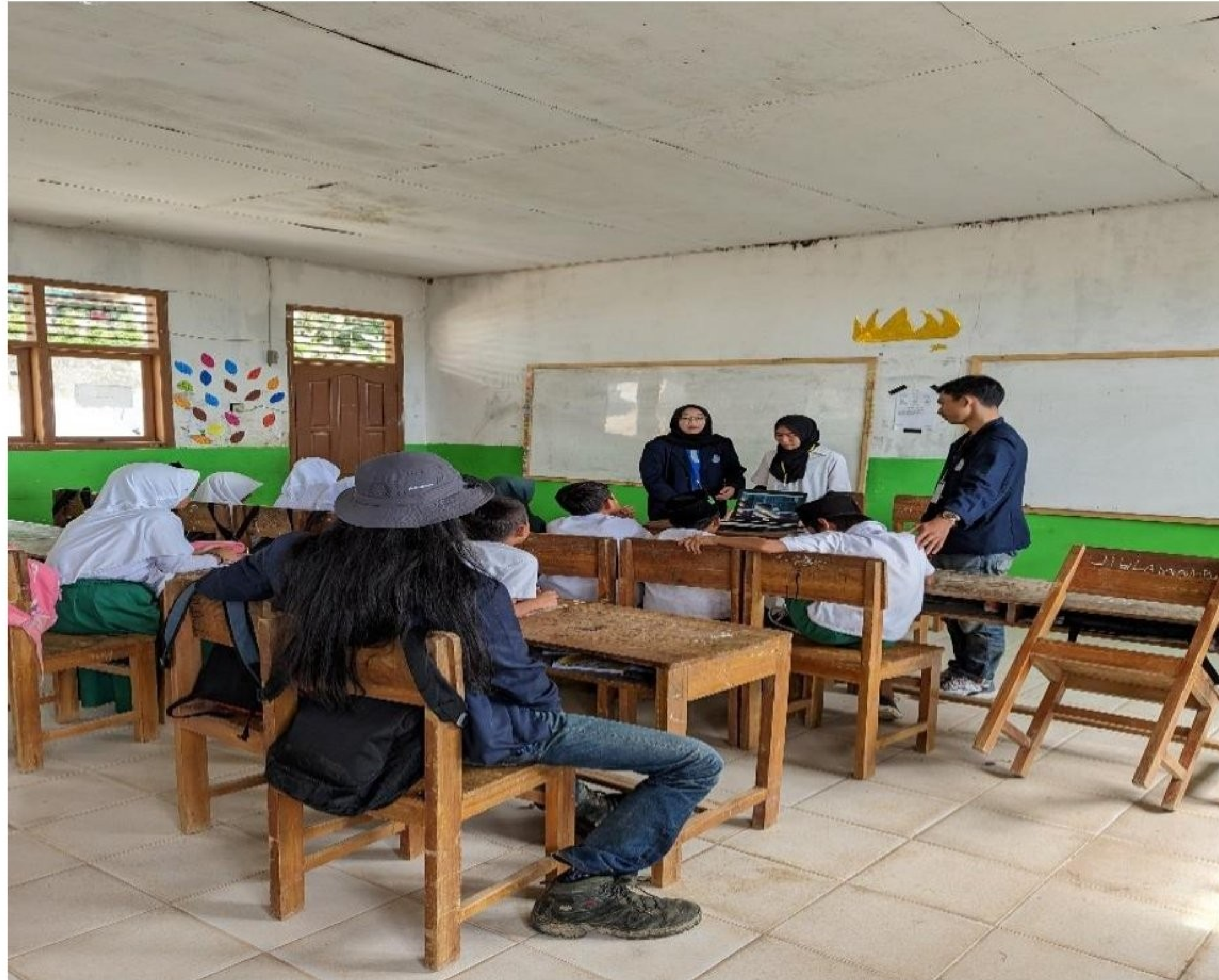
Gambar 2. 9 Kegiatan Sosialisasi

Kegiatan ini bertujuan agar siswa/ilebih mengetahui dampak negative penggunaan gadget di usia dini.