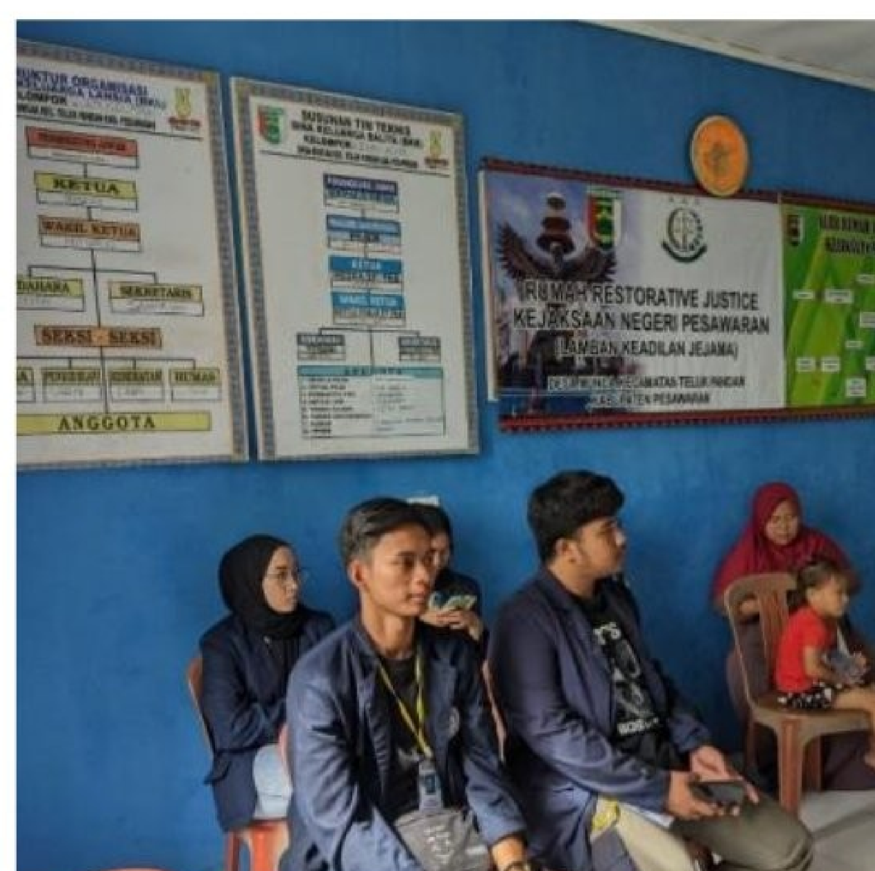
Gambar 2. 8Rapat Pembentukan BUMDES

Pembentukan BUMDES bertujuan untuk mengembangkan rencana kerja dan usaha antar desa atau dengan pihak ketiga, menciptakan peluang dan jaringan pasar yang mendukung kebutuhan layanan umum warga, membuka lapangan kerja, meningkatkan kesejahteraan masyarakat melalui perbaikan pelayanan umum, pertumbuhan dan pemerataan ekonomi desa, dan meningkatkan pendapatan masyarakat desa dan pendapatan asli desa. Untuk itu pendirian BUMDES harus berorientasi pada kepemilikan bersama (pemerintah desa dan masyarakat), tidak hanya memberikan manfaat finansial (pajak, pendapatan asli desa) tetapi juga manfaat ekonomi secara luas (lapangan kerja, ekonomi berkelanjutan, dll).