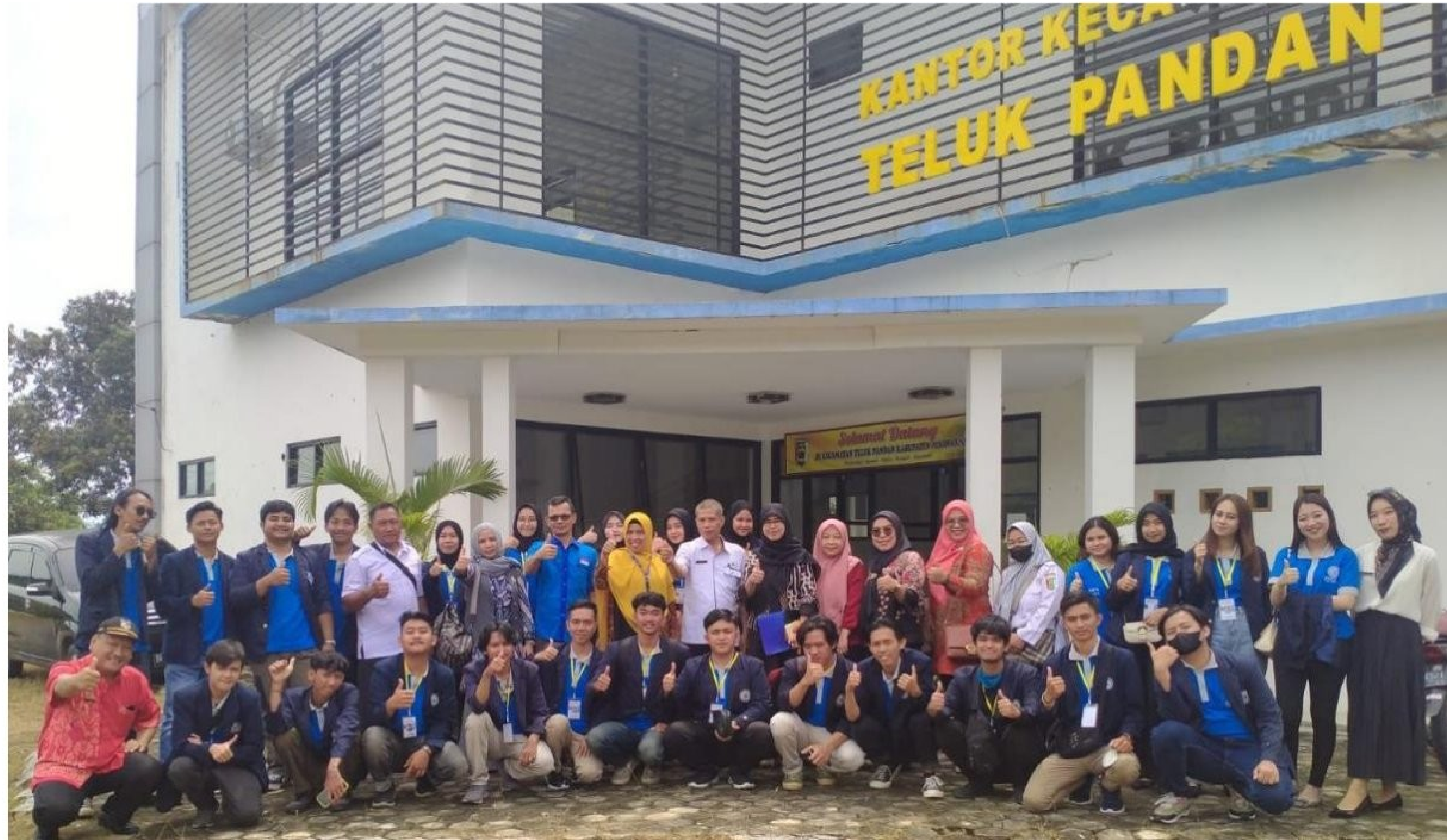
Gambar 2. 1 Pembukaan dan Pelepasan Peserta PKPM 2023 di Kantor kecamatan Teluk Pandan

Kegiatan ini merupakan pembukaan dan pelepasan peserta PKPM 2023 di kantor Kecamatan Teluk Pandan, Kabupaten Pesawaran.