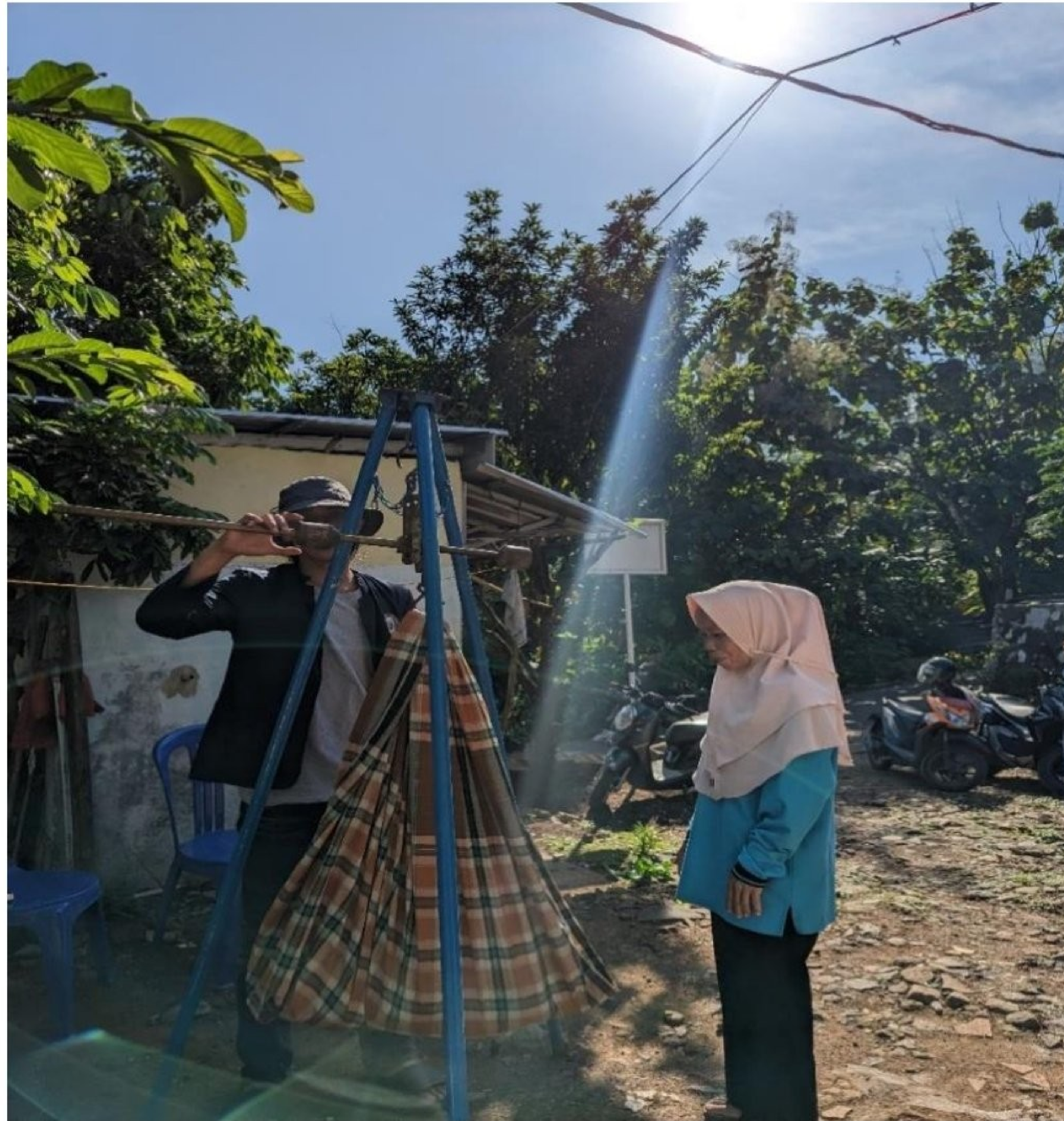
Gambar 2. 10 Melakukan pengecekan berat badan