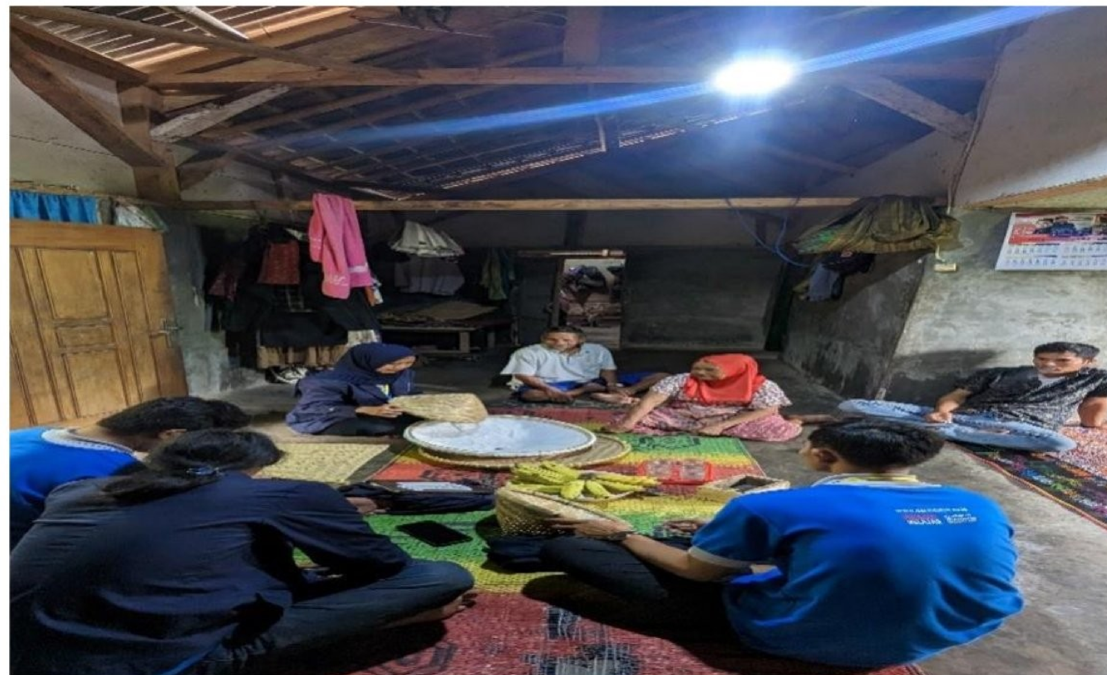
Gambar 2. 4 Membantu membuat kerajinan tangan

Kegiatan ini bertujuan untuk memanfaatkan hasil alam sekitar