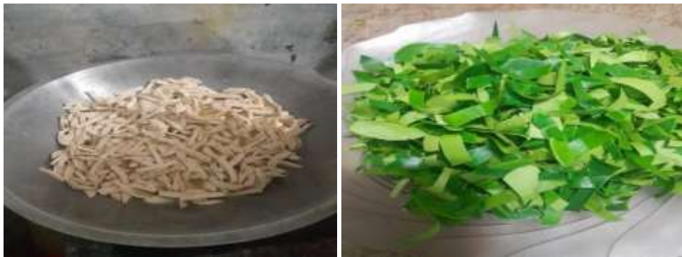
Gambar 2.1 Proses pembuatan Basreng

Pada proses pembuatan Basreng hal pertama yang harus dilakukan adalah memotong semua bakso lalu digoreng hingga kering, ditiriskan. Potong kecil-kecil daun jeruk. Potong kecil-kecil bawang putih dan kencur lalu goreng hingga kering. Setelah itu campur semua bumbu dan bakso yang telah digoreng.