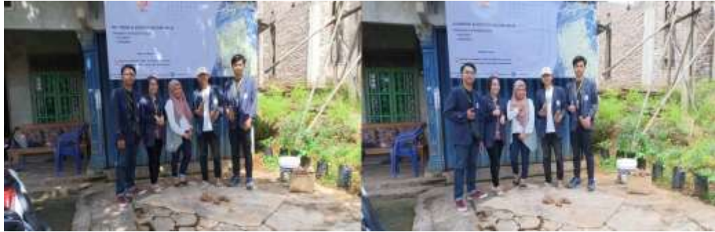
gambar 2.5 Penyerahan Banner ke UMKM Basreng dan Keripik Selo

Pengenalan yang dilakukan ke UMKM pada tanggal 2 Februari 2023 adalah untuk mengetahui bagaimana usaha UPPKA Selo selama berdiri. Selain itu, berdiskusi dengan pemilik usaha apa saja hambatan yang di alami selama menjalankan usaha.