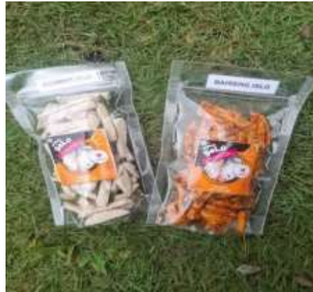
Gambar 2.2 Kemasan Produk

Untuk kemasan produk tidak ada yang kami rubah karena menimbang harga dari kemasan dan harga perproduknya sendiri