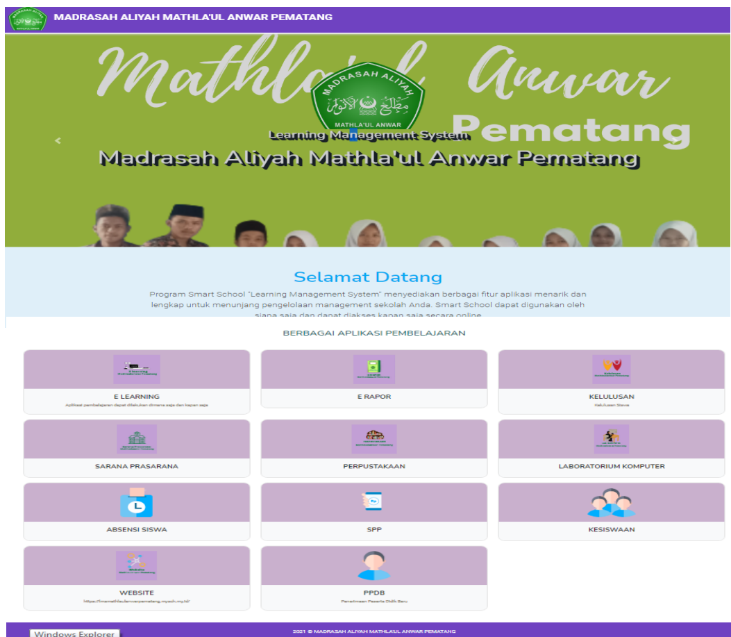
Gambar 4.2.1 : Tampilan Halaman Utama / Beranda

Beberapa bagian pada halaman utama yaitu judul website yang berada pada tab toolbar , nama sekolah dan logo pada header , beberapa informasi tambahan yang berada pada footer.