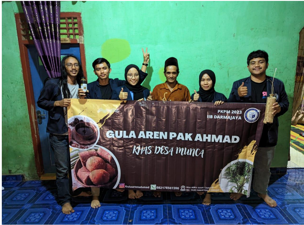
Penyerahan Banner UMKM Gula Aren