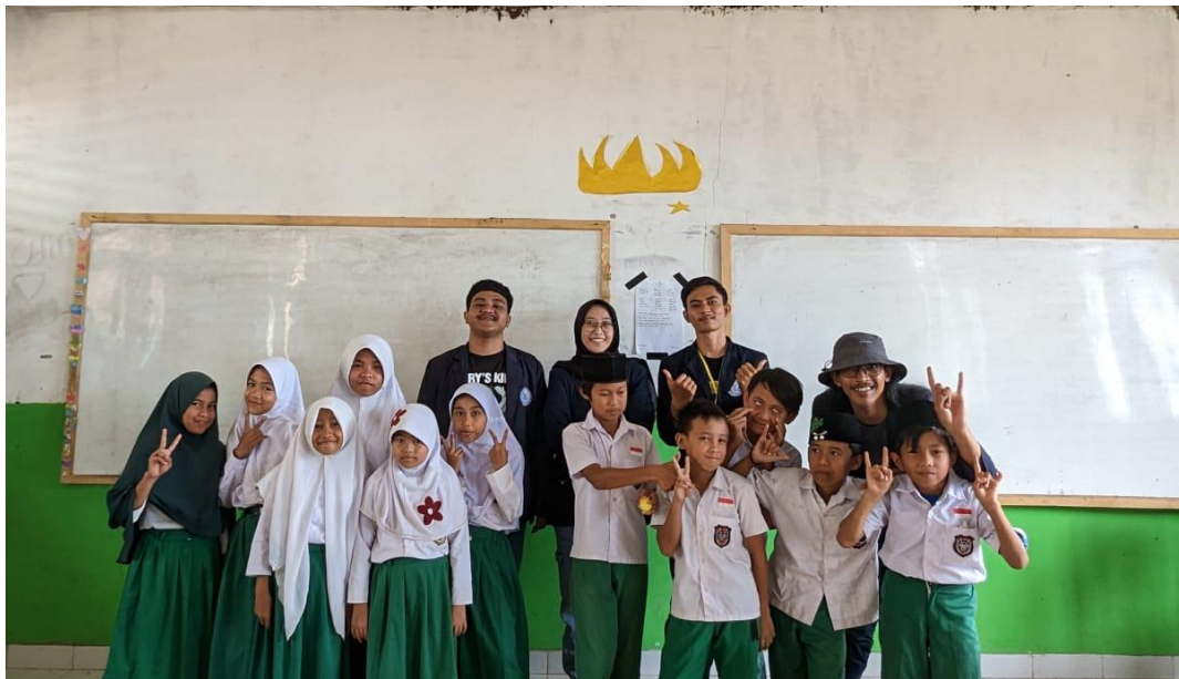
Sosialisasi Bahaya Penggunaan Gadget di MI-AI Falah