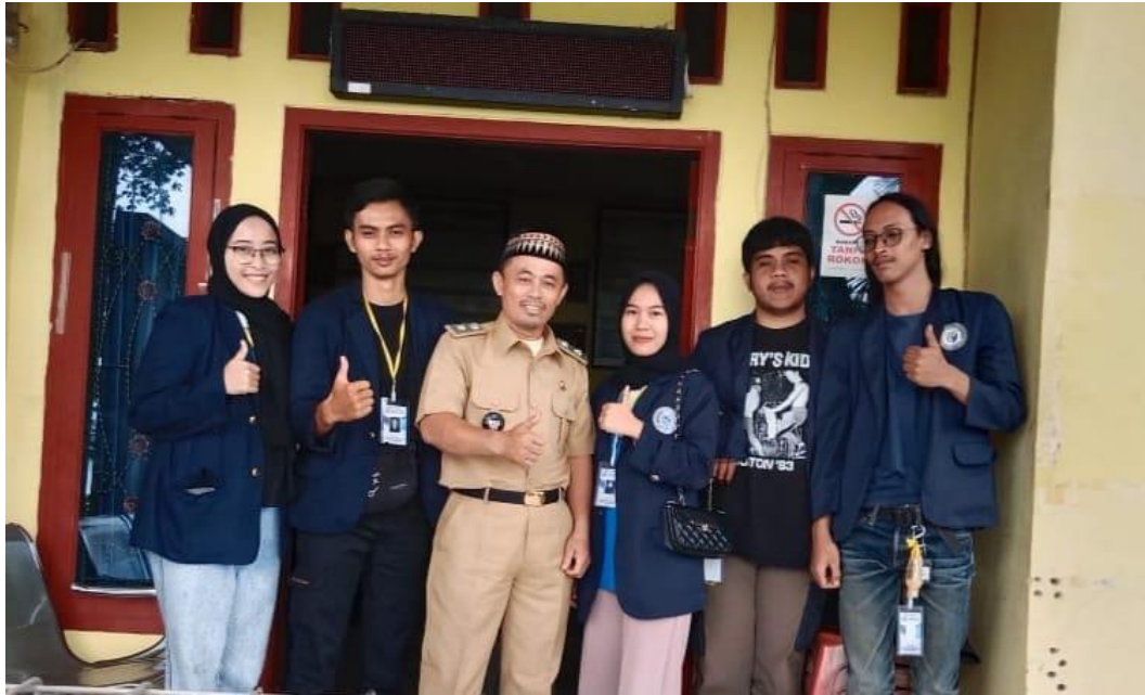
Meminta izin PKPM kepada Kepala Desa Munca