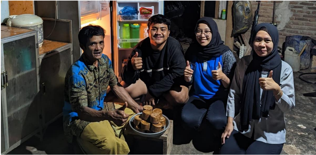
Kunjungan UMKM Gula Aren