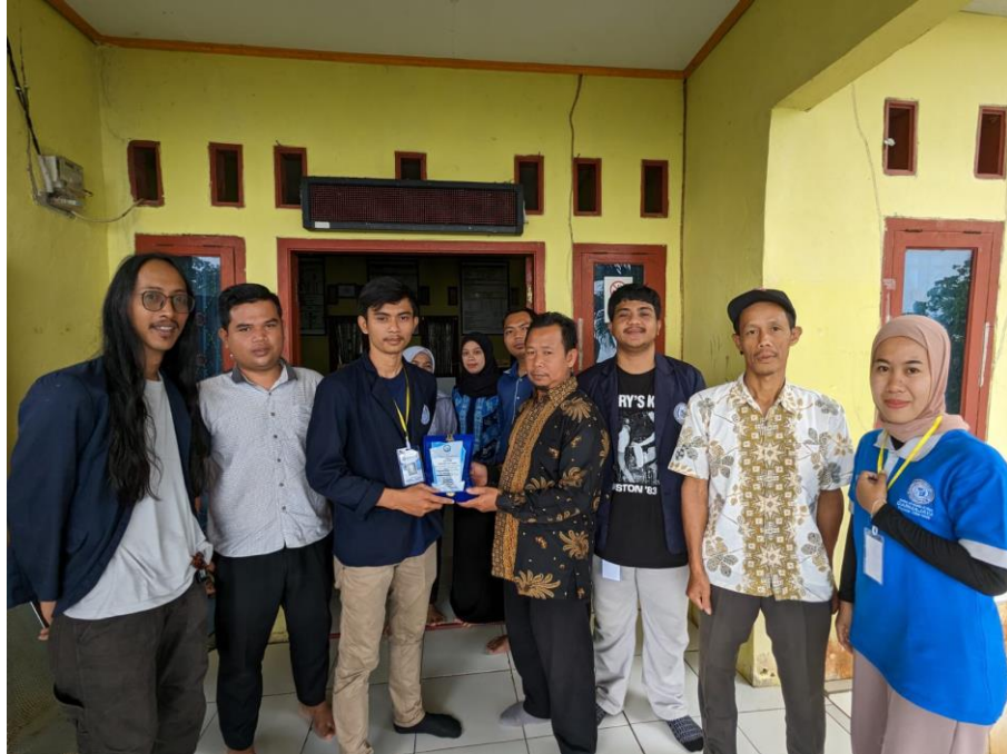
Perpisahan dan Penyerahan Plakat Kepada Aparatur Desa Munca