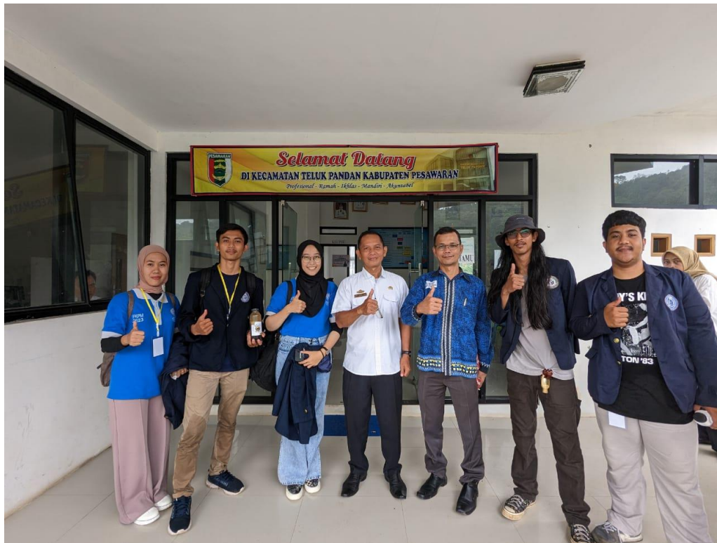
Penjemputan Mahasiswa PKPM di Kecamatan Teluk Pandan