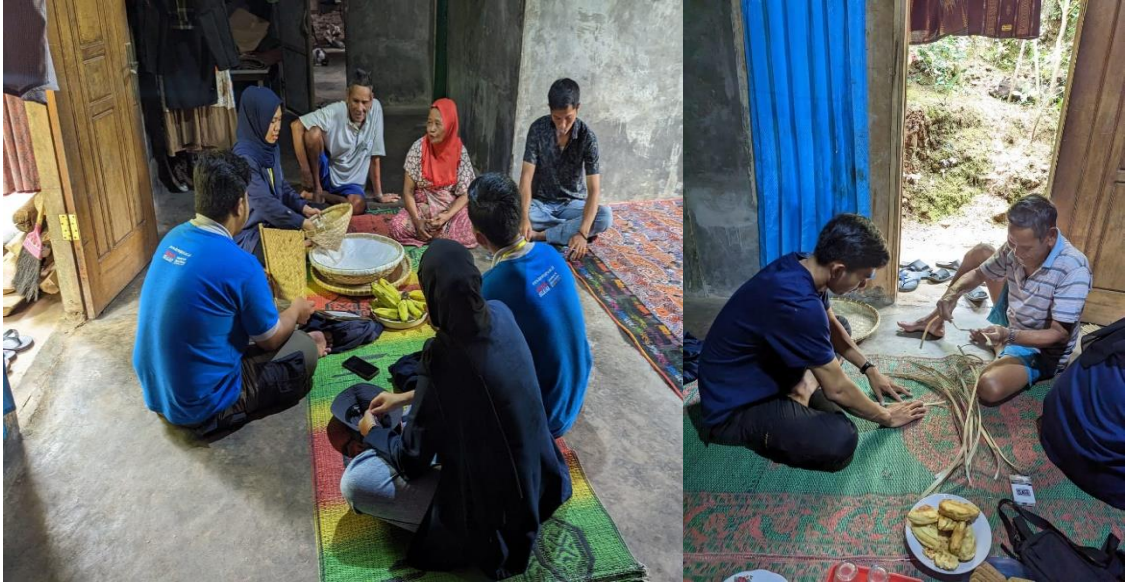
Kunjungan UMKM Kerajinan Tangan