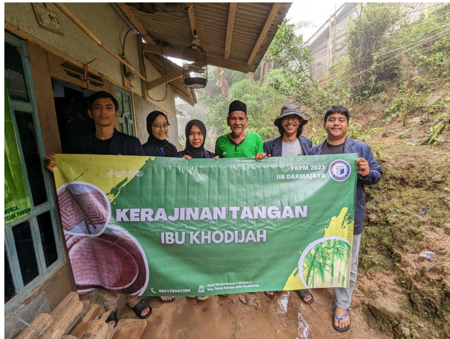
Penyerahan Banner UMKM Kerajinan Tangan