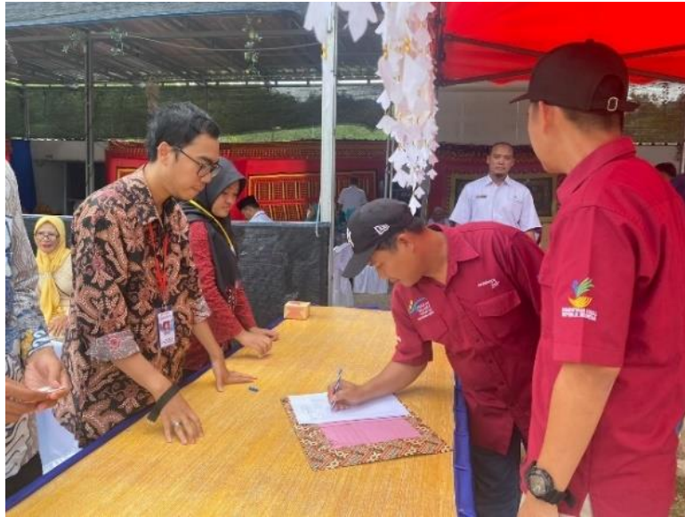
Gambar 7. Acara Kampung KB

Setelah terlaksana acara pelantikan Kepala Desa Sanggi dan Desa Durian, hanya berjarak 2 hari dilaksanakannya Acara Kampung KB.