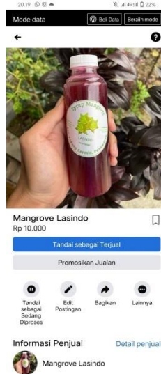
Gambar 3. Facebook UMKM Mangrove Lasindo

Tahap pertama dalam melakukan pembuatan media sosial facebook yaitu dengan dengan melakukan sign up lalu masukan nama bisnis, nama pemilik bisnis dan alamat pemilik bisnis.