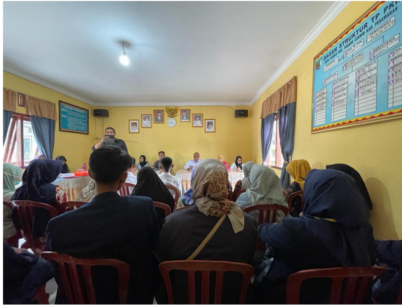
Gambar 5. Musyawarah Pelantikan Kepala Desa

Musyawarah bersama aparat Desa Sanggi mengenai pelantikan Kepala Desa Sanggi dan Durian. Mahasiswa/i ikut andil dalam acara tersebut.