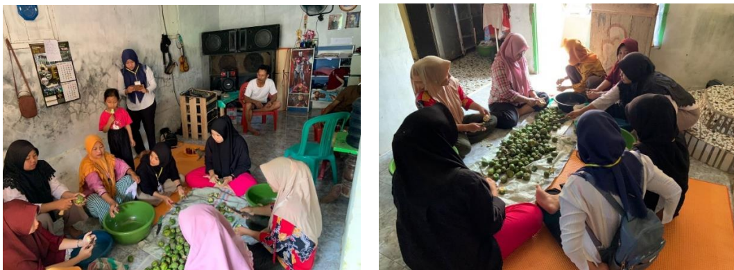
Gambar 6. Survey lokasi dan membantu pengolahan mangrove lasindo

Kunjungan ke UMKM Mangrove Lasindo merupakan kegiatan yang bertujuan untuk mengumpulkan informasi mengenai inovasi dan pemasaran yang akan dilakukan terhadap UMKM tersebut.