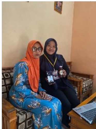
Gambar 4. Foto Bersama dengan pemilik UMKM Mangrove Lasindo

Berikut pelatihan penggunaan E-commerce kepada pemilik UMKM Mangrove Lasindo :