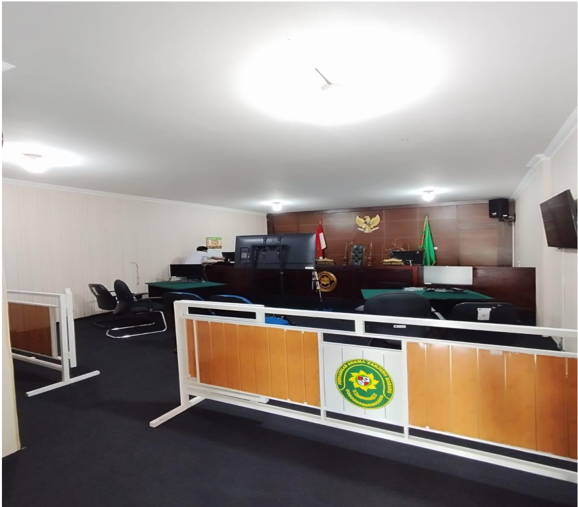
Gambar 5. Ruang Persidangan Pengadilan Agama Tanjung Karang Kelas 1 A.