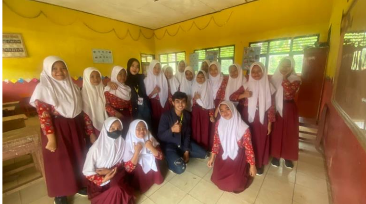
Gambar 2.11 Foto bersama anak kelas 5 SDN 13 Sumber Jaya