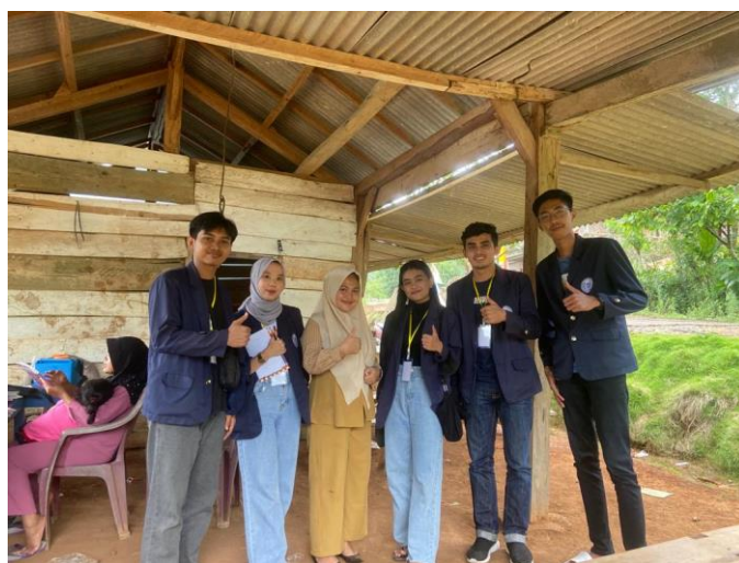
Gambar 2.10 Foto bersama bidan desa di posyandu