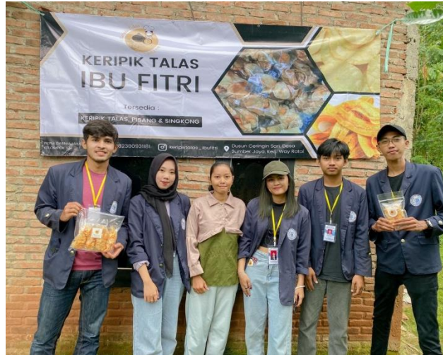
Gambar 2.7 Penyerahan banner kepada pemilik UMKM