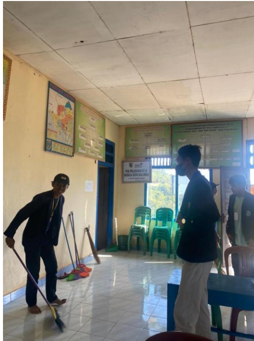
Gambar 2.16 Membantu membersihkan balai desa