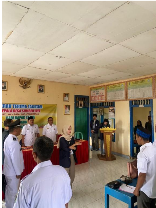
Gambar 2.13 Menjadi panitia dalam acara serah terima jabatan