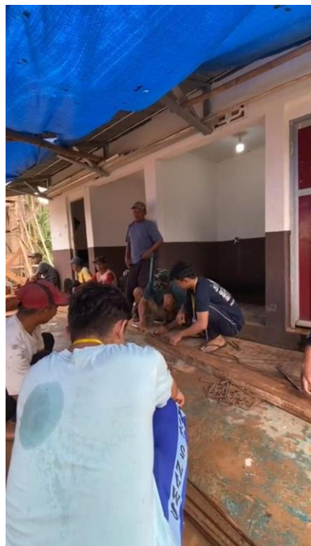
Gambar 2.14 Membantu proses pembuatan rangka bangunan