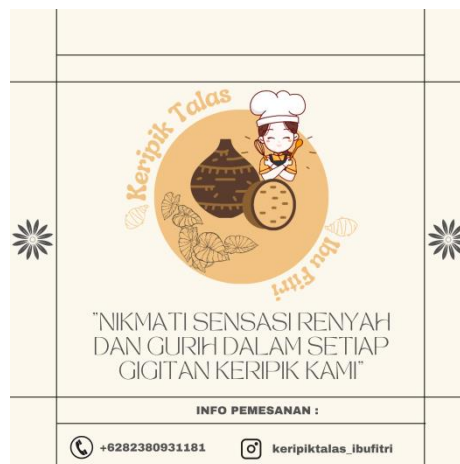
Gambar 2.5 Hasil stiker