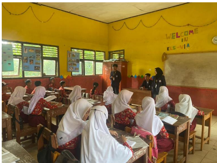
Gambar 2.12 Proses mengajar