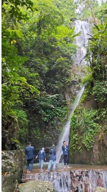
Gambar 2.9 Mengunjungi wisata curug ciupang