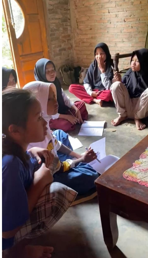
Gambar 2.17 Proses rumah belajar di posko PKPM