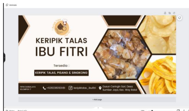
Gambar 2.6 Proses pembuatan banner dengan aplikasi canva