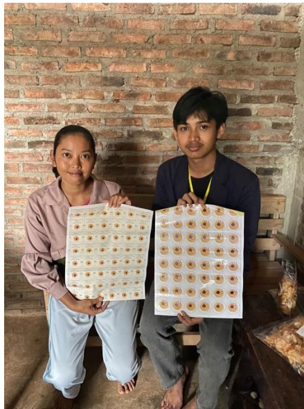
Gambar 2.3 Penyerahan logo dan stiker kepada pemilik UMKM