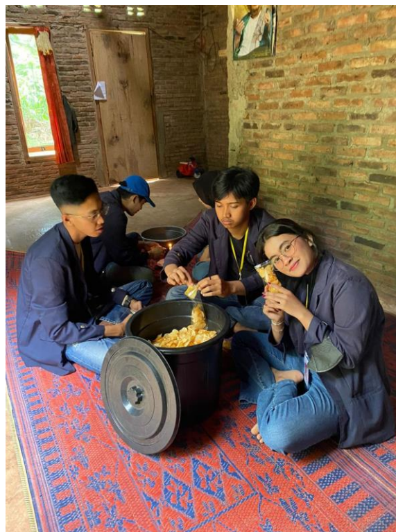
Gambar 2.8 proses pengemasan kripik talas