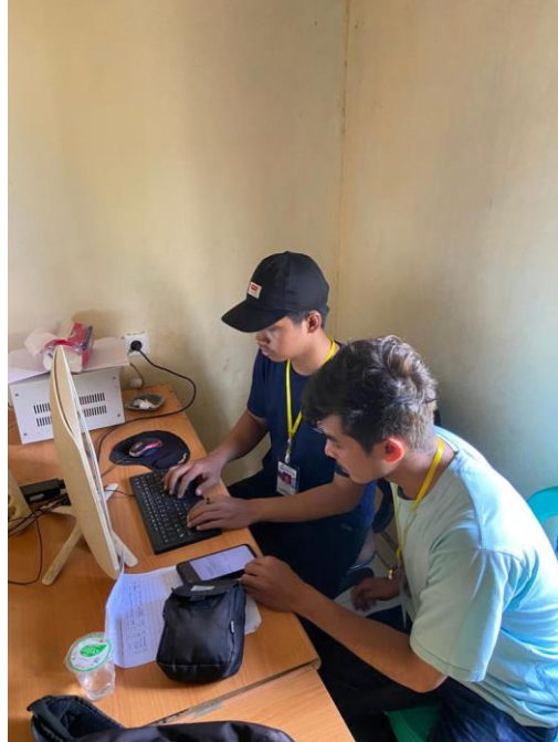
Gambar 2.15 Membuat surat seleksi aparatur desa