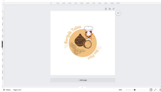
Gambar 2.1 Proses pembuatan logo dengan aplikasi canva