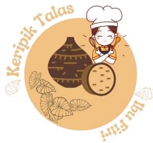
Gambar 2.2 Hasil logo