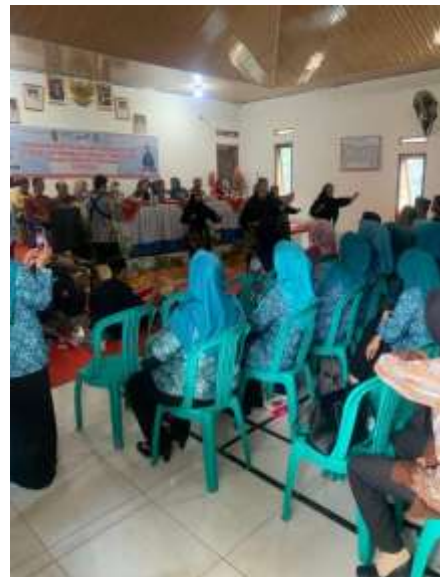
Lampiran 2. Ikut Berpartisipasi dalam penyambutan Bupati di Desa Cilimus