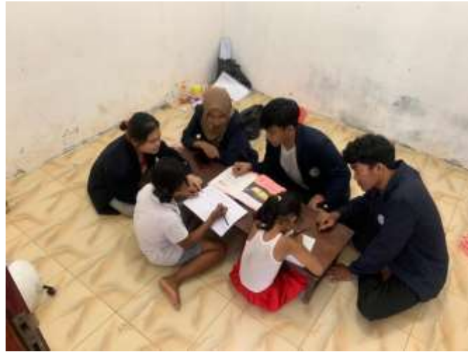
Lampiran 9. Memberikan sarana belajar kepada anak-anak Desa Cilimus