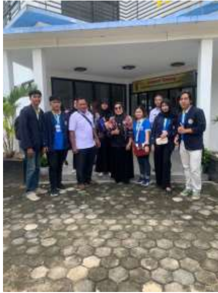
Lampiran 1. Foto bersama DPL saat tiba di lokasi PKPM