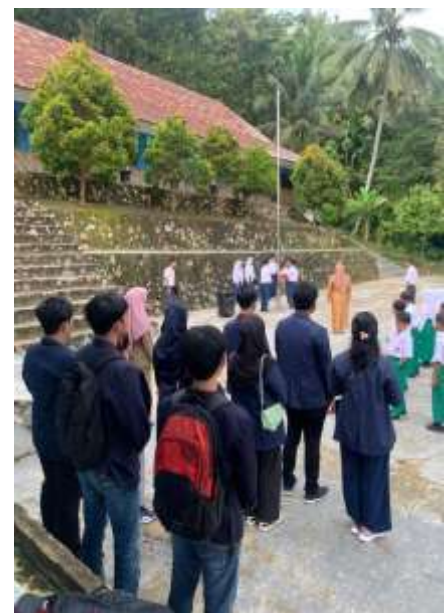
Lampiran 4. Melakukan kunjungan Kesekolah SD/MI Sunan Muria & Mengikuti Upacara di SD/MI Sunan Muria