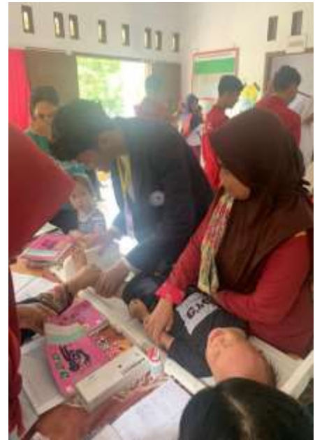
Lampiran 3. Membantu kegiatan Posyandu