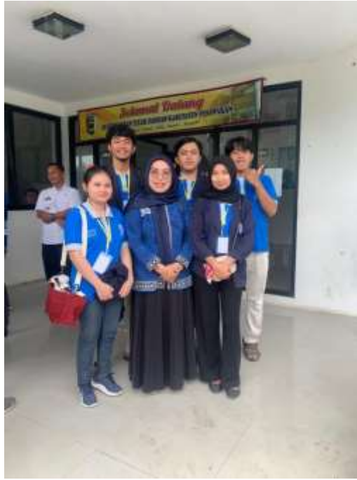
Lampiran 11. Penjemputan PKPM oleh DPL di Kecamatan Teluk Pandan