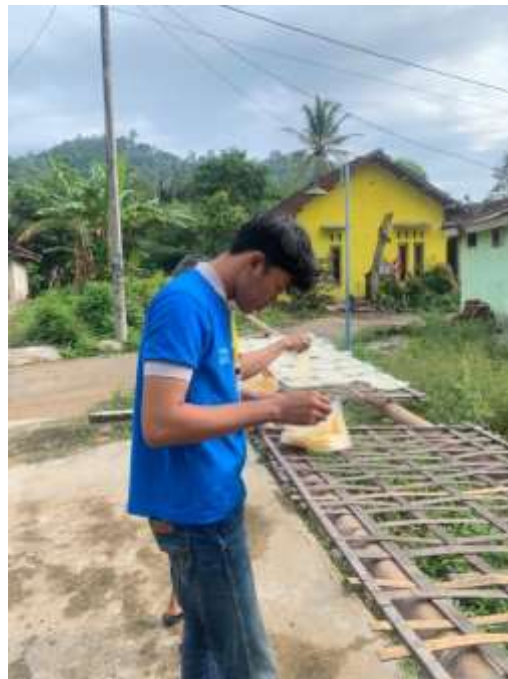
Lampiran 6. Membantu UMKM Opak dalam proses penjemuran Opak