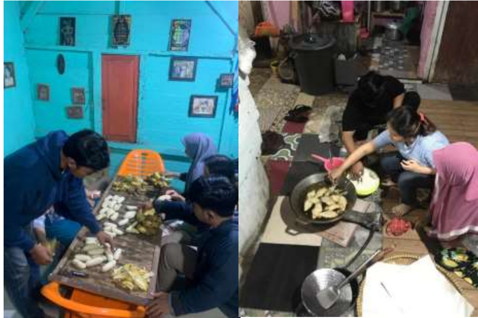
Lampiran 7. Membantu Produksi Pembuatan di UMKM Sale Pisang