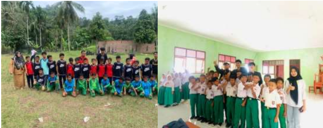
Lampiran 5. Melakukan Pendampingan pertandingan Sepak Bola SD/MI Sunan Muria & Foto bersama Siswa SD/MI Sunan Muria