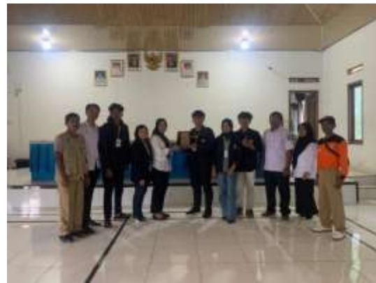
Lampiran 10. Foto Bersama saat perpisahan PKPM & Pemberian Cendera Mata Kepada Ibu Kepala Desa Cilimus