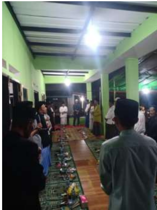
Lampiran 8. Mengikuti acara Isra Miraj di Masjid Desa Cilimus