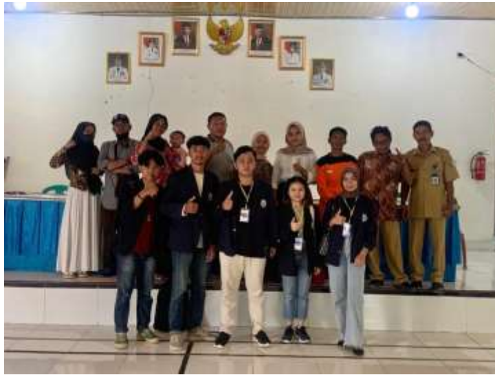
Lampiran 3. Perkenalan dengan Perangkat Desa