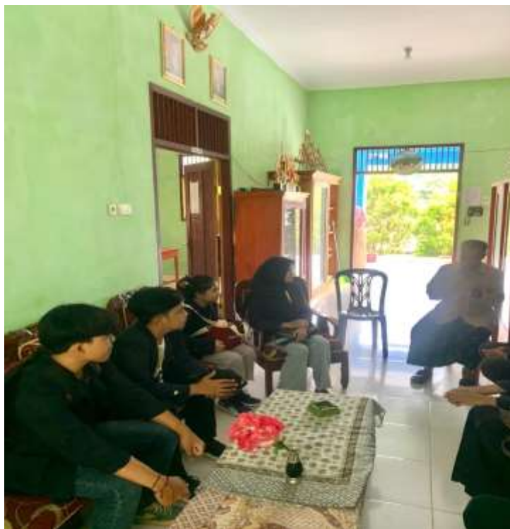
Lampiran 7. Observasi SD/MI Sunan Muria