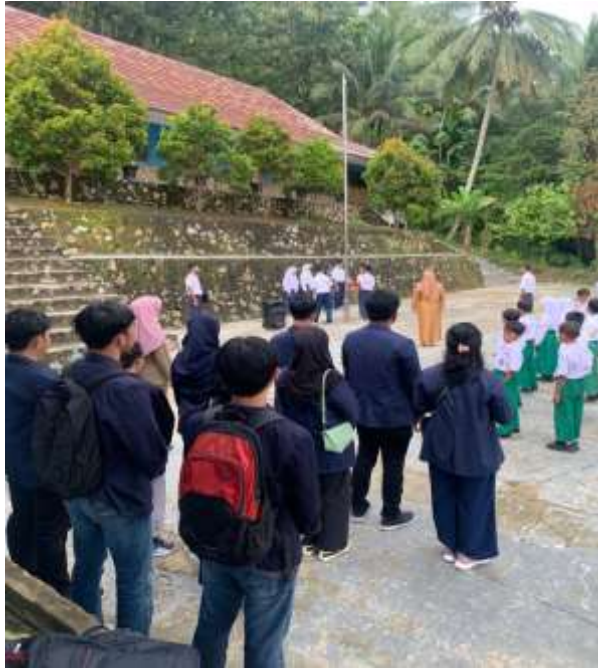
Lampiran 17. Mengikuti kegiatan upacara di SD/MI Sunan Muria