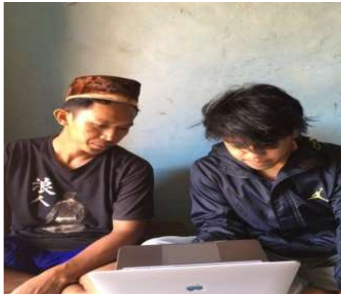
Lampiran 14. Pelatihan desain grafis kepada pemilik UMKM Kerajinan Kayu