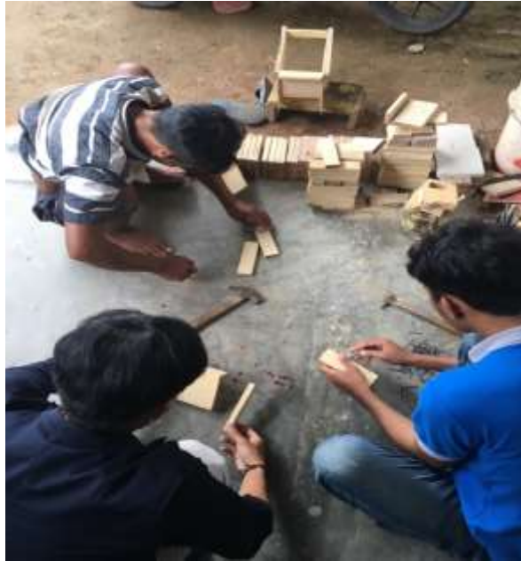
Lampiran 9. Proses perakitan miniatur truk