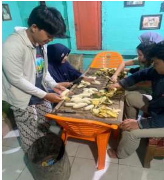
Lampiran 16. Proses Pengirisan pisang di UMKM Sale Pisang