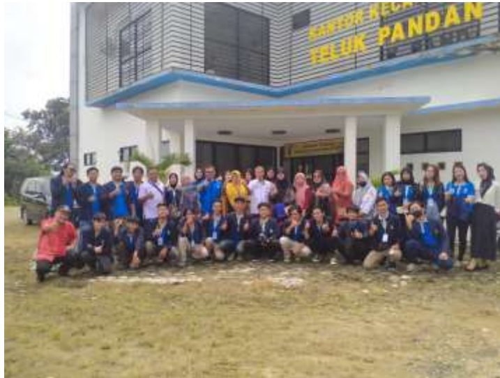
Lampiran 1. Pelepasan Mahasiswa PKPM di Kecamatan Teluk Pandan