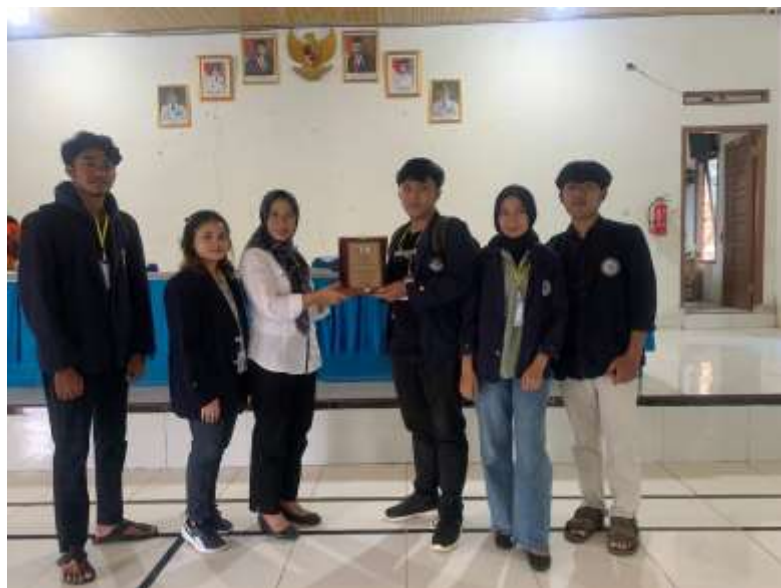
Lampiran 12. Penyerahan cinderamata dari mahasiswa PKPM