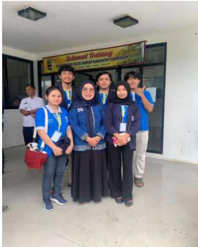
Lampiran 13. Penjemputan mahasiswa PKPM di Kecamatan Teluk Pandan