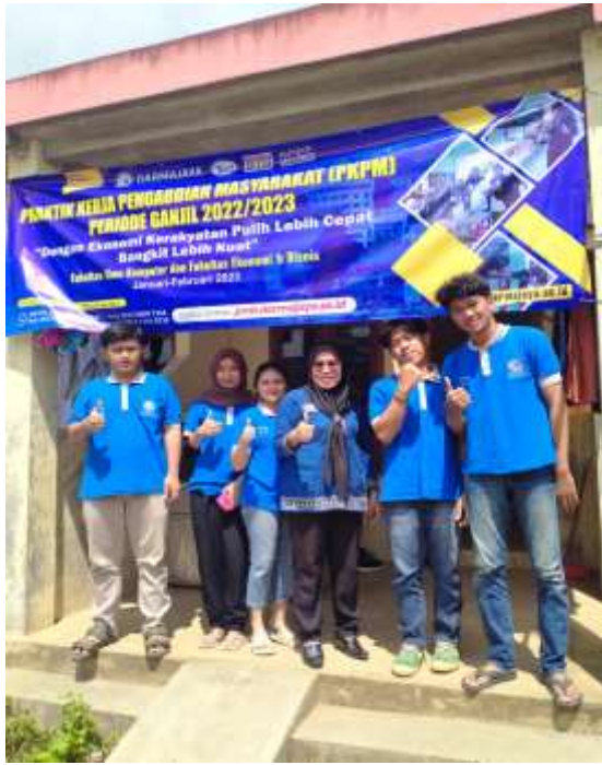
Lampiran 15. Kunjungan DPL ke lokasi PKPM