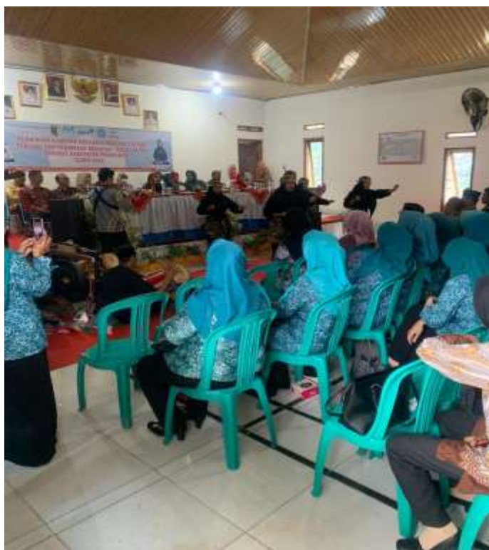
Lampiran 6. Berpartisipasi dalam penyambutan bupati pesawaran di acara BKKBN