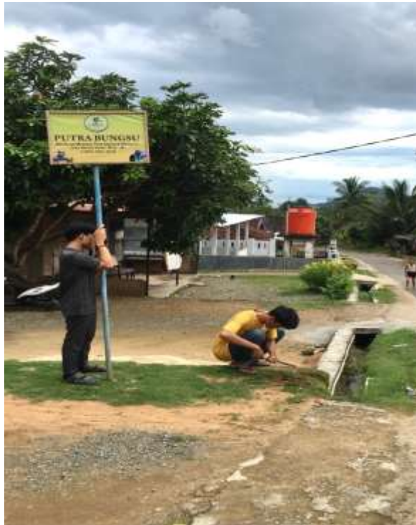
Lampiran 10. Proses pemasangan tiang banner UMKM