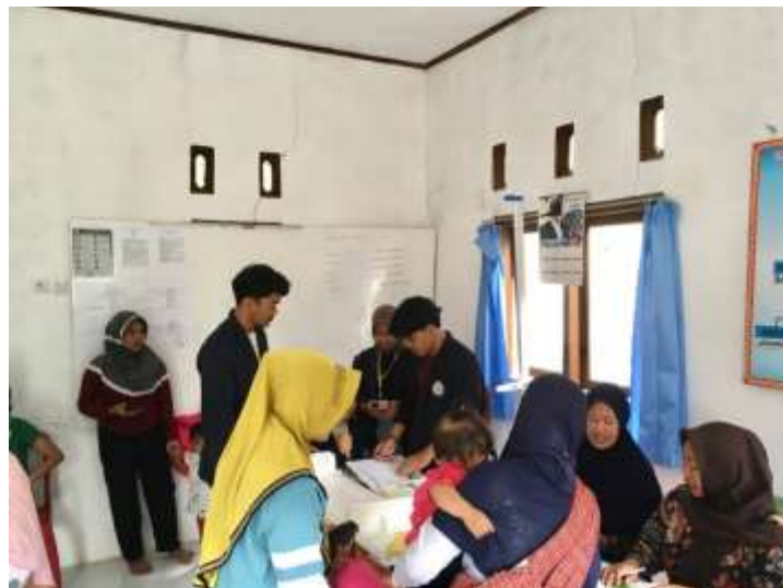
Lampiran 2. Kegiatan di Posyandu