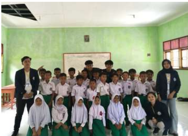
Lampiran 8. Pendampingan Belajar kepada siswa siswi SD/MI Sunan Muria