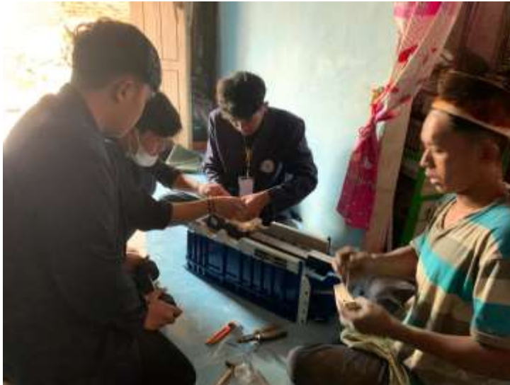
Lampiran 4. Proses finishing miniatur truk