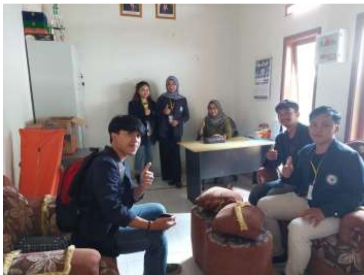
Lampiran 5. Permohonan izin kegiatan PKPM