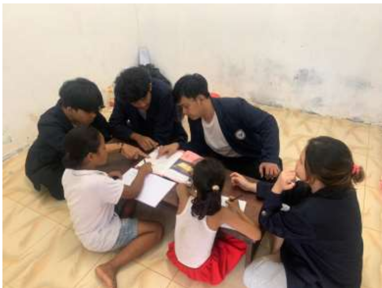
Lampiran 11. Belajar Bersama murid di Posko PKPM