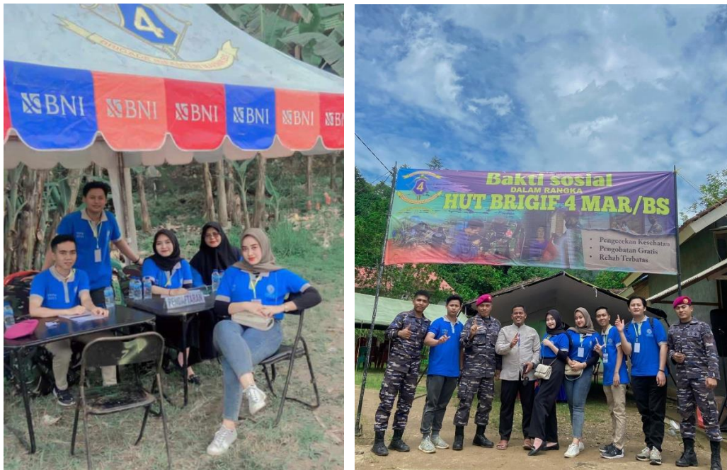
Gambar 2. 4 Kegiatan pengobatan gratis dan cek kesehatan