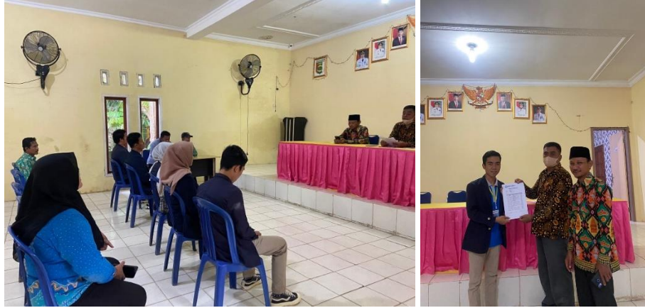
Gambar 2. 12 Penyerahan nilai

Pembagian nilai oleh bapak kepala desa Sidodadi, sekaligus pelepasan mahasiswa PKPM di balai desa.