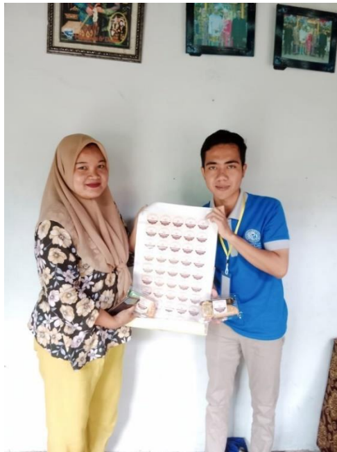
Gambar 2. 10 Penyerahan desain logo UMKM