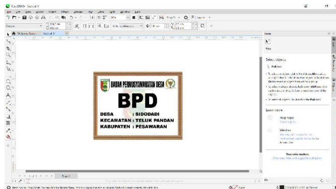
Gambar 2. 9 banner kantor

Pembuatan banner ini untuk memperbarui banner yang sudah rusak.