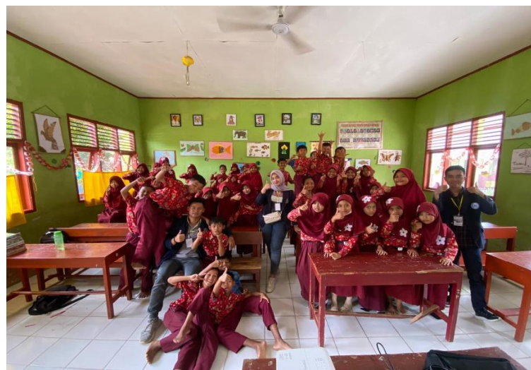
Gambar 2. 3 Kunjungan di SDN 5 Teluk Pandan