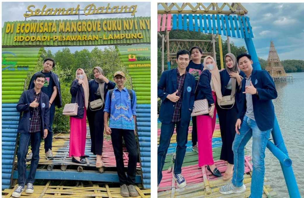
Gambar 2. 11 Foto di ekowisata cuku nyinyi

Tempat wisata di desa Sidodadi sangat banyak salah satunya adalah Ekowisata Cuku NyiNyi, yaitu ekowisata edukasi mangrove