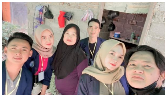
Gambar 2. 2 Mengunjungi UMKM