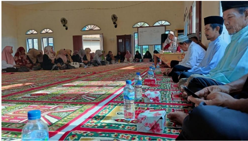
Gambar 2. 6 Menghadiri acara Isra Mi'raj di dusun 3