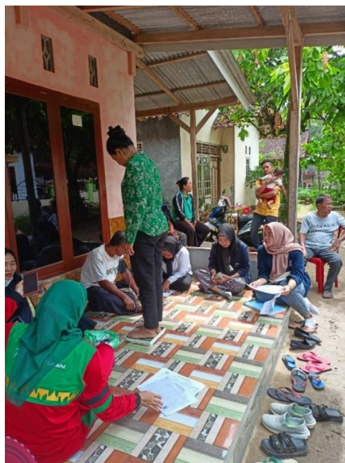
Gambar 2. 5 Pemeriksaan kesehatan pada masyarakat bersama bidan desa