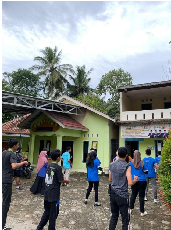
Gambar 2. 7 Senam di balai desa bersama aparaturnya Sidodadi