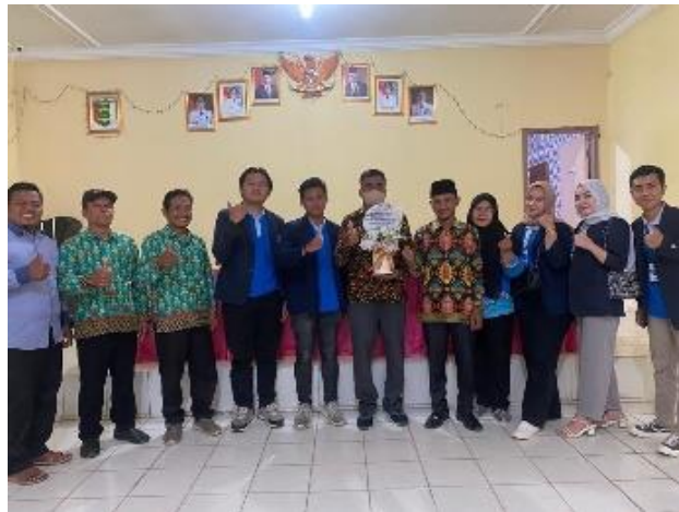
Gambar 2. 100 Penyerahan Cindera mata