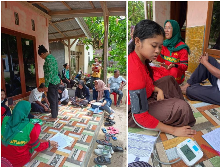
Gambar 2. 5 Pemeriksaan kesehatan pada masyarakat bersama bidan desa