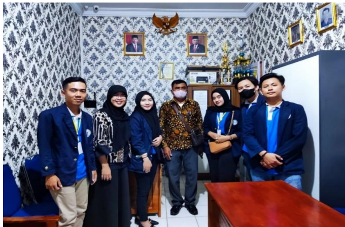
Gambar 2. 1 Penerimaan Peserta PKPM

Permohonan izin kepada Bapak Tunggal selaku kepala Desa Sidodadi dengan tujuan untuk melaksanakan kegiatan PKPM di Desa Sidodadi selama kurun waktu 1 bulan dari tanggal 01 february 2023 sampai dengan 02 maret 2023.