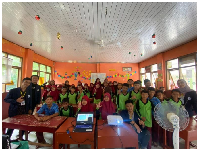
Gambar 2. 3 Kunjungan di SDN 5 Teluk Pandan