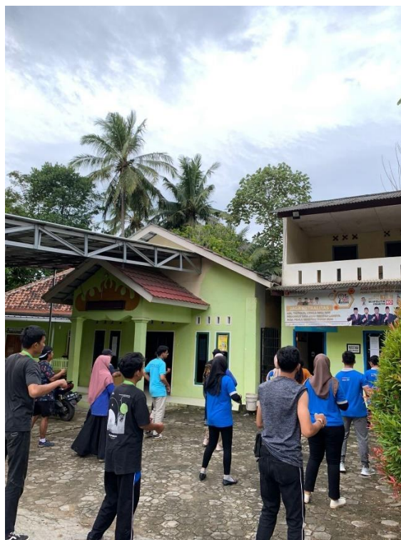
Gambar 2. 7 Senam di balai desa bersama aparaturnya desa Sidodadi