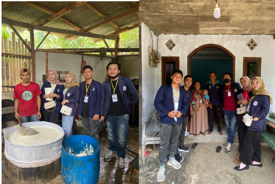
Gambar 2. 2 Mengunjungi UMKM