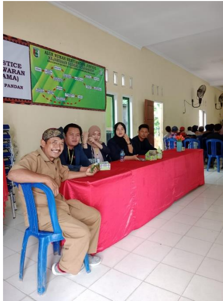
Gambar 2. 6 Menghadiri sosialisasi dari kementerian sosial