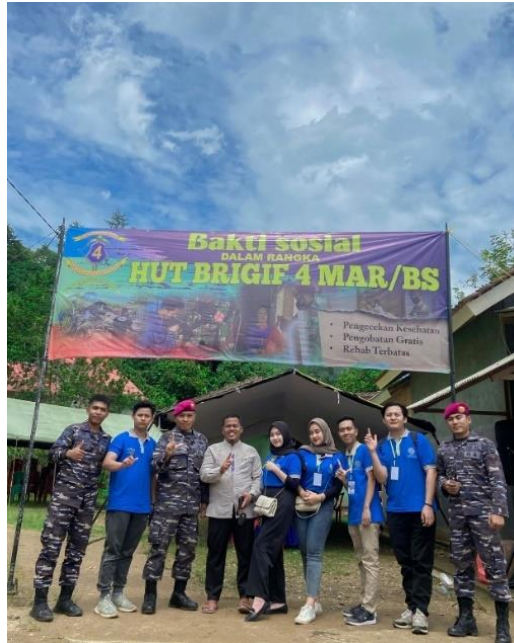
Gambar 2. 4 Kegiatan pengobatan gratis dan cek kesehatan