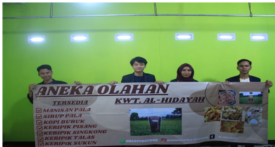
Gambar 1.3 Profil UMKM

UMKM Al-Hidayah ialah UMKM yang dinaungi oleh Kelompok Wanita Tani (KWT) desa pesawaran indah yang berdiri sejak tahun 2004 lalu ini tengah mengembangkan usaha olahan buah pala yaitu manisan pala dan minuman sari buah pala . UMKM AL-Hidayah yang berlokasi di Dusun Kaliguha, Desa Pesawaran Indah, Kecamatan Way Ratai , Kabupaten Pesawaran ini sudah mulai mengembangkan usaha sirup pala dan manisan pala sejak tahun 2021. Dalam hal tersebut kelompok wanita tani Desa Kaliguha bergerak mengembangkan olahan buah pala dengan berbagai macam jenis olahan daging buah pala menjadi manisan pala dan sirup pala yang memiliki banyak manfaat bagi kesehatan.