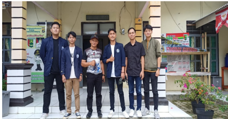
Gambar 1.1 Profil Desa

Desa Pesawaran Indah merupakan desa yang terletak di Kecamatan Way Ratai, Kabupaten Pesawaran, Provinsi Lampung. Adapun profil balai desa ada pada Gambar 1.1.