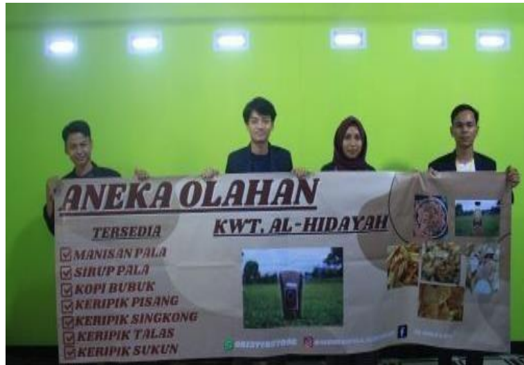
Gambar 1.3 Profil UMKM