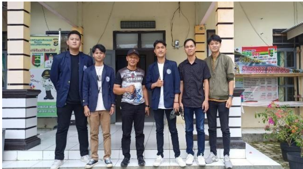
Gambar 1.1 Profil Desa

Desa pesawaran Indah merupakan desa yang terletak di kecamatan Way Ratai,Kabupaten Pesawaran, provinsi lampung. Adapun profil desa ada pada Gambar 1.