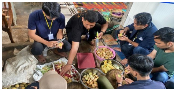
Gambar 2.4 Proses Produksi

Proses produksi adalah cara, metode, serta teknik untuk menciptakan, mengolah, atau memberi nilai tambah bagi suatu barang atau jasa dengan menggunakan sumber-sumber daya (tenaga kerja, bahan-bahan, dana) yang ada. Dalam kegiatan ini proses produksi yang masih dilakukan secara tradisional yaitu mulai dari pembersihan, pemotongan, penjemuran bahan-bahan dan penggorengan serta pengemasan produk yang dibantu oleh anggota KWT (Kelompok Wanita Tani).