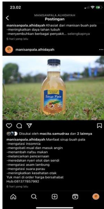
Gambar2.6 Penjualan Online

Membantu Mempromosikan hasil produk UMKM dengan mengunggah foto produksi dengan memberi caption yang menarik di berbagai media sosial guna meningkatkan jaringan pemasaran yang lebih luas.