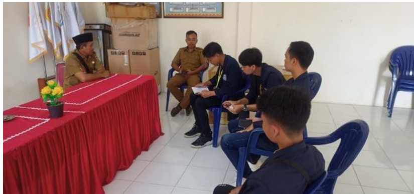
Gambar 2.1 Koordinasi

Berkoordinasi terkait progja dan kegiatan yang dilakukan selama 1 bulan PKPM di Desa Pesawaran Indah ditunjukkan pada gambar berikut: