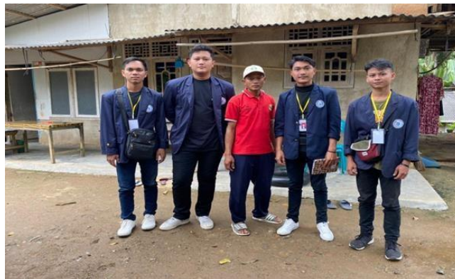
Gambar 2.2 Foto bersama Kepala Dusun