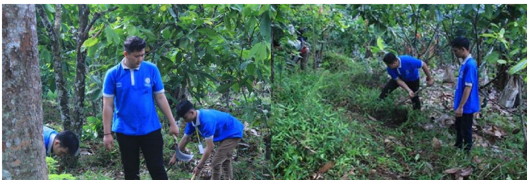
Gambar 2.7 Kegiatan Gotong Royong

Mengikuti kegiatan gotong royong bersama masyarakat Dusun Wonorejo 1 yang di tunjukan oleh Gambar 2.7 berikut: