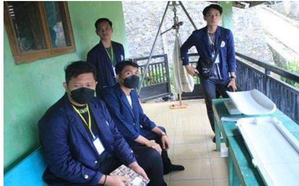
Gambar 2.8 Kegiatan Posyandu

Mengikuti kegiatan posyandu dan pembagian vitamin serta obat cacing ada pada Gambar 2.8 berikut: