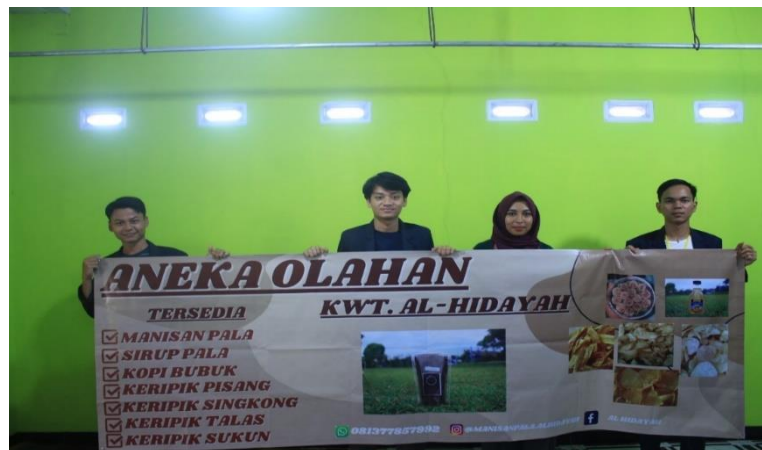
Gambar 3. Profil UMKM