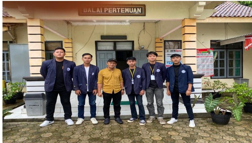
Gambar 1. Profil Desa

Desa Pesawaran Indah merupakan desa yang terletak di Kecamatan Way Ratai, Kabupaten Pesawaran, Provinsi Lampung. Adapun profil balai desa ada pada Gambar 1.