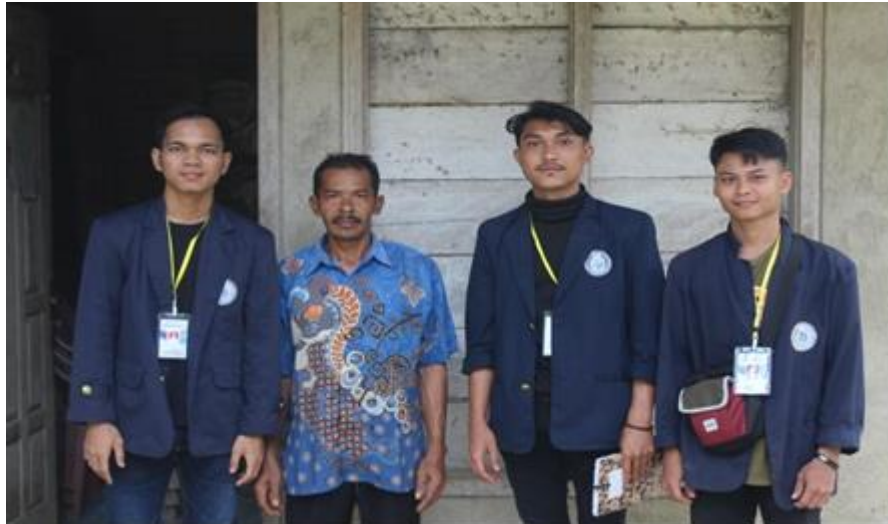
Gambar 5. Foto Bersama Bapak Kepala Dusun 2 Wonorejo 1