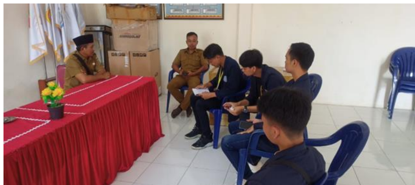
Gambar 4. Dokumentasi Koordinasi