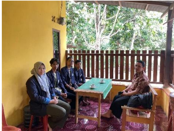
Kunjungan Dosen Pembimbing Lapangan Ke Posko Mahasiswa PKPM