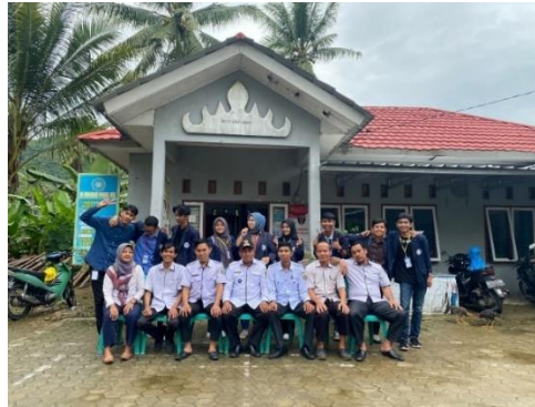
Foto Bersama Dengan Aparatur Dan Izin Undur Diri Dari Desa Sanggi