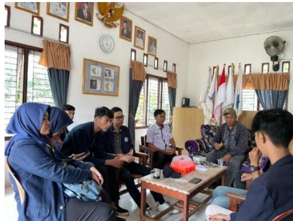
Penerimaan Mahasiswa PKPM di Balai Desa Sanggi