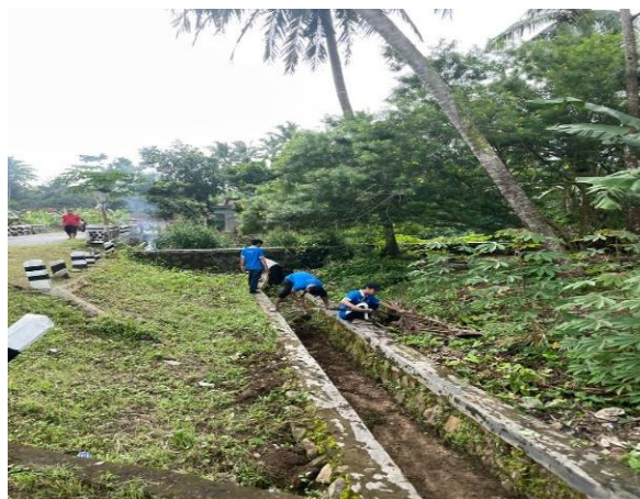
Gotong Royong Membersihkan Balai Desa dan Pinggiran Jalan Desa Sanggi