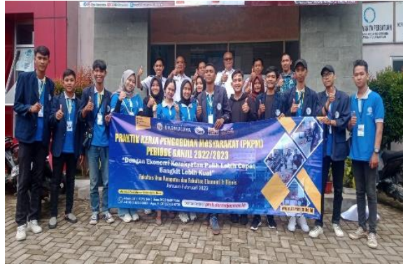
Penerimaan Mahasiswa PKPM di Kecamatan Padang Cermin