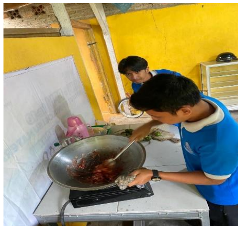
Ikut membantu Megikuti proses pembuatan dodol mangrove lasindo