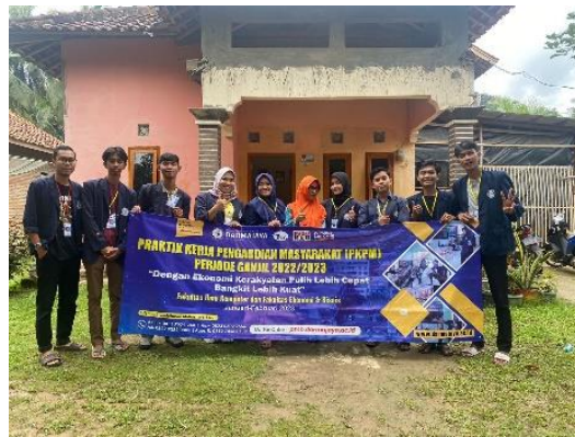
Kunjungan Ketempat UMKM Mangrove Lasindao Desa Sanggi