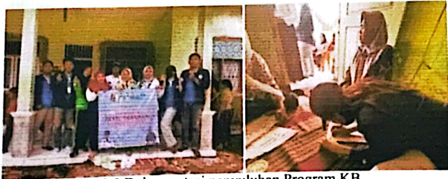
Gambar 2.9 Dokumentasi penyuluhan Program KB

2.3.8 Kunjungan dan Memberikan Inovasi Produk ke Ibu-Ibu PKK Melaksanakan Kegiatan Inovasi Buah kelapa yakni Coconut Jelly serta Eskrim Santan yang bertujuan agar dapat dimanfaatkan oleh masyarakat pulau pahawang sebagai inovasi produk umkm yang baru.