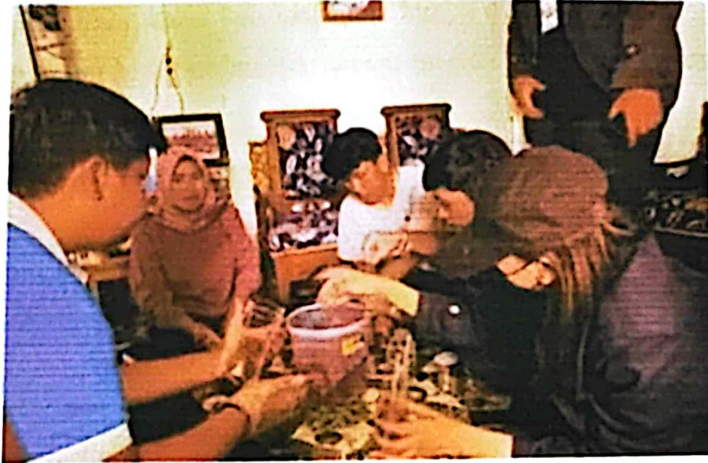
Gambar 2.6 Membantu Pengemasan Produk UMKM

2.3.5 Mengunjungi Dan Ikut Serta Dalam Praktik Packing Emping Jengkol Melakukan kunjungan terhadap UMKM Desa Pulau Pahawang yaitu Roti Gabin Tape dan Emping Jengkol yang bertujuan untuk memberikan inovasi pengemasan secara vacum agar produk lebih tahan lama dan juga memberikan saran logo baru untuk produk UMKM tersebut.