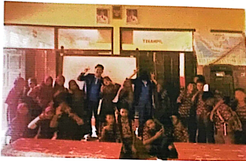
Gambar 2.4 Dokumentasi bersama Siswa/I

Kegiatan program pembelajaran digital yang dilaksanakan pada tanggal 15 sampai tanggal 16 Februari di SDN 8 Marga Punduh.