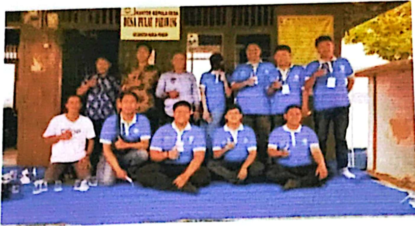
Gambar 2.2 Foto Bersama Aparatur Desa Dibalai Desa Pulau Pahawang