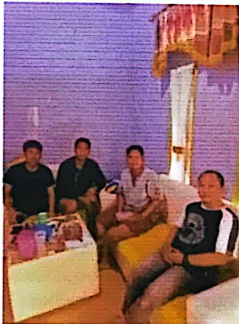
Gambar 2.5 Foto Kunjungan DPL

Dosen pembimbing lapangan melakukan kunjungan pada tanggal 19 februari 2023 guna memantau perkembangan kelompok kami.