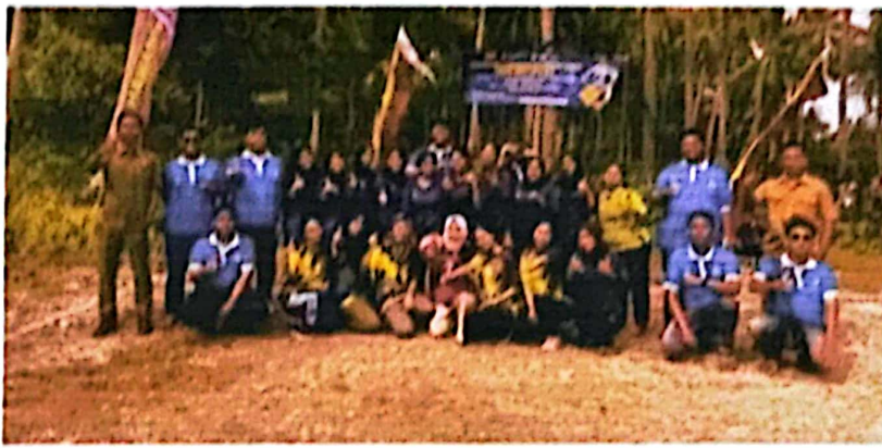
Gambar 2.8 Foto bersama peserta lomba & Aparatur Desa

Mengadakan kegiatan perlombaan Bola Volly antar dusun di Desa Pulau Pahawang, yang bertujuan agar masyarakat aktif dalam bidang olahraga, menjalin silaturahmi, dan juga dengan adanya perlombaan ini kegiatan PKPM yang kami lakukan tidak hanya dirasakan oleh 1 atau 2 dusun saja namun bisa berdampak secara merata bagi seluruh dusun di Desa Pahawang.