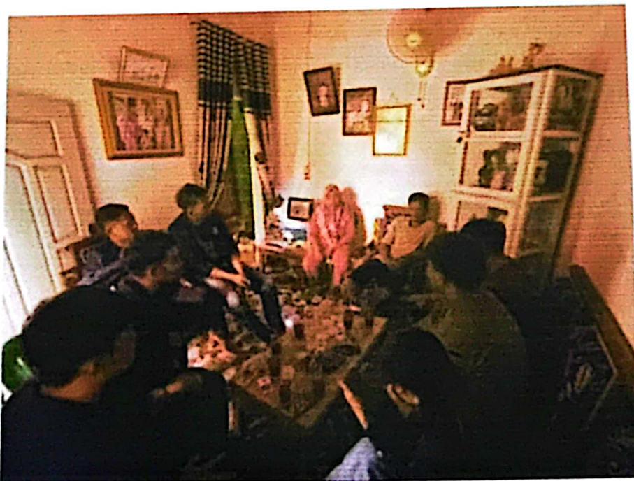
Gambar 2.3 Foto Pemilik UMKM

Mengunjungi lokasi pembuatan Emping Jengkol dan Roti Gabin Tape untuk kebutuhan informasi terkait UMKM mulai dari harga jual, kemasan yang digunakan serta pemasaran.