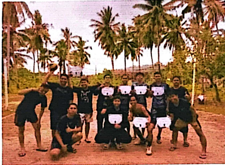
Gambar 2.11 Penyerahan Sertifikat Lomba

Kegiatan ini bertujuan Memberi apresiasi kepada pemenang perlombaan voly yang diselenggarakan oleh mahasiswa PKPM dalam rangka menjalin silaturahmi kepada masyarakat Desa pulau Pahawang