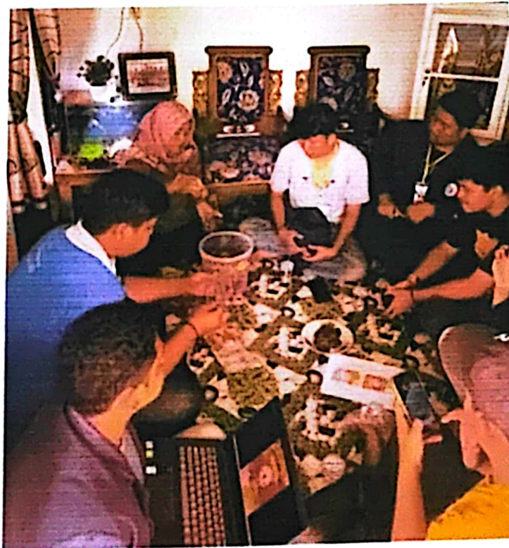
Gambar 2.7 Membantu Pengemasan Produk UMKM