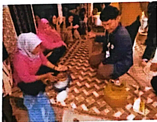
Gambar 2.10 Dokumentasi Pembuatan Coconut Jelly dan Eskrim Santa