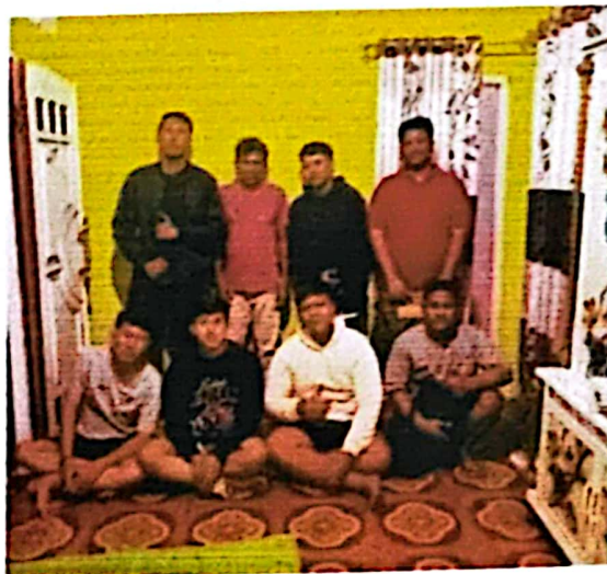
Dokumentasi Foto bersama bapak RT Dusun III Jeralangan