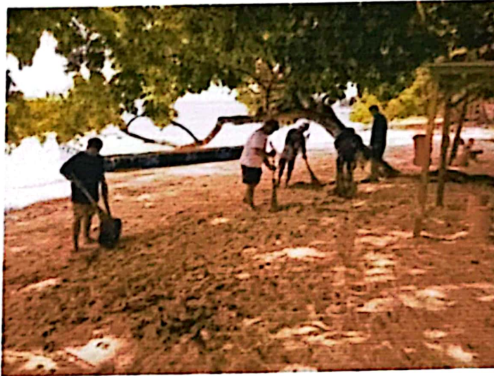
Dokumentasi Kerja bakti membersihkan pantai