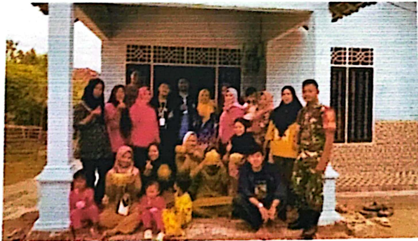
Dokumentasi Foto Bersama ibu-ibu PKK Dan Babinsa