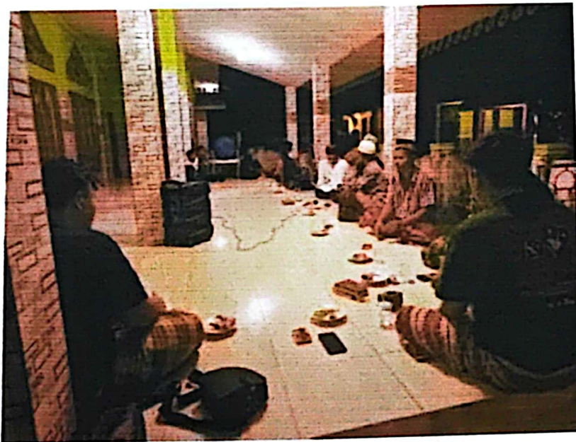
Dokumentasi pengajian bersama bapak-bapak