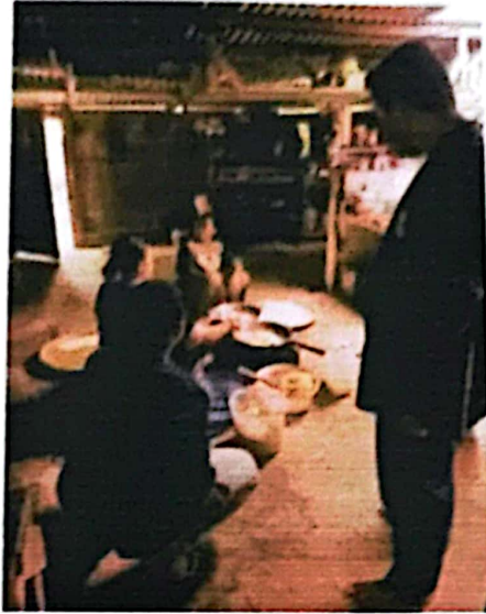
Dokumentasi membantu ibu-ibu membuat kerupuk