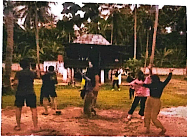
Dokumentasi Kegiatan Senam