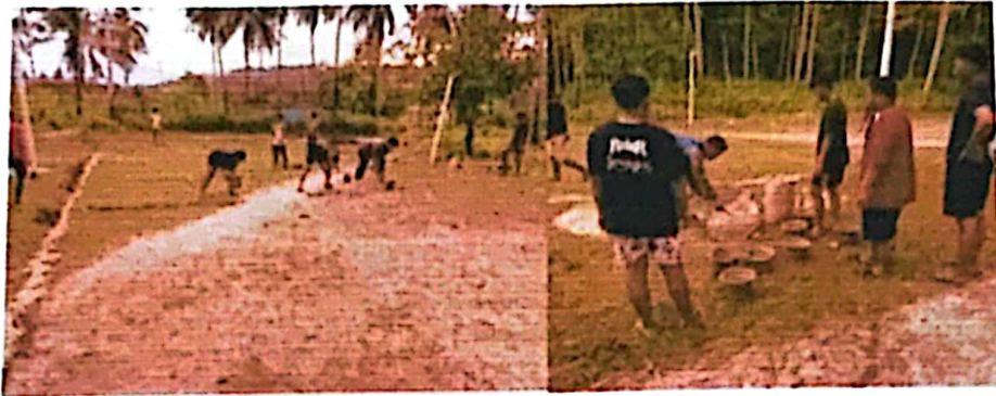
Dokumentasi pembersihan dan membangun kembali lapangan Volly