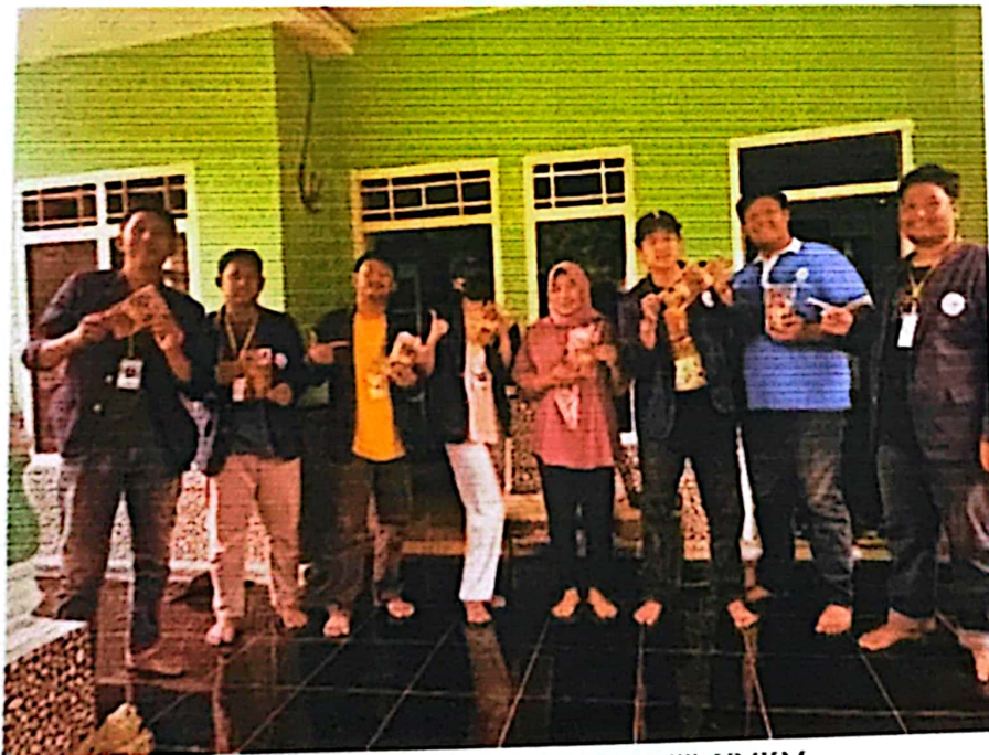
Dokumentasi Foto Bersama Pemilik UMKM