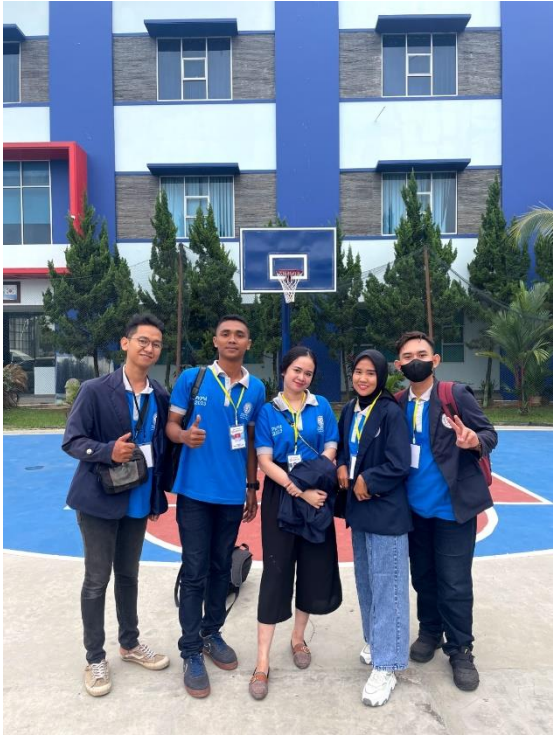
Gambar 2.6 Pemberangkatan PKPM