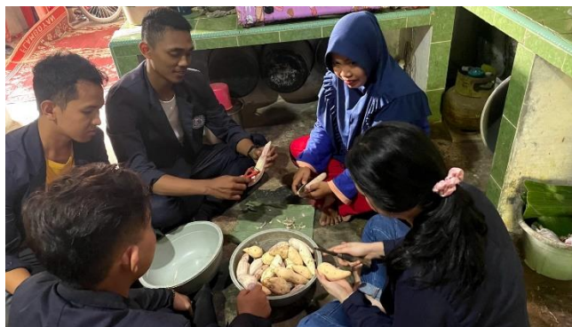
Gambar 2.16 Proses pembuatan keripik ubi keriting