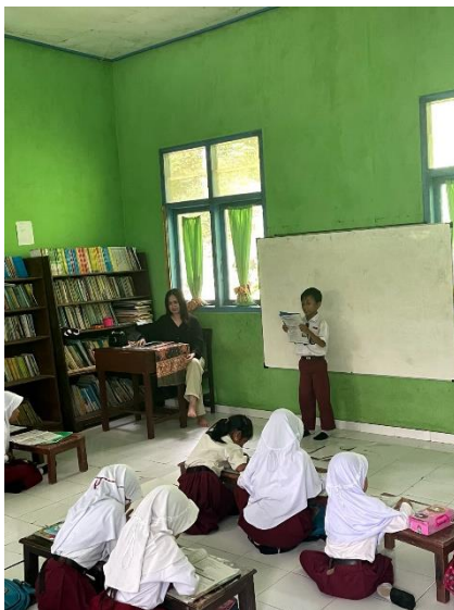
Gambar 2.15 Kegiatan belajar mengajar siswa kelas 2