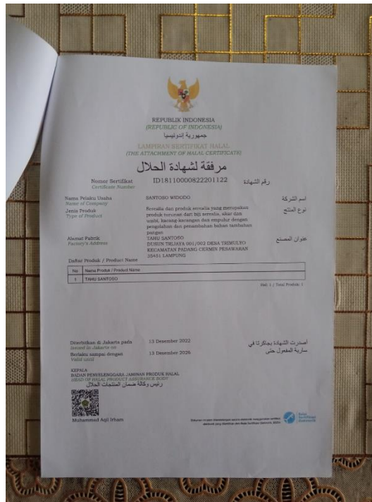
Gambar 2.5 Laporan Sertifikat Halal