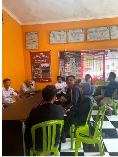
Gambar 2.12 Arahan aparat desa mengenai program kerja