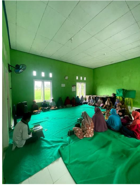
Gambar 2.10 Pengajian bersama ibu-ibu