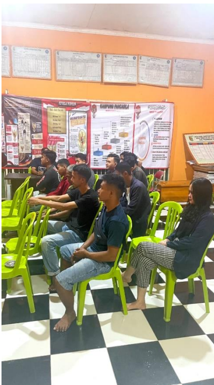
Gambar 2.17 Kumpulan bersama pemuda pemudi desa trimulyo