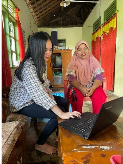
Gambar 2.3 Pelatihan Penggunaan Website