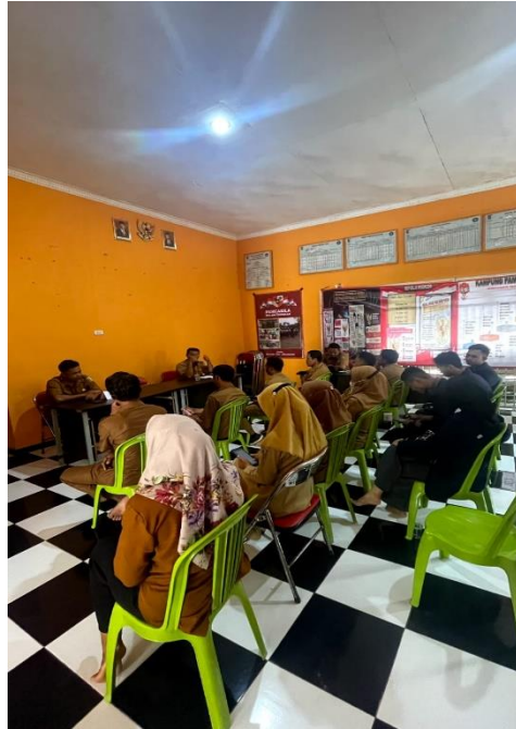
Gambar 2.9 Rapat Koordinasi bersama bapak kepala desa