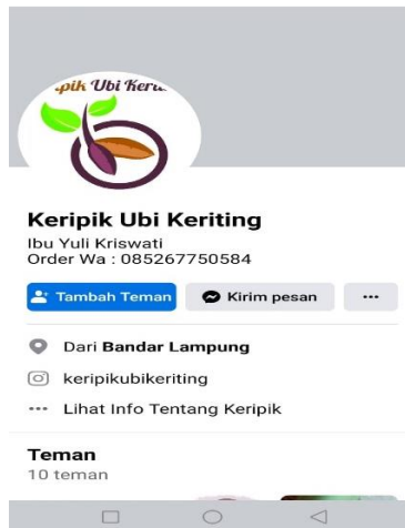
Gambar 2.26 Facebook UMKM