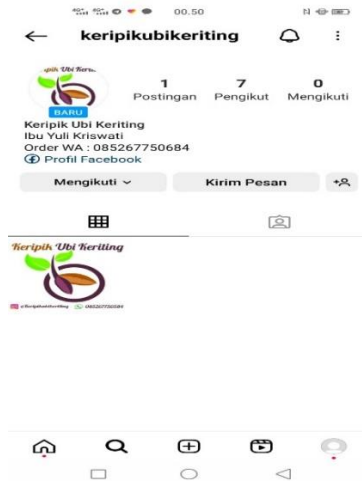
Gambar 2.25 Instagram UMKM