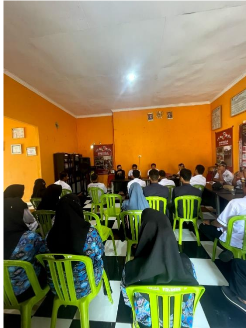
Gambar 2.7 Memperkenalkan kelompok PKPM