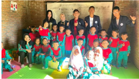
Gambar 2.21 Kunjungan ke TK Desa trimulyo