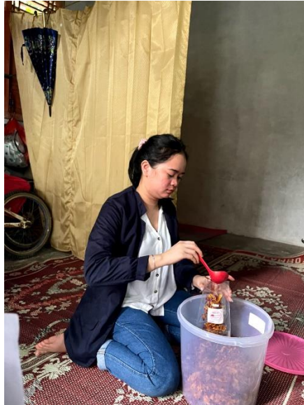
Gambar 2.17 Pengemasan keripik ubi keriting