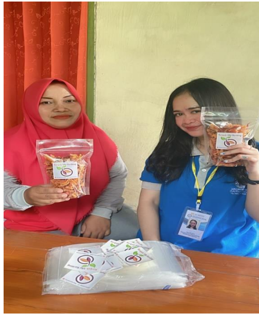
Gambar 2.1 Kunjungan ke UMKM Keripik ubi keriting