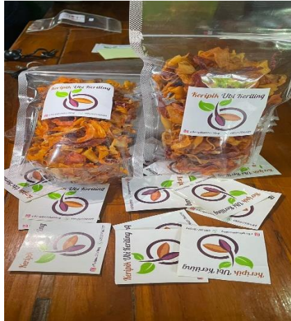
Gambar 2.24 Produk UMKM Keripik ubi keriting