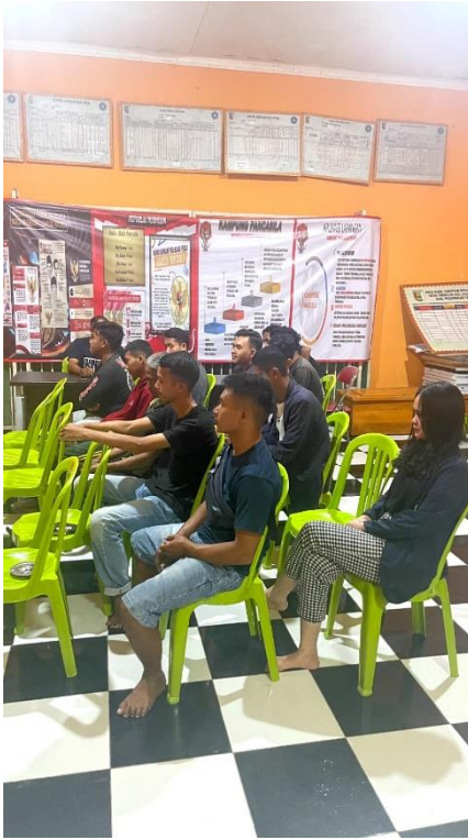
Gambar 2.19 Kumpulan bersama pemuda pemudi desa trimulyo