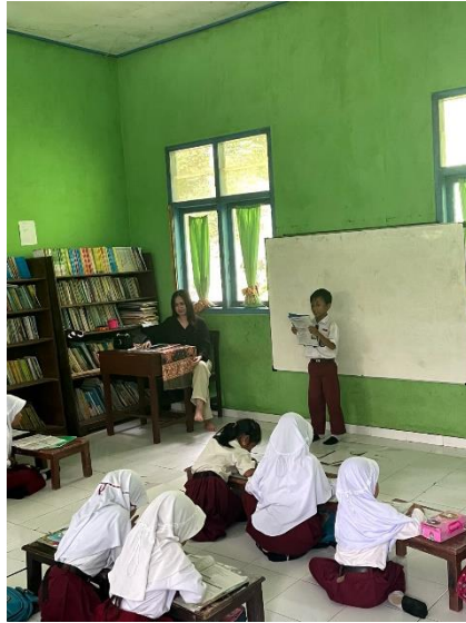
Gambar 2.13 Kegiatan belajar mengajar siswa kelas 2