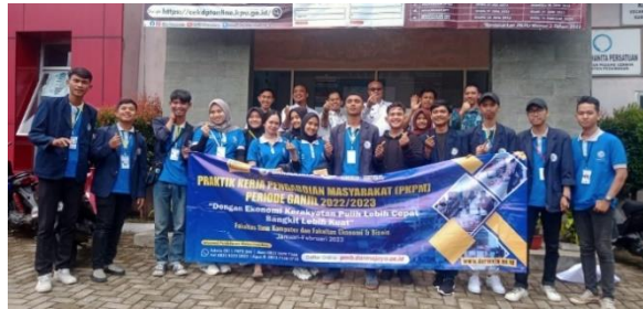
Gambar 2.5 Serah Terima DPL di Kecamatan Padang Cermin