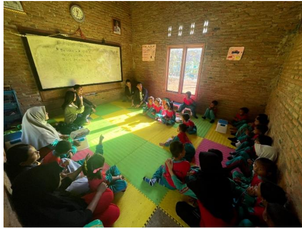
Gambar 2.22 Kegiatan belajar mengajar di TK