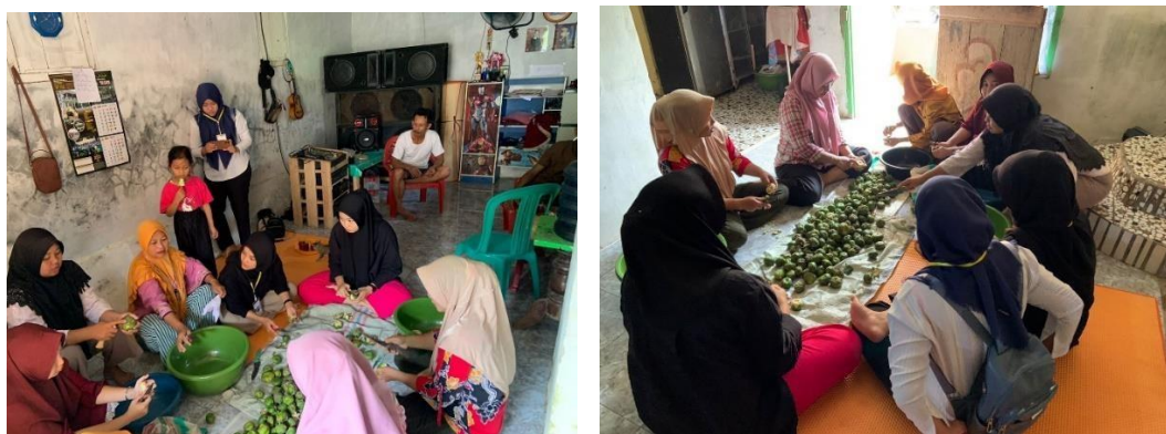
Gambar 7. Survei lokasi dan membantu pengolahan mangrove lasindo

Kunjungan ke UMKM Mangrove Lasindo merupakan kegiatan yang bertujuan untuk mengumpulkan informasi mengenai inovasi dan pemasaran yang akan dilakukan terhadap UMKM tersebut.