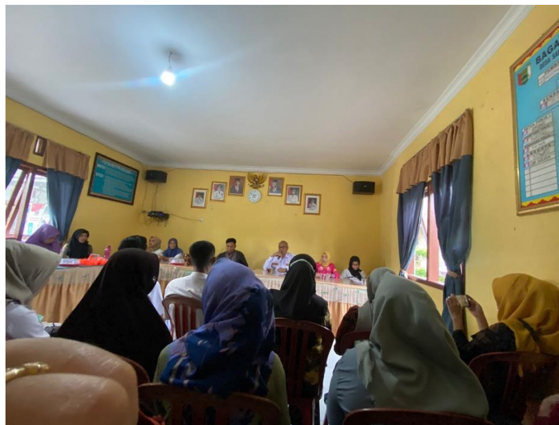
Gambar 5. Ikut serta dalam kegiatan pelantikan Kepala Desa Sanggi

Musyawarah bersama aparat desa sanggi mengenai pelantikan kepala desa merupakan kegiatan yang memang pas pada waktu kedatangan mahasiswa/i pkpm darmajaya dan sekretaris desa melakukan pembagian kelompok untuk melakukan kegiatan pelantikan dan ikut andil dalam acara tersebut.