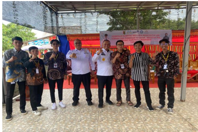
Gambar 6. Ikut serta dalam kegiatan acara kampung KB

Setelah terlaksana acara pelantikan Kepala Desa Sanggi dan Desa Durian, hanyaberjarak 2 hari dilaksanakannya Acara Kampung KB.