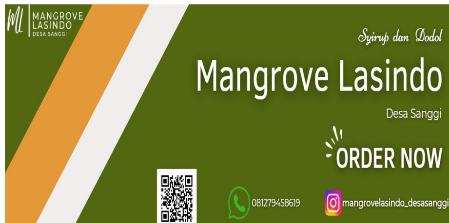
Gambar 3. Tampilan Banner UMKM Mangrove Lasindo Desa Sanggi

Banner ini dibuat agar masyarakat dapat mengetahui sekaligus memesan produk-produk yang di hasilkan oleh UMKM Mangrove Lasindo Desa Sanggi dengan mudah. Sekaligus UMKM dapat dengan mudah diketahui lokasi dan alamat tempat produksi. Pemasangan Banner ini sangatlah membantu dalam bidang pemasaran, sehingga dapat meningkatkan penjualan secara optimal. Dengan demikian saya selaku, mahasiswa IIB Darmajaya Jurusan Teknik Informatika melalui program Praktek Kerja Pengabdian Masyarakat (PKPM) mencoba membantu mengembangkan UMKM Mangrove Lasindo Desa Sanggi ini dengan cara membuat Banner agar supaya masyarakat mengetahui produk yang di hasilkan oleh UMKM tersebut dapat lebih berkembang terutama di pemasarannya,