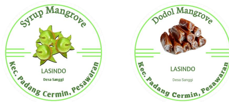
Gambar 2. Tampilan Logo Produk UMKM Mangrove Lasindo Desa Sanggi

Sebelum memasang logo atau merk terlebih dahulu saya meminta izin kepada Ibu PKK untuk tampilan logo UMKM terdapat tulisan nama Desa, kecamatan serta desain logo berbentuk bulat. Memasang logo atau merk pada