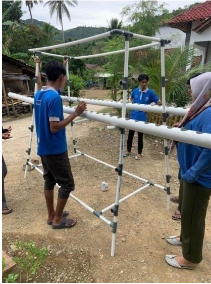
Pengerjaan Pipa untuk Pemasangan Kerangka Hidroponik