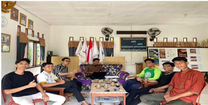
Kunjungan ke Balai Desa Sanggi.