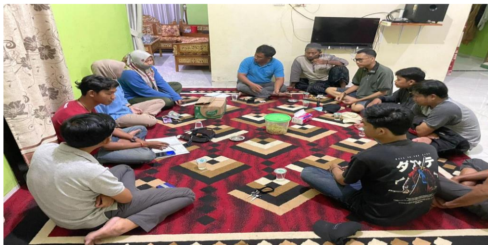
Rapat Pembahasan tentang Hidroponik Seledri dengan Aparatur Desa