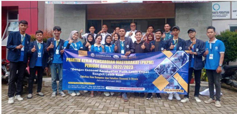
Penerimaan Mahasiswa PKPM Darmajaya kepada Aparatur Kecamatan Padang Cermin.