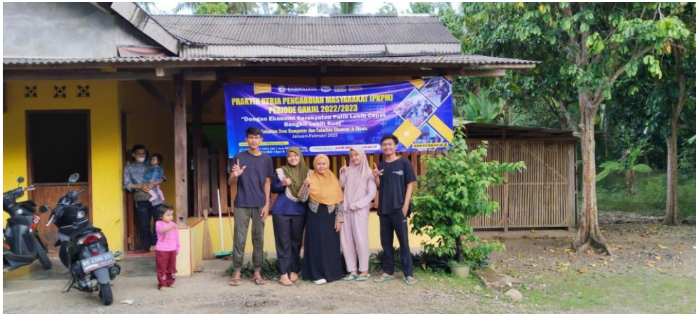
Kunjungan Dosen Pembimbing Lapangan