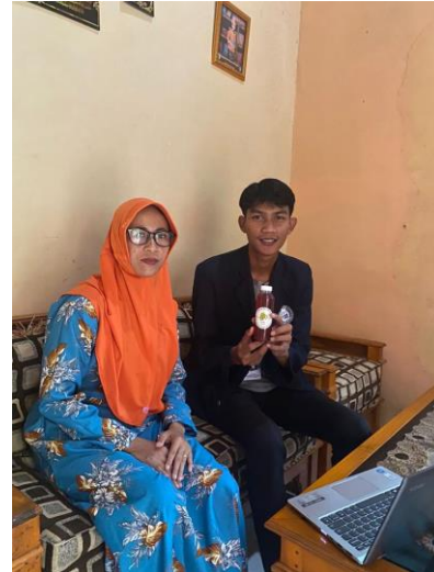
Bersih – Bersih di Balai Desa Penyerahan Logo pada Syrup Mangrove