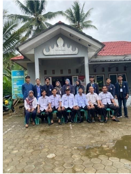
Perpisahan dengan Aparatur Desa Sanggi.