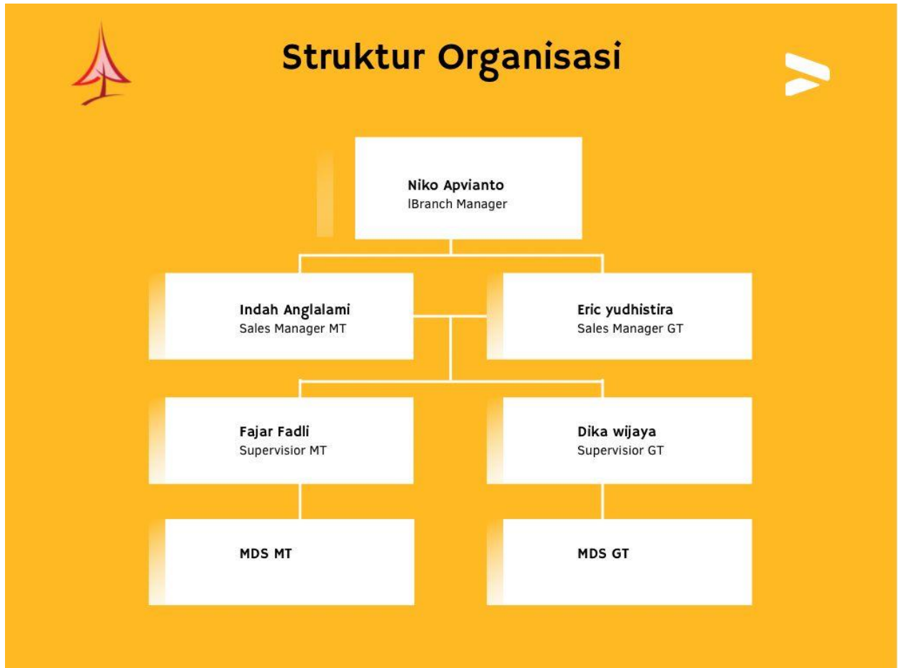
Gambar 4 : Struktur Organisasi Perusahaan