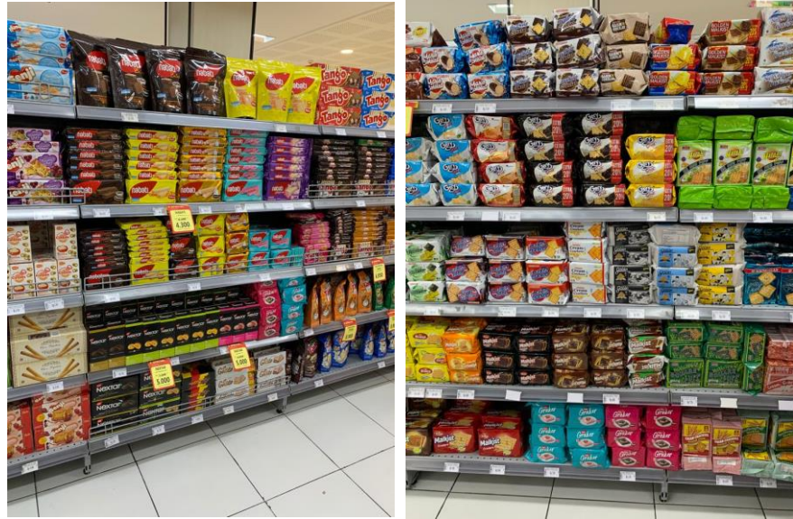
Gambar 1 dan 2 : Planogram penyusunan produk di rak.