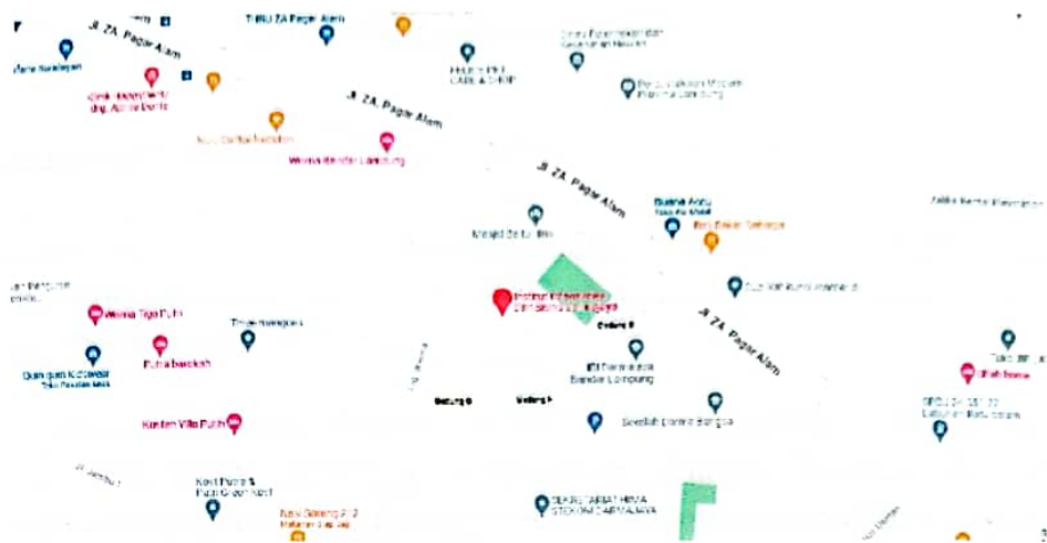
Gambar 2.1 Lokasi IIB Darmajaya

Lampung: INFORMATIKA DAN BISNIS DARMAJAYA