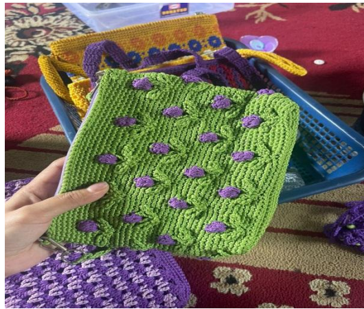
Gambar 12. Tas Rajut yang sudah jadi