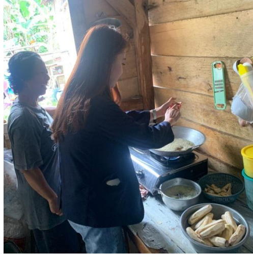
Gambar 9. Membantu menggoreng pisang