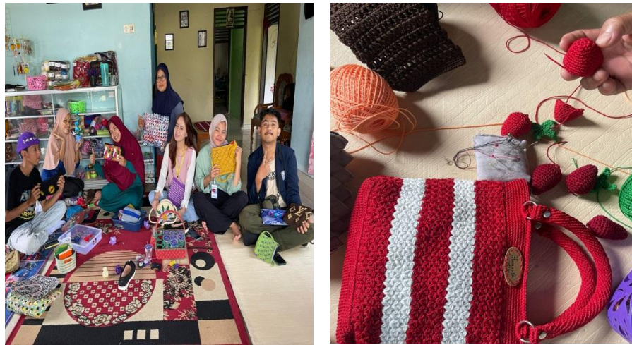
Gambar 11. Membantu Pembuatan Tas Rajut

2023 di UMKM Tas Rajut Desa Hanura, Teluk Pandan Pesawaran Lampung.