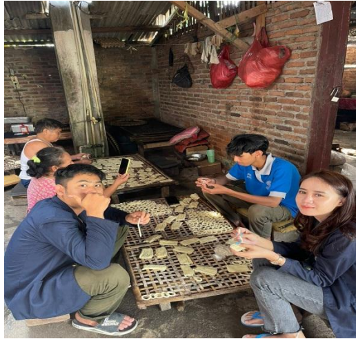
Gambar 17. Membantu Membuat Klanting

Kegiatan ini berlangsung pada hari sabtu 25 Februari 2023. Kegiatan ini bertujuan untuk membantu masyarakat dalam membuat klanting pada UMKM Klanting di Desa Hanura Kecamatan Teluk Pandan Kabupaten Pesawaran.