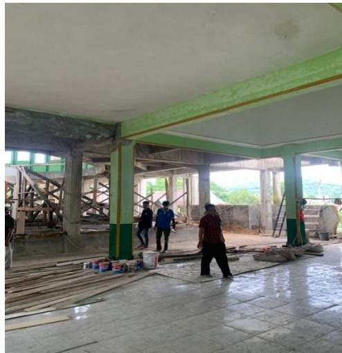
Gambar 16. Membantu Mempersiapkan Plang Himbuan

Kegiatan ini berlangsung pada hari senin 20 Februari 2023. Kegiatan ini bertujuan untuk membantu masyarakat dalam membuat plang himbuan khususnya masyarakat Desa Hanura Kecamatan Teluk Pandan Kabupaten Pesawaran.