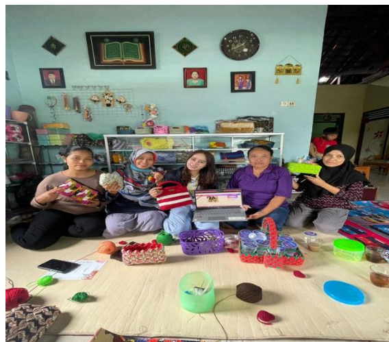
Gambar 6. Membantu Membuat akun Penjual di E-Commerce Shopee

Shopee adalah aplikasi Marketplace online untuk jual beli di ponsel dengan mudah dan cepat. Shopee menawarkan berbagai macam produk-produk mulai dari produk fashion sampai dengan produk untuk kebutuhan sehari-hari. Selain UMKM Keripik Pisang Ngemil Ken, UMKM Tas Rajut juga mendaftarkan ke E-Commerce Shopee dengan tujuan untuk memudahkan proses pemasaran agar bisa lebih meningkatkan penjualan dan pemasukan bagi para pelaku UMKM.