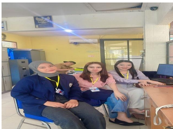
Gambar 14. Piket di Balai Desa

Piket Balai Desa adalah kegiatan dalam rangka membantu pegawai atau perangkat desa di dalam memberikan pelayanan yang baik kepada masyarakat serta kegiatan yang dilakukan untuk membantu mengarsip dokumen-dokumen desa, seperti salah satunya membantu mengarsip BLT (Bantuan Langsung Tunai). Tujuan dari kegiatan piket ini adalah untuk memenuhi program kerja serta untuk membantu perangkat Desa khususnya Desa Hanura Kecamatan Teluk Pandan Kabupaten Pesawaran.