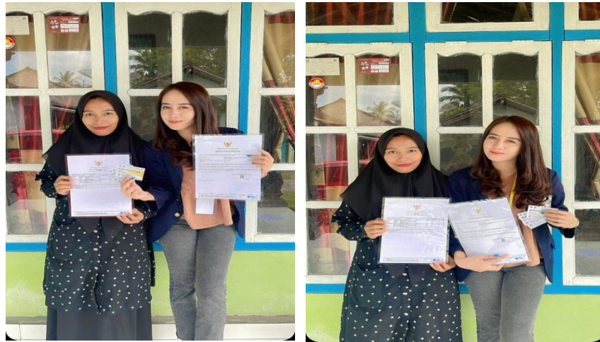
Gambar 3. Memberikan Pendampingan Pendaftaran NIB pada UMKM Ngemil Ken