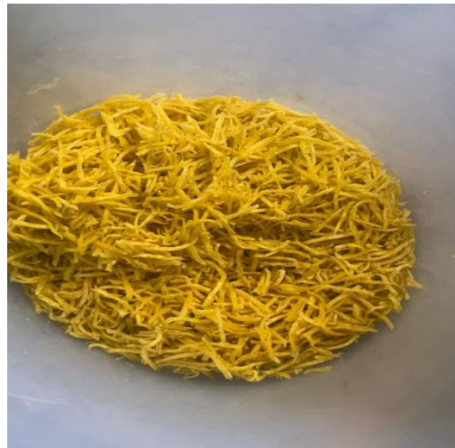
Gambar 10. Keripik Pisang yang sudah digoreng