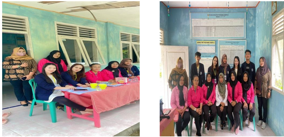
Gambar 13. Partisipasi dalam kegiatan Posyandu

yang sudah melakukan kegiatan posyandu pada tanggal 8 Februari 2023.