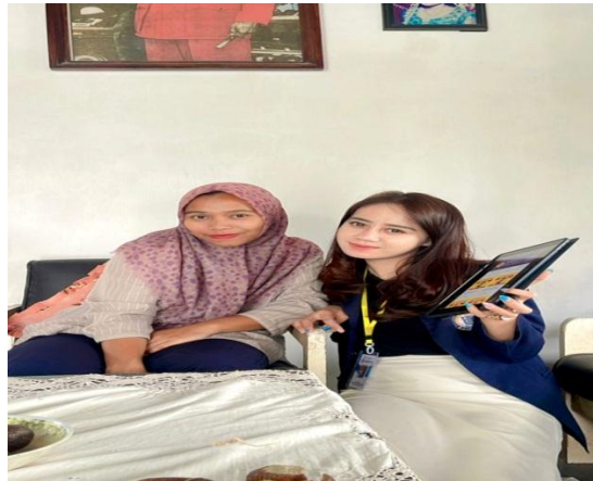
Gambar 4. Membantu Membuat akun Penjual di E-Commerce Shopee

Selain memberikan pendampingan perizinan NIB (Nomor Induk Berusaha). saya juga membantu untuk memasarkan produk UMKM Kerupuk Seblak di E-Commerce Shopee. pada kegiatan ini berjalan lancar. Setelah memberikan pelatihan pemilik umkm menerapkan apa yang diperolehnya dengan membuat akun Penjual Shopee dengan guna untuk membantu memasarkan produknya agar lebih dapat dikenal masyarakat.