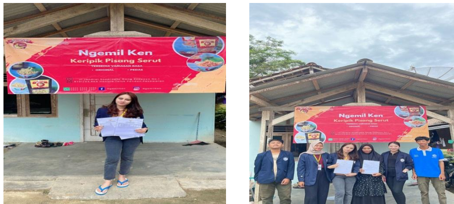
Gambar 19. Pemasangan Banner di UMKM Keripik Pisang Ngemil Ken

di UMKM Keripik Pisang Ngemil Ken Dusun A Desa Hanura Teluk Pandan Pesawaran Lampung.