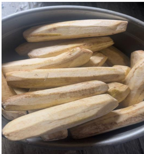
Gambar 8. Hasil pisang yang sudah dikupas