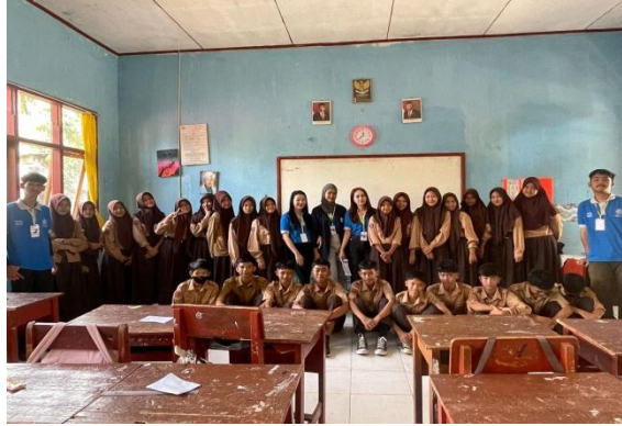
Gambar 15. Sosialisasi ke SMPN 2 Pesawaran

Dalam kegiatan ini sosialisasi dilakukan pada Siswa dan Siswi SMPN 2 Pesawaran yang beralamatkan di Jalan Pramuka Barat No. 8, Hanura, Kec. Teluk Pandan, Kab. Pesawaran, Lampung , dengan kode pos 35451.