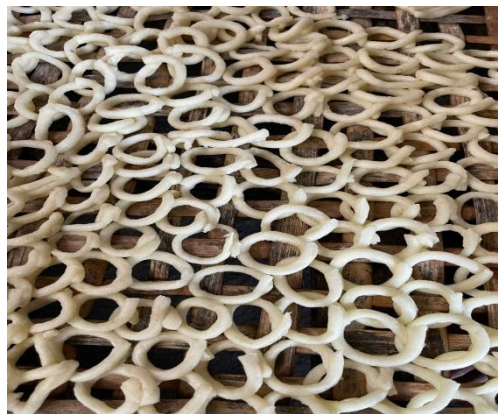
Gambar 18. Hasil Pembuatan Klanting