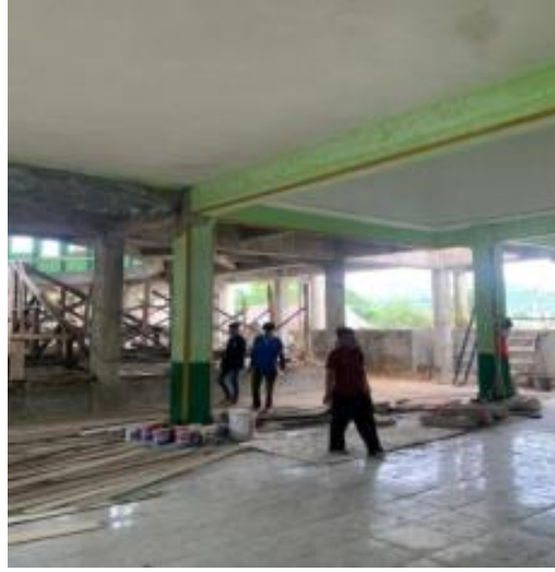
Gambar 2.7 Membantu Persiapan Pembuatan Plang

Kegiatan ini berlangsung pada hari senin 20 Februari 2023. Kegiatan ini bertujuan untuk membantu masyarakat dalam membuat plang hibauan khususnya masyarakat Desa Hanura Kecamatan Teluk Pandan Kabupaten Pesawaran.