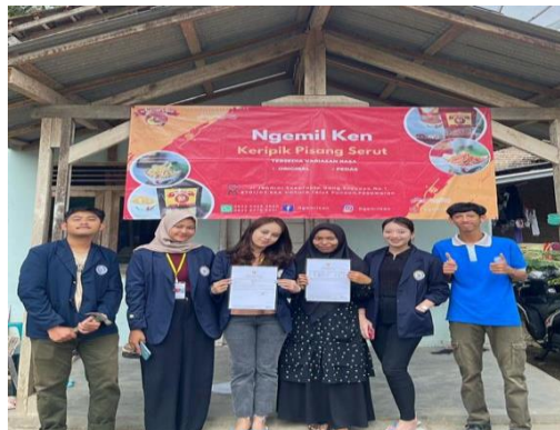
Gambar 2.10 Pemasangan Banner UMKM Ngemil Ken

Kegiatan ini bertujuan untuk membantu mengenalkan keripik pisang kepada pembeli agar lebih cepat mengetahui alamat produksi keripik pisang. Selain itu untuk Meningkatkan promosi UMKM. Media promosi dengan menggunakan banner dianggap lebih efektif. Ada berbagai jenis banner dan ukurannya yang dapat dipilih menyesuaikan kebutuhan. Kegiatan ini dilakukan pada hari Selasa 28 Februari 2023 di UMKM Keripik Pisang Ngemil Ken Dusun A Desa Hanura Teluk Pandan Pesawaran Lampung.