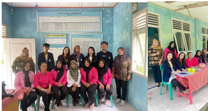
Gambar 2.5 Berpartisipasi Dalam Kegiatan Posyandu

Posyandu (pos pelayanan terpadu) merupakan upaya pemerintah untuk memudahkan masyarakat Indonesia dalam memperoleh pelayanan kesehatan ibu dan anak. Memberikan beragam informasi mengenai kesehatan ibu dan anak, seperti pemberian ASI, MPASI, dan pencegahan penyakit. Memantau tumbuh kembang anak, sehingga anak terhindar dari risiko kekurangan gizi atau gizi buruk. Mendeteksi sejak dini bila terdapat kelainan pada anak, ibu hamil, dan ibu menyusui, sehingga penanganan dapat segera dilakukan memberikan imunisasi lengkap. Dalam kegiatan ini berlangsung pada hari Rabu 08 Februari 2023 di UMKM Keripik Pisang Serut Desa Hanura, Teluk Pandan Pesawaran, Lampung.