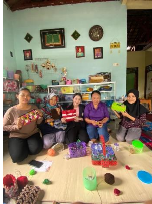
Gambar 2.9 Kunjungan Ke UMKM Rajut

Mengunjungi UMKM Rajut Hanura's Craft untuk mengetahui informasi terkait UMKM mulai dari harga jual, proses pembuatan, kemasan yang digunakan serta pemasaran. Dalam kegiatan ini berlangsung pada hari Selasa 14 Februari 2023 di UMKM Rajut Desa Hanura, Teluk Pandan Pesawaran, Lampung.