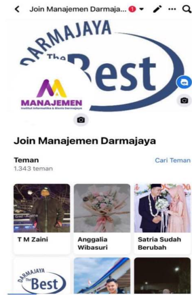
Gambar 4.1.2.2 Jumlah Pengikut sesudah adanya konten