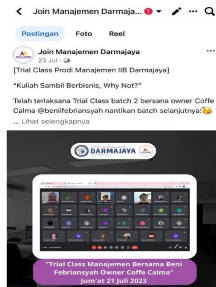
Gambar 4.1.1.2 Trial Class Batch 2