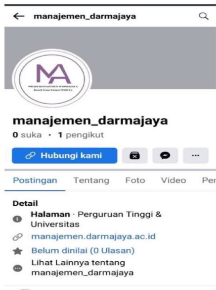
Gambar 4.1.2.1 Jumlah pengikut sebelum adanya konten