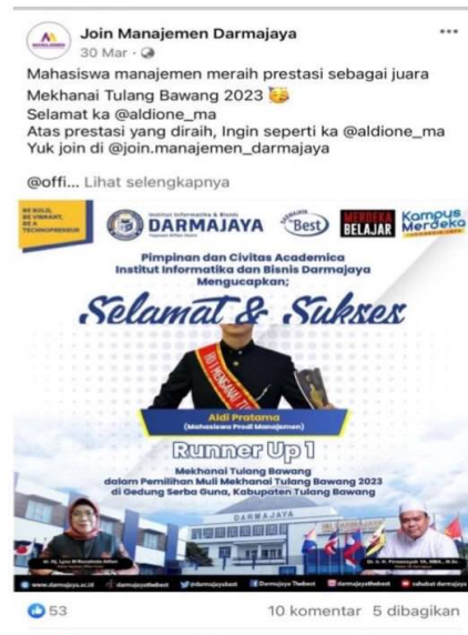
Gambar 4.1.4.2 Jumlah like sesudah dilakukan optimalisasi pemasaran