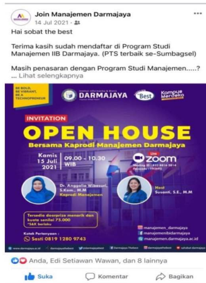
Gambar 4.1.4.1 Jumlah like sebelum dilakukan optimalisasi pemasaran