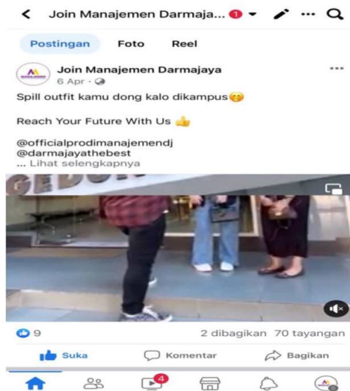
Gambar 4.1.1.3 Jumlah views sesudah dilakukan postingan konten promosi