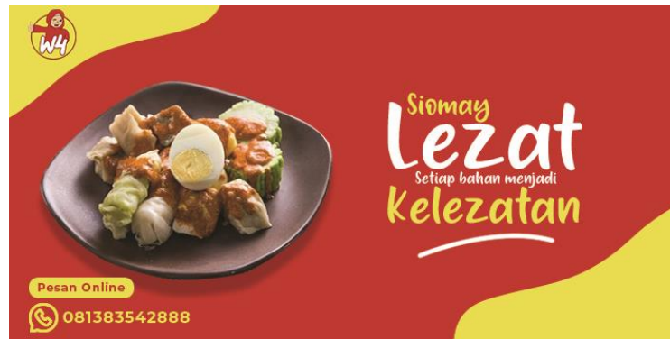
Gambar 2.6 Hasil Desain Label Kemasan