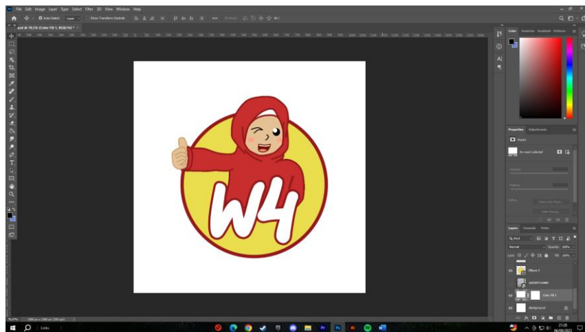
Gambar 2.3 Digitalisasi Logo