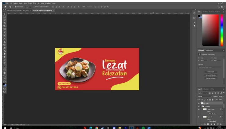
Gambar 2.5 Proses Perancangan Label Kemasan

Membantu dalam perancangan desain label kemasan produk UMKM yang bertujuan sebagai identitas produk, memberikan informasi produk, dan fungsi ketertarikan bagi konsumen saat ingin membeli. Kegiatan ini dilaksanakan pada senin, 21 Agustus 2023.