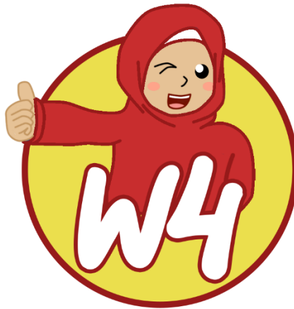
Gambar 2.4 Hasil Digitalisasi Logo