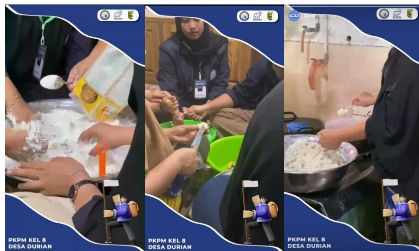
Gambar 2.7 Membantu Proses Produksi Siomay

Membantu dalam Kegiatan proses pembuatan Siomay seperti pembuatan adonan siomay dan memasukan adonan ke dalam kulit tahu yang kemudian akan di rebus bersama anggota kelompok. Kegiatan ini dilaksanakan pada Rabu, 09 Agustus 2023.