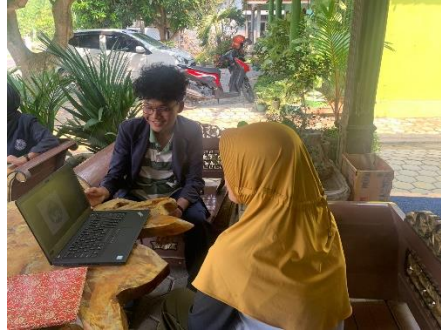
Gambar 2.8 Pemaparan Makna Dari Desain yang Sudah di Buat