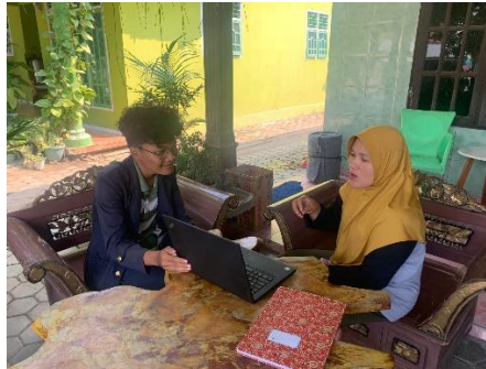
Gambar 2.9 Penyerahan Softfile Desain yang Sudah dibuat